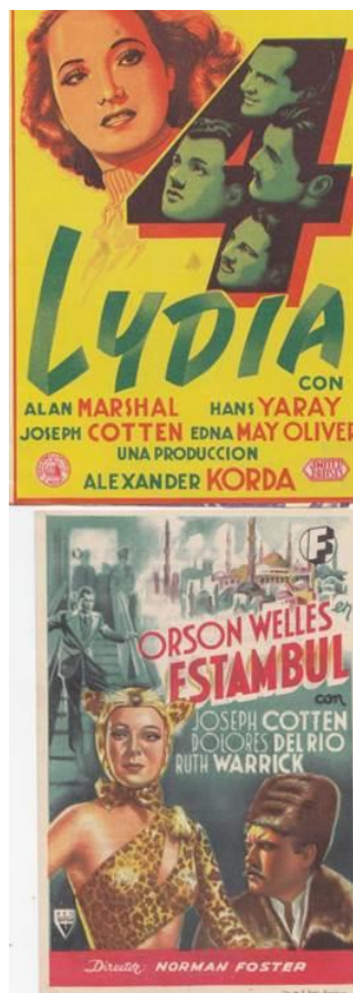
Programas de mano de ambos filmes.