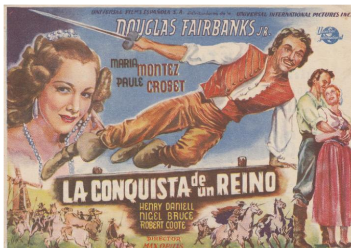
La conquista de un reino.

Los forcejeos con la Universal Pictures comenzaron cuando se negó a protagonizar “La dama de la frontera”, que realizó Yvonne de Carlo. María Montez había demandado a la Universal debido a que, aunque figuraba como protagonista, solo aparecía 20 minutos en el film “La conquista de un reino” 12 .