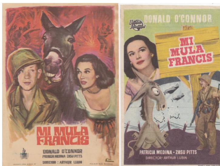
Dos programas de mano de "Mi mula Francis".

The Fighting O'Flynn/ El capitán O'Flynn (1949) Abbott and Costello in the Foreign Legion/ La Legión Extranjera (1950) Francis/ Mi mula Francis (1950) Fortunes of Captain Blood (1950)