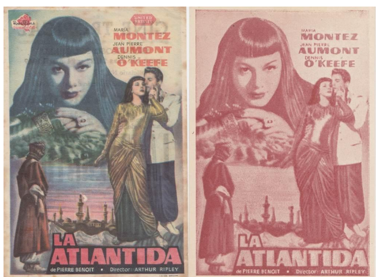
La Atlántida (dos programas de manos distintos).

Decide dejar la Universal y trabaja con United Artists en su último film en Hollywood: “La Atlántida”.