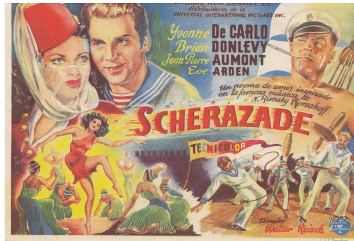
Programa de mano