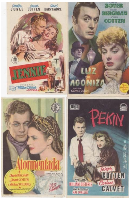
Programas de mano.

The Shadow of a doubt/ La sombra de una duda (1943) Gaslight/ Luz que agoniza (1944)