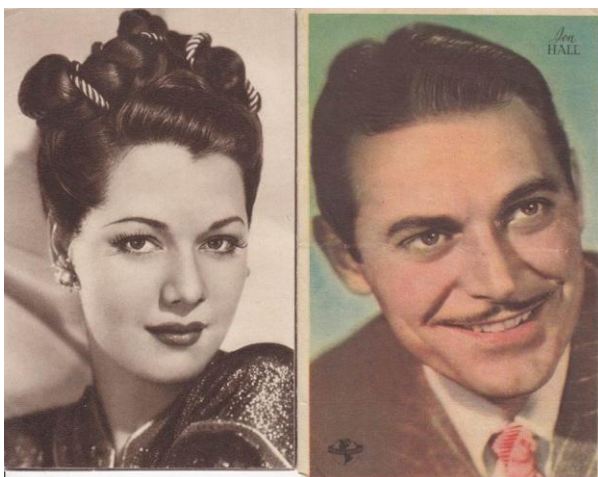
María Montez y Jon Hall.

Trabajó en muchas ocasiones con Jon Hall y Sabú, pero el primero tuvo que enrolarse en el ejército 10 por lo que fue reemplazado por Turhan Bey en “Alí Baba y los Cuarenta ladrones”.