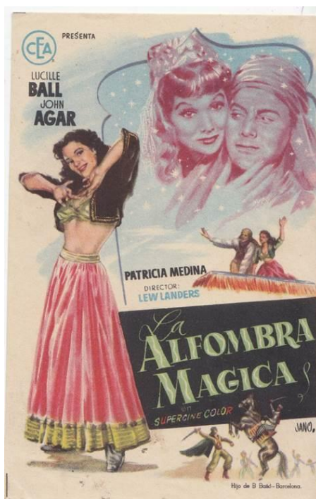
Programa de mano.

Estas dos artistas de ascendencia canaria nunca trabajaron juntas, la verdad es que la fama de María Montez fue en los años 40, mientras que la de Patricia Medina lo fue en los años 50 y 60 del siglo pasado. Cabe destacar que a la muerte de María Montez en 1951 Patricia Medina realizó tres filmes de corte oriental y arábigo: La alfombra mágica (1951).