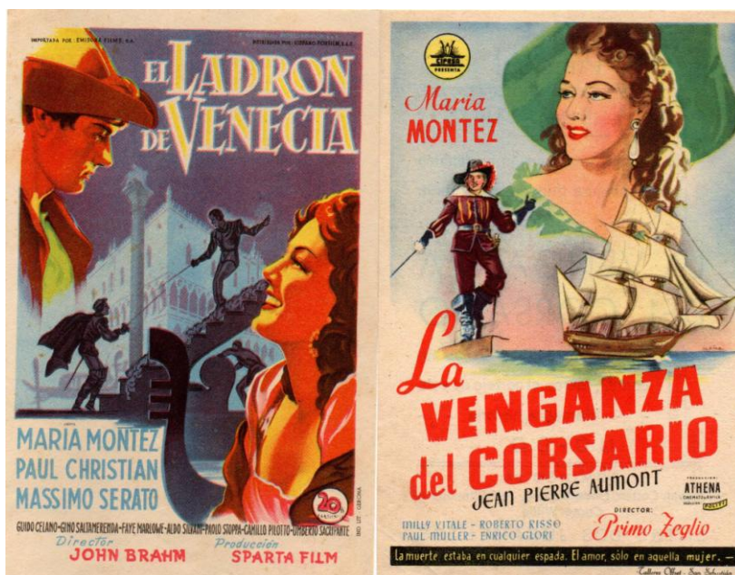
Programa de mano.

La pareja volvió a Francia 13 , donde fueron recibidos con gran afecto. Una vez en este país actuó en una obra de teatro “L’Ille Heureuse” (La isla feliz) y se introdujo en el mundo literario. Entre sus obras destacan: “HollyWolves I Have Tamed”, “Reunion in Lilith” y “Forever is a Long Time”. Escribió asimismo gran número de poesías y dos canciones. En Francia y en Italia protagonizó cinco filmes, entre ellos “El ladrón de Venecia” y “La venganza del corsario” (último film de la actriz).