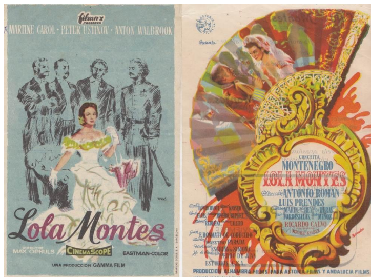
Programas de mano de dos filmes sobre Lola Momtes 8

María Montez ganó fama en los años de 1940, filmando gran número de películas en technicolor. Fue muy popular por su indumentaria fantástica de tipo oriental y sus costosas joyas, y sobre todo su belleza exótica, seductora latina. Siempre conservó su acento hispano. En 1941 debutó en el cine con el film “Boss of Bullion City”, en el papel de Linda Calhoun.