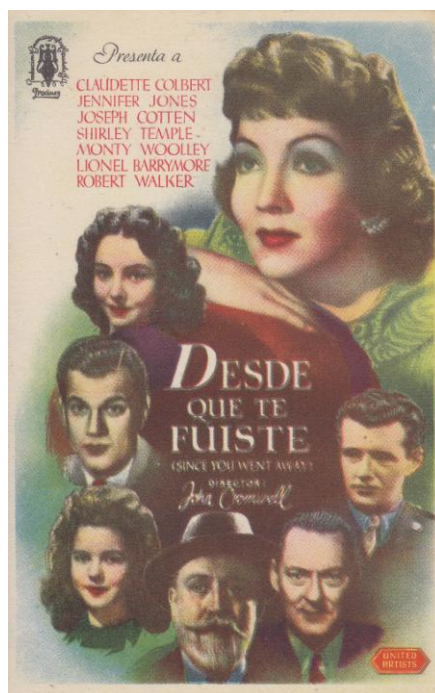
Programa de mano.

Since you Went Away/ Desde que te fuiste (1944)