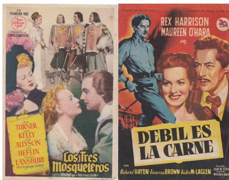
Programas de mano de “Los tres mosqueteros” y “Débil es la carne”.

que se había casado en 1941. En Hollywood llegó a rodar cuatro películas en un mismo año. Sus primeros filmes importantes fueron en “Débil es la carne” y en “los Tres Mosqueteros” en papeles breves.