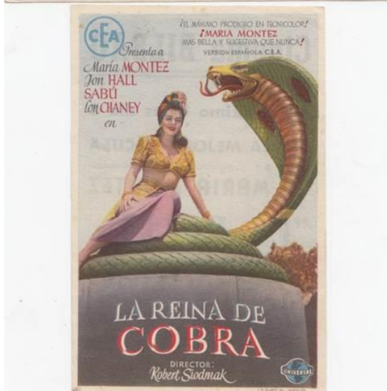
Programas de mano.