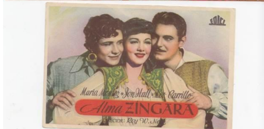
Programas de mano.