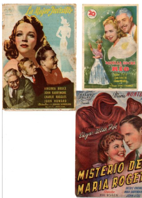
Programa de mano de “Aquella noche en Río”, “Jinetes del desierto” y “El misterio de María Roget”

En su corta carrera cinematográfica participó en 26 filmes, 21 de los cuales fueron rodados en Estados Unidos y el resto en Europa: en Francia e Italia. Colaboró en filmes importantes como “Aquella noche en Río”, “Jinetes del desierto” que fue la primera película en la que aparece en el ambiente del Lejano Oriente. Asimismo colaboró con la Universal Pictures en “Misterio de María Roget” (basado en la obra homónima de Edgar Allan Poe).