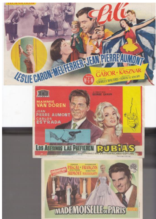
Programas de mano de los filmes.