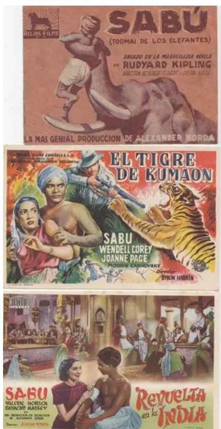
Algunos filmes de Sabú.