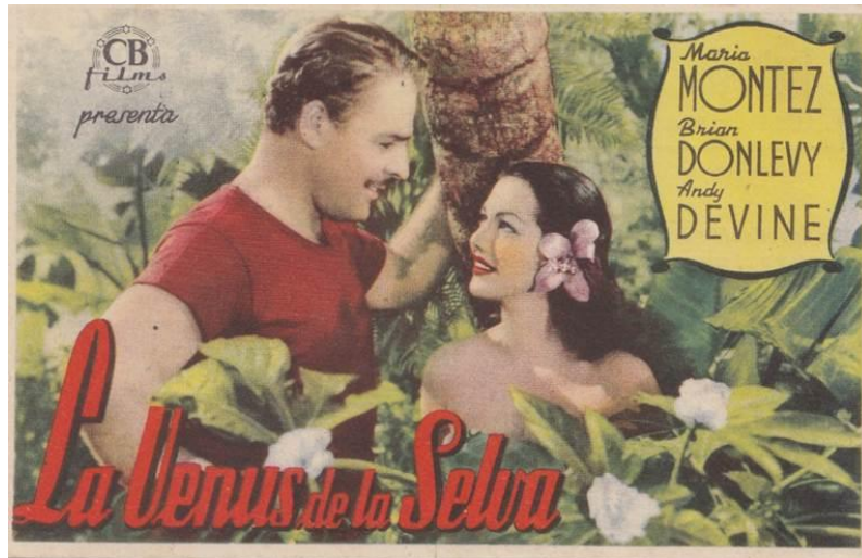
Programa de mano de “La salvaje blanca”.

A continuación protagonizó “La salvaje blanca”.