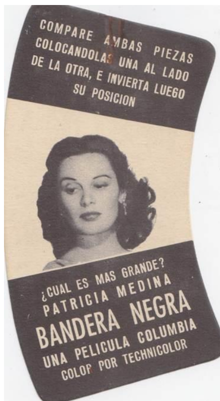
Programa de mano troquelado.