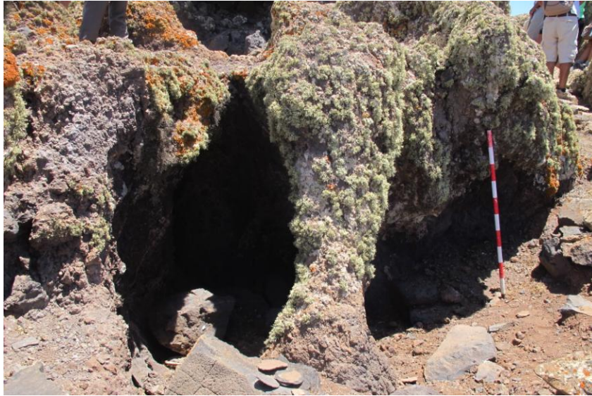
N. ° 2. Cueva labrada en la cima de El Castillejo.