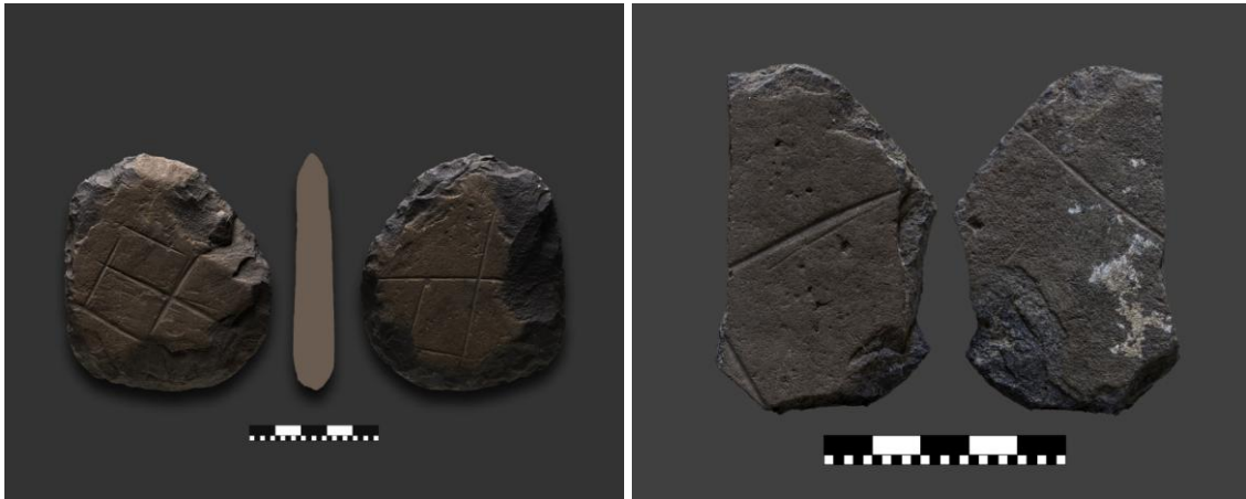
N. ° 3 y 4. Piezas líticas con bordes trabajados e incisiones en ambas caras realizadas con la técnica de la fricción.