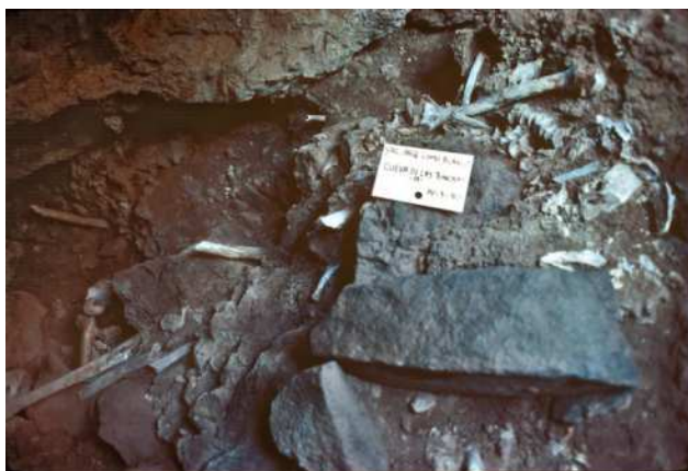
Figura 1. Excavación de la Cueva de Las Tuneras en 1980

- Cueva de las Tuneras : corresponde a un tubo volcánico de reducidas dimensiones en el que se documentó un total de cuatro individuos, para los que solo se aporta la disposición en decúbito lateral de uno de ellos (Figura 1).