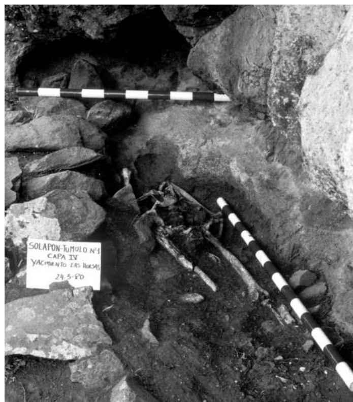
Figura 3. Solapón-Túmulo 1

aportado unas cronologías que van de los siglos XI al XIV d.C. (tabla2). Las imágenes de la intervención arqueológica conservadas en el archivo de El Museo Canario permiten apreciar que el espacio sepulcral fue producto de una concepción unitaria. Se observa la preparación de un único receptáculo, mediante la habilitación de un contenedor configurado a partir del rebaje de la pared del abrigo, a la que se adosa una estructura de piedras de tendencia semicircular, y entre ambos un espacio libre, donde se acomodaron los cuerpos (Figura 3). Tras el depósito funerario, el receptáculo fue cubierto con un enlosado de piedras. Estaríamos pues ante una unidad sepulcral destinada a un depósito doble. Dado que esta información arqueológica apunta a la coetaneidad de los depósitos funerarios, se optó por abordar un tratamiento estadístico bayesiano de las tres dataciones disponibles, que tuviera en cuenta esa premisa de partida. Los resultados obtenidos avalan que la llegada al sepulcro de los dos adultos y los dos ovicápridos fue simultánea o tuvo lugar en un plazo de tiempo muy corto. Ello permite considerarlo un único evento, situando el hecho funerario entre los años 1216-1286 d. C (Figura 4).