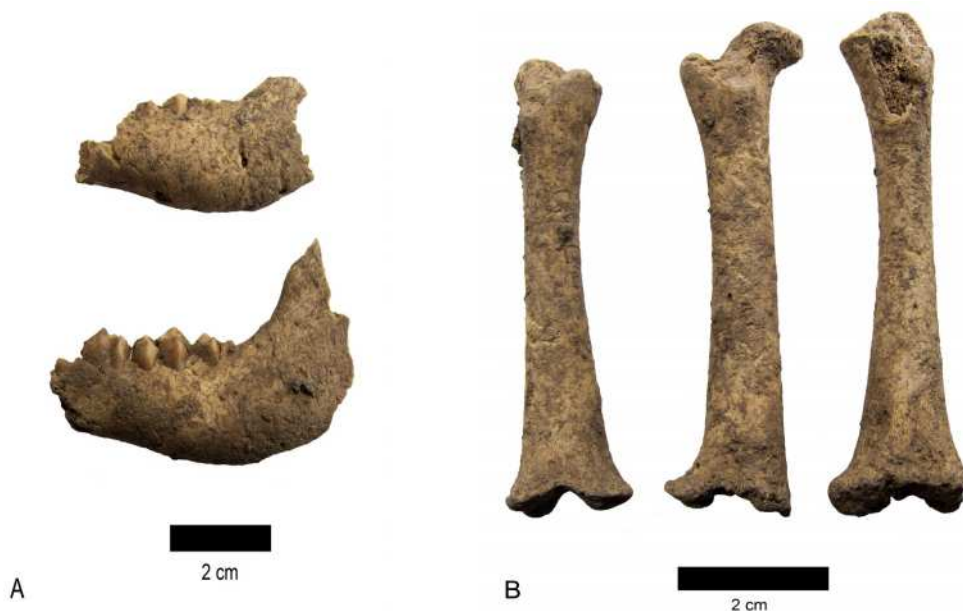
Figura 6. Restos óseos de una cabra y una oveja perinatales procedentes del Solapón-Túmulo 1. A. Hemimandíbula izquierda de oveja (arriba) y de cabra (abajo). B. Fémur izquierdo de cabra (izquierda), fémur derecho de cabra (centro) y fémur izquierdo de oveja (derecha).

La revisión de los materiales arqueológicos de las tres cavidades de Las Huesas, además de los restos humanos, ha revelado la presencia específica de huesos de ovicaprinos –una oveja y una cabra perinatales– en el Solapón-Túmulo 1 (Figura 6). Este hallazgo reviste un especial interés por tratarse de una situación que en el ámbito funerario grancanario solo ha sido registrada en una pequeña cueva del barranco de La Puerca, en Gáldar, con la que comparte muchos de sus rasgos, como el reducido número de individuos (dos) que en ella se dieron sepultura 27 .