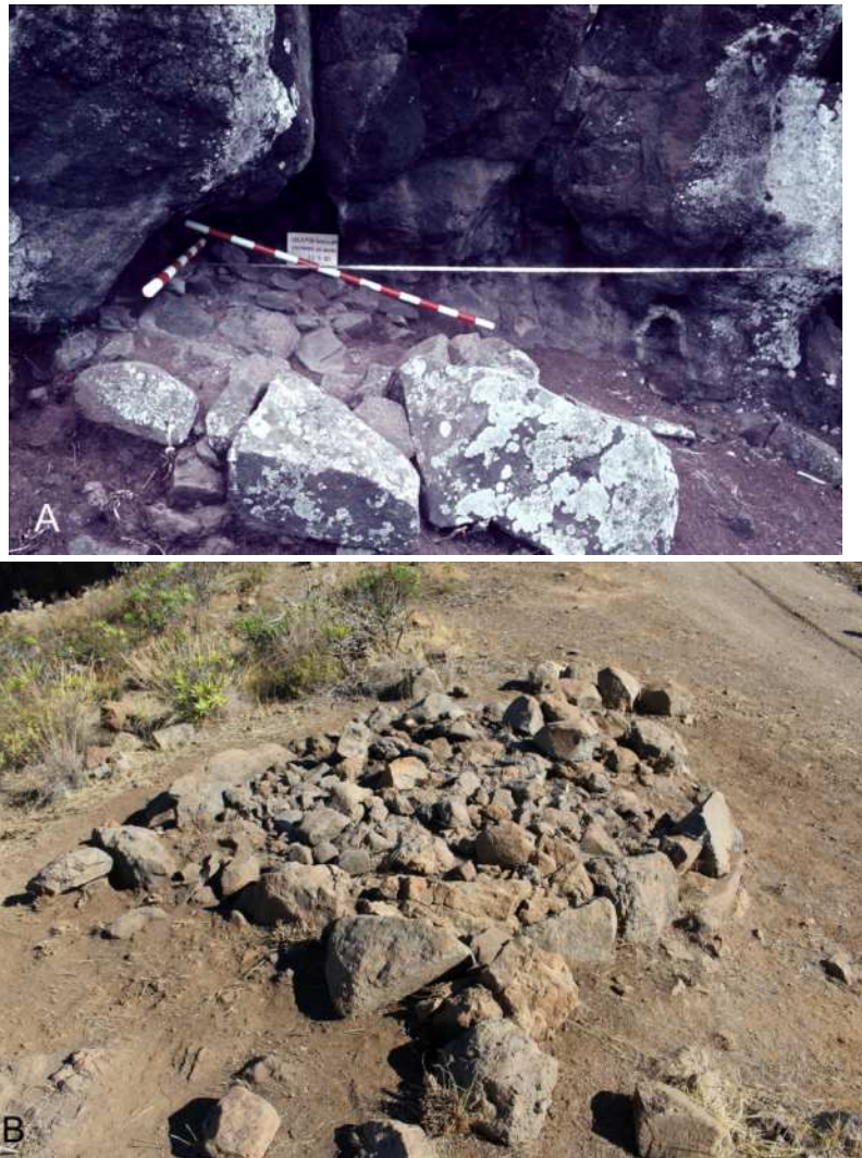
Figura 5. A. Solapón-Túmulo 1 con enlosado de piedra cubriendo el depósito funerario. B. Cista funeraria en la Mesa de Soria, San Bartolomé de Tirajana.

La cueva Drago 2 presenta unas características que la alejan, como en el caso anterior, de la realidad observada para la Cueva de Las Tuneras, por concentrar restos óseos correspondientes en su casi totalidad a sujetos perinatales.