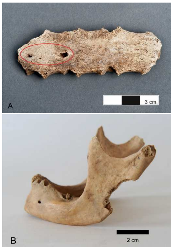
Figura 2. A. Esternón con impactos de dientes de perro. B. Mandíbula con bordes crenulados y eliminación de hueso en rama izquierda y ambos cóndilos, causados por perro.

Las dataciones radiocarbónicas obtenidas a partir de los restos óseos de uno de los sujetos perinatales y un adulto ubican el uso funerario del espacio entre el siglo V y la primera mitad del VI d. C. (tabla2).