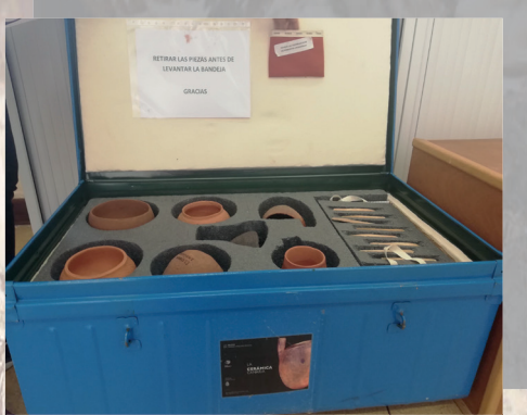
Mañeta de préstamo dentro de la oferta didáctica propuesta por el MUNA, Santa Cruz de Tenerife.