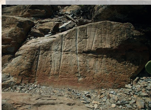
Grabados rupestres de Aripe, Guía de Isora, Santa Cruz de Tenerife.

El objetivo de esta investigación, por tanto, se ciñe a ese valor primordial de la socialización del patrimonio y analiza de qué manera, este proceso se ha llevado a cabo en la Isla de Tenerife y en el resto de islas, dando lugar a una "insularización" de la propia gestión del patrimonio arqueológico.