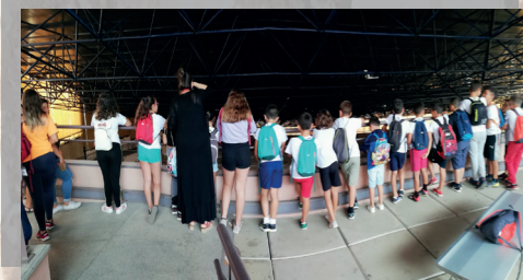
Grupo escolar de visita en el Museo y Parque Arqueológico Cueva Pintada de Gáldar, Gran Canaria.