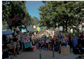
Fotografía 1. Mitmachforum. Imagen tomada en junio de 2020 durante la asamblea para el diseño colectivo de la superficie en Volkmarisdorf..

Los solares fueron centrales para el planeamiento y otros aspectos relacionados con detener y revertir el vaciamiento de Leipzig (Johnson et al. 2014). Así, desde finales de los noventa surgieron en esos espacios jardines comunitarios y otros usos temporales, así como otros de carácter permanente como parques o equipamientos sociales. Como resultado, entre 1998 y 2014 la superficie de solares en la ciudad se redujo de 2000 Ha a la mitad (Stadt Leipzig 2014: 26). Lo que significa una pérdida de biodiversidad, espacios de encuentro y lugares espontáneos (o no) para la acción política y en los que puede tener lugar un orden contrahegemónico.