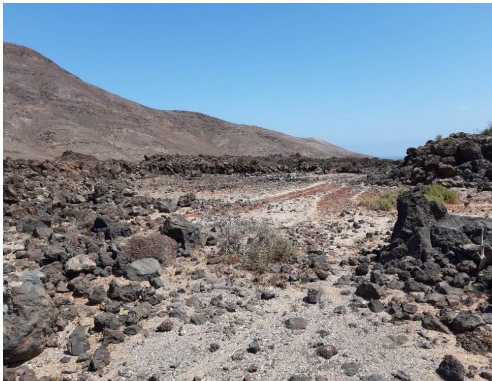
Figura 7. Vista de la estructura E2 desde el exterior de la misma, frente a su entrada.