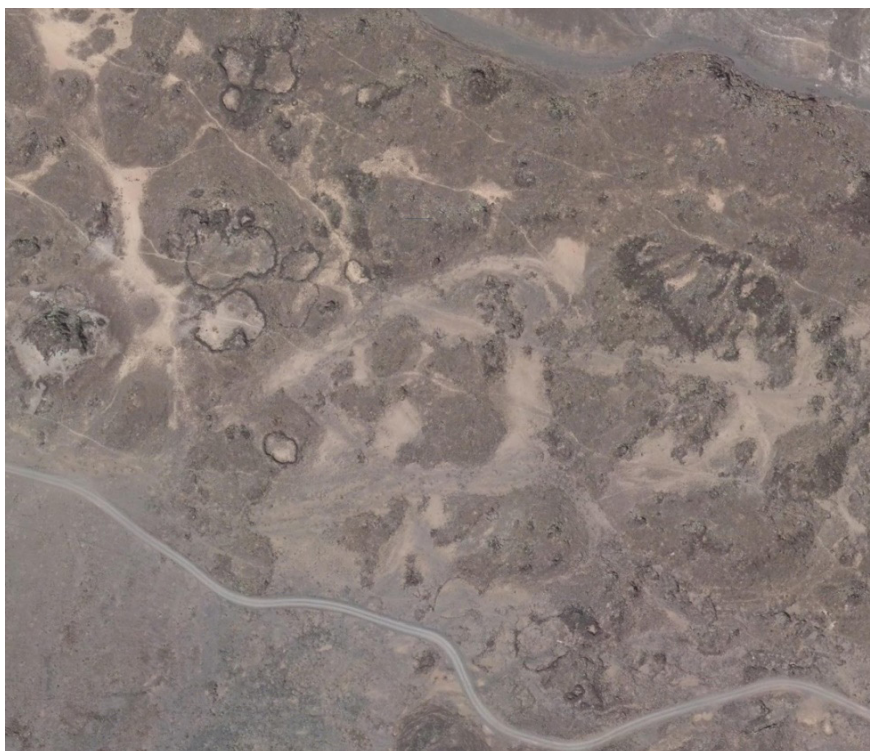
Figura 2. Vista cenital del yacimiento de Las Estancias.