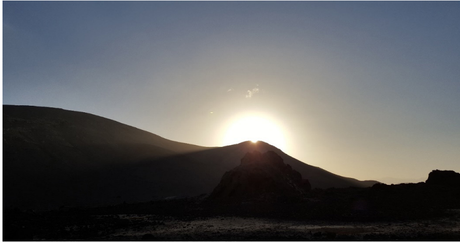
Figura 11.