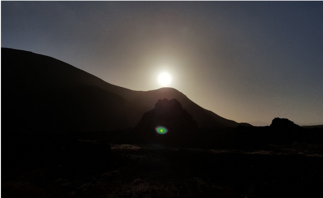
Figura 9.