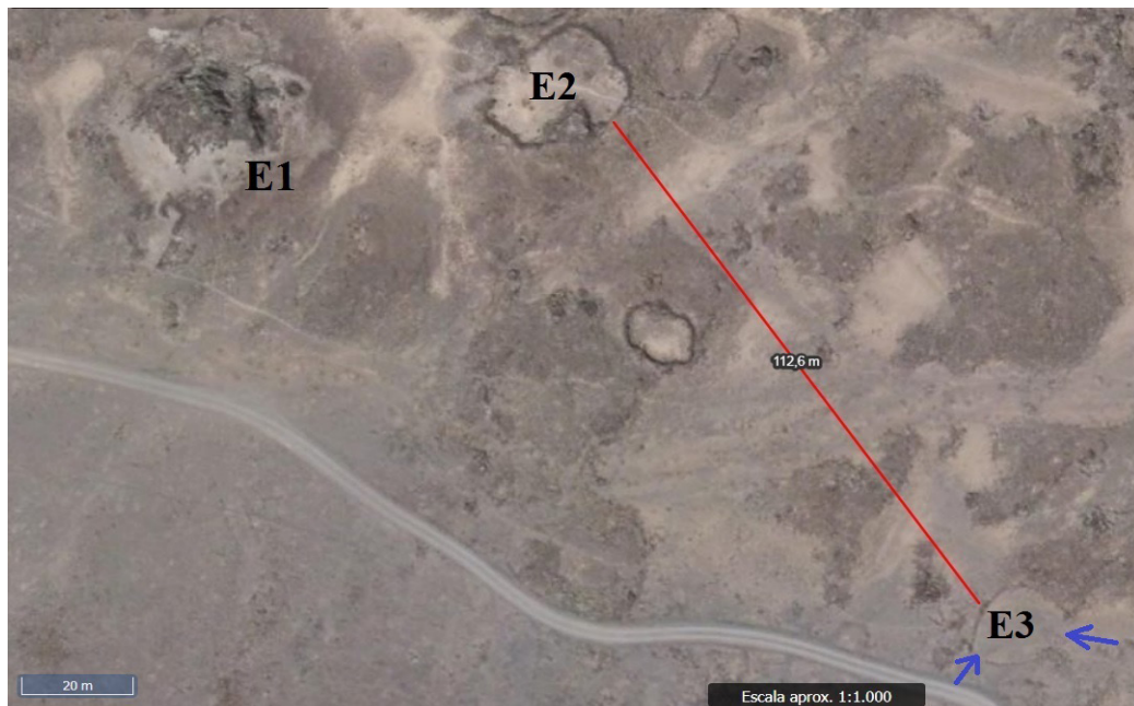
Figura 16. Situación relativa de las estructuras E2 y E3. Las flechas azules indican los accesos a la estructura E3.