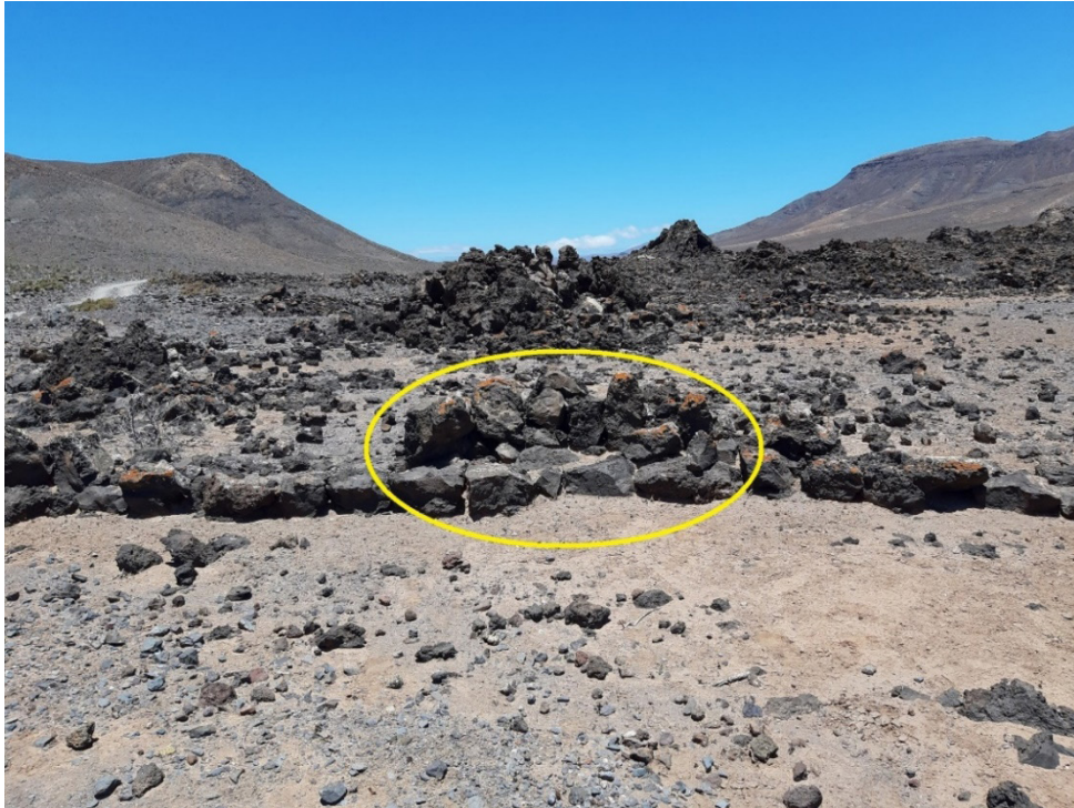
Figura 18. Obsérvese la estructura en forma de banco con respaldo, formando parte del cerramiento de la estructura E3.