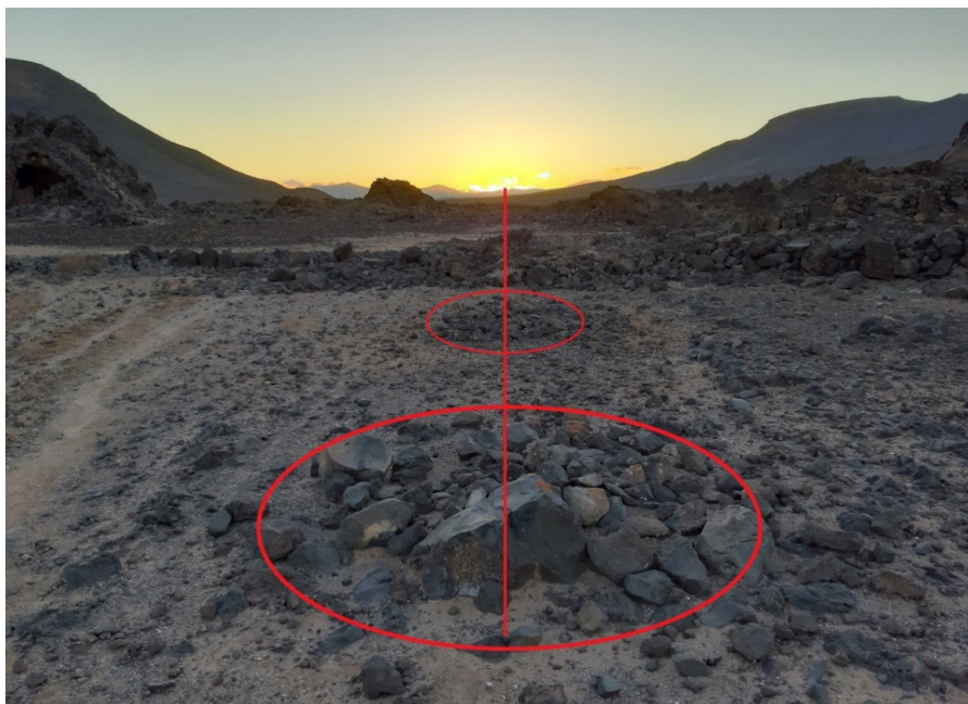
Figura 15. 6.