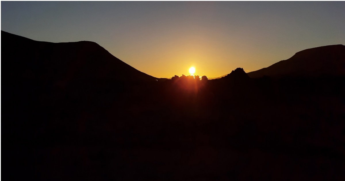
Figura 21.