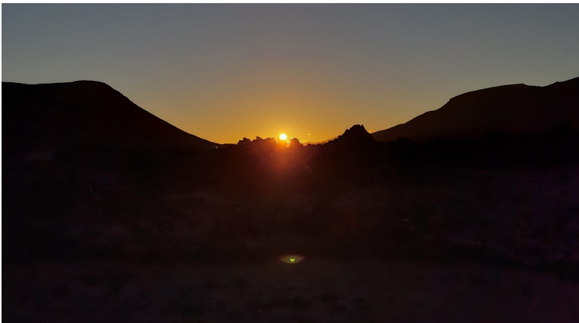
Figura 22.