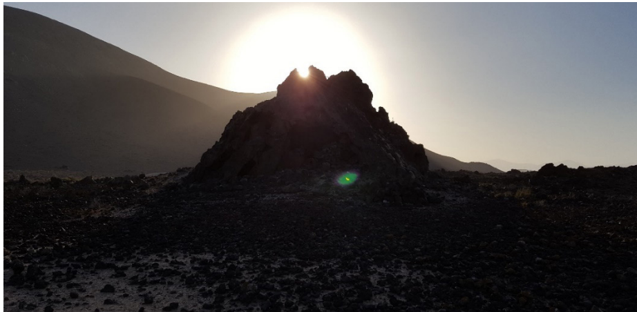
Figura 12. (20-03-2019).