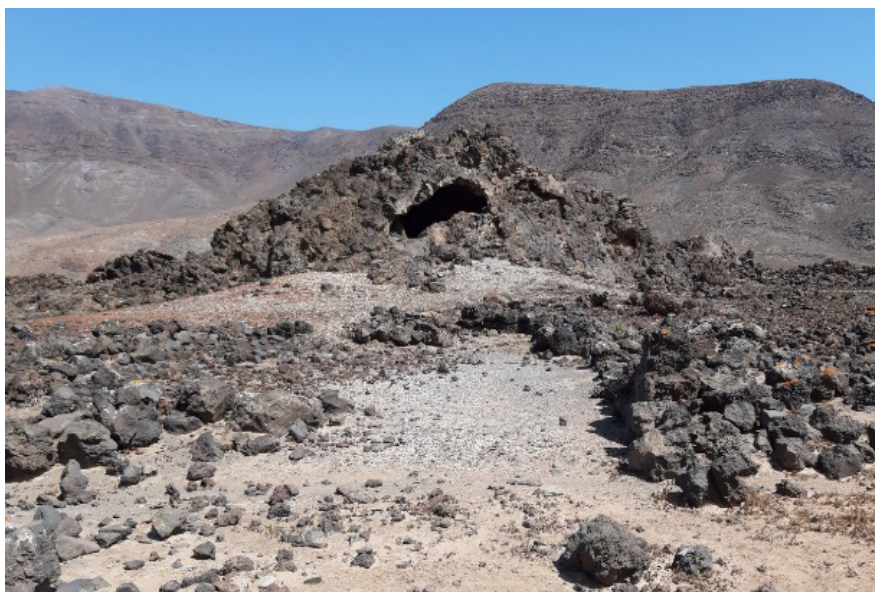
Figura 1. Foto del roque –estructura E1– que contiene la cavidad que da nombre al barranco donde se ubica –Barranco Valle de la Cueva–. Aquí se aprecia la abertura orientada al sur.