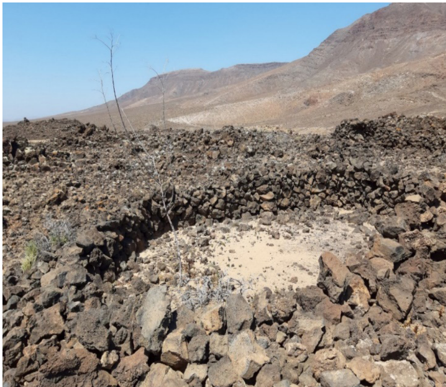
Figura 4. Estructura del yacimiento de Las Estancias que pudo ser utilizada como gambuesa.