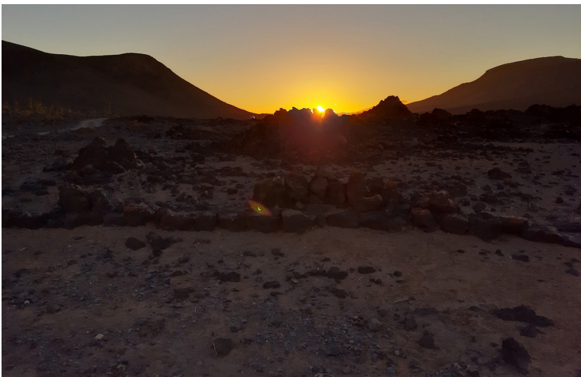
Figura 23.