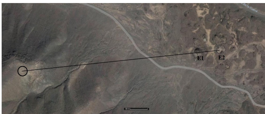
Figura 8. Alineación determinada entre las estructuras E2, E1 y la cima de la montaña sobre la que se oculta el sol en los atardeceres equinocciales, si se observa la puesta de sol desde la estructura E2.