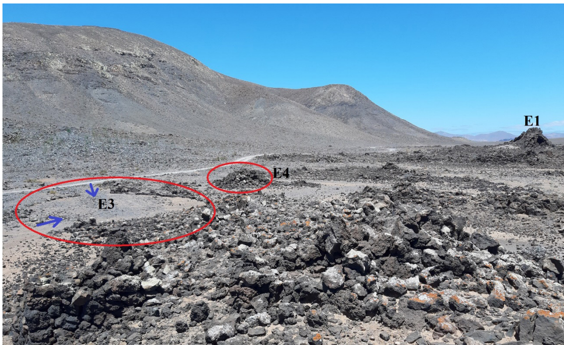
Figura 17. En esta instantánea se aprecian las estructuras E1, al fondo, a la derecha; E3 y E4, descritas en el texto. Se distinguen los accesos (flechas azules) a la estructura E3.