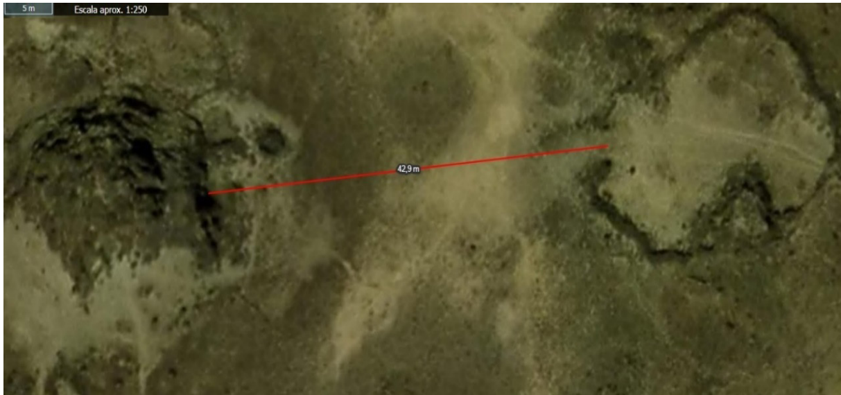
Figura 5. Distancia aproximada entre las estructuras E1 y E2.