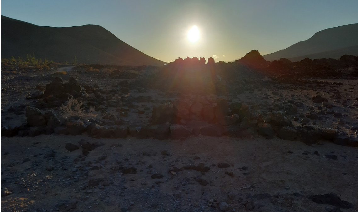
Figura 20.

Secuencia fotográfica (Figuras 20-23) en la que se observa la puesta de sol desde la posición descrita en el texto en la estructura E3. Se aprecia cómo el Sol, en los últimos instantes de su ocaso solsticial de verano, se coloca sobre la estructura E4 para desaparecer, posteriormente, tras la última y más notoria fisura vertical que se distingue a la derecha de esta estructura.