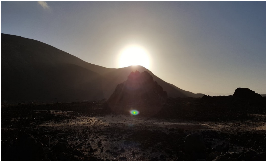
Figura 10.