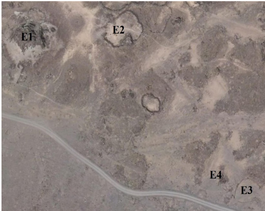
Figura 3. Estructuras del yacimiento de Las Estancias donde se verifican las manifestaciones arqueoastrómicas descritas en el texto.