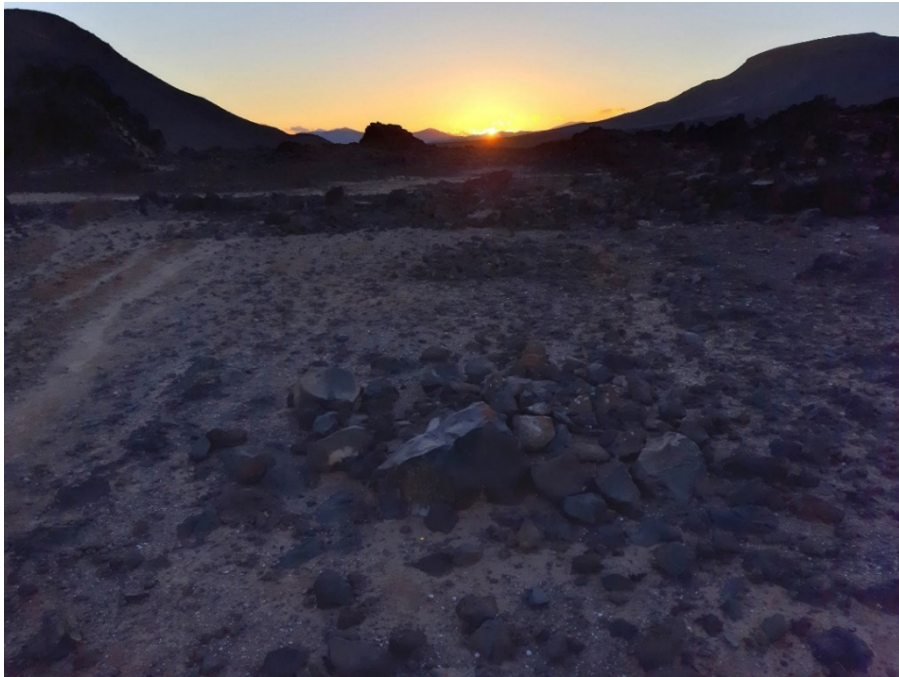
Figura 14.