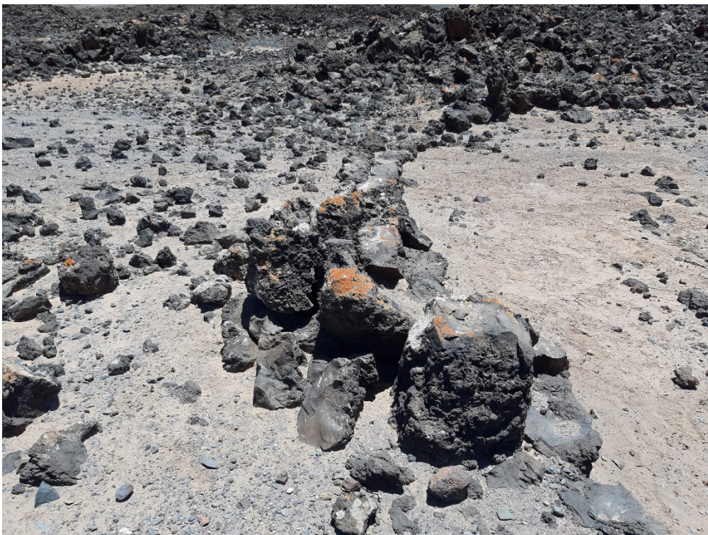
Figura 19. Perfil del supuesto banco, o receptáculo de ofrendas, que adquiere este sector de la estructura E3. Se aprecia el conjunto de piedras dispuesto en su exterior a modo de respaldo o señalización.