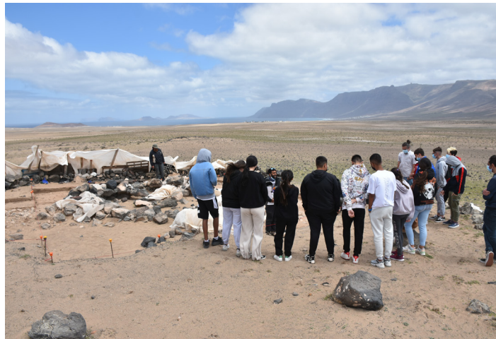
Figura 4. Charla al alumnado de secundaria sobre los resultados obtenidos en el sondeo 8/casa honda de Ramírez.

Por último, la excavación del yacimiento simulado se realizó en los grupos de educación primaria y primeros cursos de secundaria, dejando a un lado a los grupos de 4º de la ESO. El motivo no fue que esta actividad no estuviera adecuada a dicho alumnado, sino que, al dedicar más tiempo a la visita al Peña de las Cucharas, la excavación era inviable en tiempo. La práctica de excavación a su vez se adaptó según las necesidades curriculares de los diferentes grupos, siendo mas incisivos en los mayores con la metodología de intervención, especialmente en la ubicación de los objetos y el registro de esta.