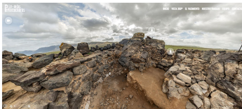
Figura 7. Captura del visor 360°.

Dentro de los recursos didácticos que el alumnado dispondrá durante el desarrollo de esta actividad estará la de recursos cartográficos, fotográficos o textos históricos que hacen más inmersiva la visita propiamente dicha. Asimismo, el itinerario y recursos propuestos no solo engloban a las materias propias de las Ciencias Sociales, sino también a otras asignaturas como Biología. No hay que obviar que el Jable de Arriba es un territorio con unas características naturales singulares, no sin más esta inserta en la zona ZEPA de Islotes del Norte de Lanzarote y Famara.