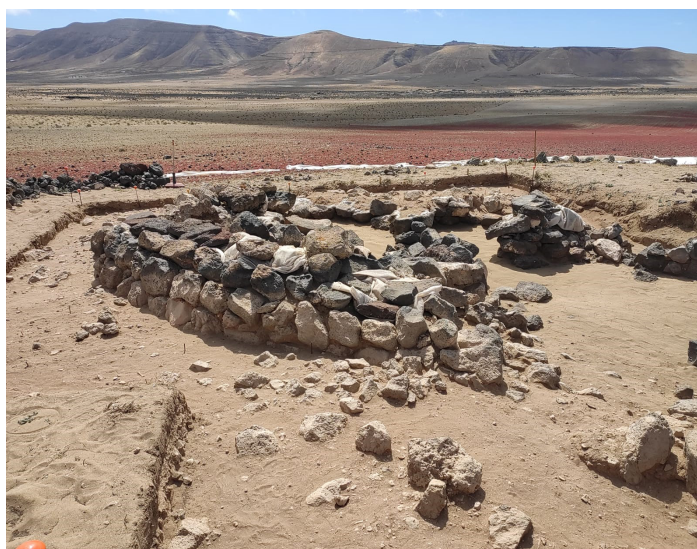
Figura 1. Unidades murarias que configuran la casa honda de Ramírez.

De manera prácticamente ininterrumpida, desde hace más de 10 años se realizan trabajos arqueológicos que, desde una perspectiva interdisciplinar, han arrojado una gran cantidad de información sobre la realidad histórica de la zona. No hablamos exclusivamente del yacimiento de la Peña de las Cucharas, sino también del ámbito ecogeográfico del Jable de Arriba, donde los trabajos etnográficos realizados han sido fundamentales a la hora de entender el devenir histórico de este territorio, desde los majos a la actualidad 7 .