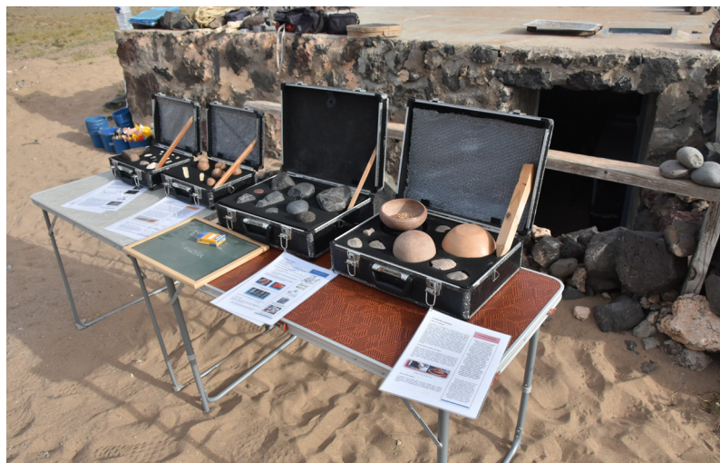
Figura 5. Maletines didácticos expuestos en el yacimiento. Fuente: Prored. Soc. Coop.