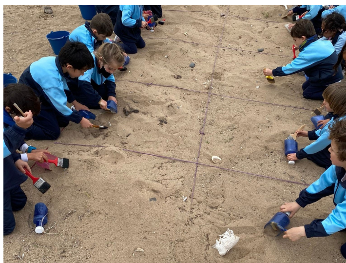
Figura 3. Excavación del yacimiento simulado. Fuente: Prored Soc. Coop.

Práctica de prospección arqueológica: El entorno de la Peña de las Cucharas presenta en superficie una gran cantidad de materiales arqueológicos que denotan la intensa ocupación de este territorio. Una de las actividades realizadas fue una práctica de prospección superficial donde se explicaron los principales fundamentos de esta. El alumnado, ataviado de banderillas, buscó en el campo objetos arqueológicos, y colocando una barandilla junto a la misma, siempre teniendo en cuenta que no deben moverse los restos localizados.