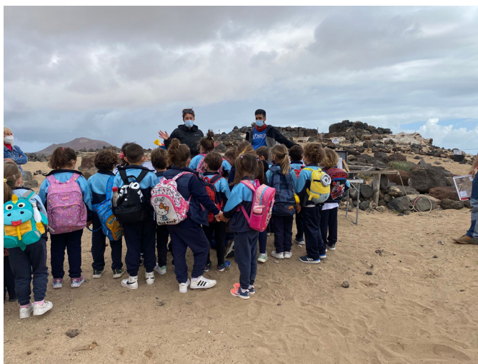
Figura 2. Visita escolar, charla introductoria.

El día escogido para las visitas fue el viernes de cada semana, salvo algunos ajustes del calendario por razones de diversa índole y los centros que participaron fueron: CEIP Costa Teguisse (57), CEIP Muñique (20), CEIP La Caleta de Famara (21), CEO Playa Blanca (52), Colegio Hispano Británico (58), CEIP Virgen de los Volcanes (58), IES Salinas (80), IES San Bartolomé (116), IES Teguisse (74) e IES Tinajo (40). Un total de 576 escolares, que comprendían desde la educación primaria a la secundaria, lo que obligo a adaptar la visitas y las actividades a rango de edad de cada grupo.