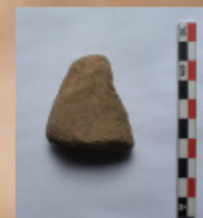
Fragmento de toba desgastados en todos sus laterales (Sondeo 9)