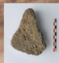
Fragmento de basalto vacuolar con desgastes en sus laterales (SE Peña de Las Cucharas UE1Lev5)