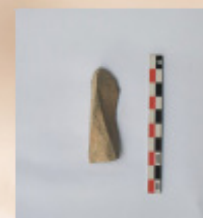
Lasca fracturada con posibles marca de uso en su lateral izquierdo (Sondeo 8 UE3Lev2)