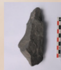
Instrumento sobre lasca (SE Peña Las Cucharas, UE 1Lev4)

De forma absolutamente preliminar, se puede plantear que en el SE de la Peña de Las Cucharas y la Peña de Luis Ramírez (Sondeo 9) se están llevando a cabo actividades más específicas, por lo general asociadas a ámbitos domésticos, mientras que en el Sondeo 8 parece indicar que es un espacio de desecho.