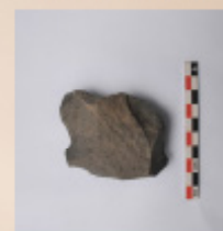
Raedera (SE Peña Las Cucharas, UE 1Lev4)