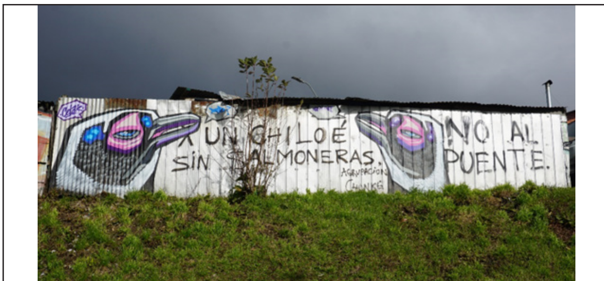
Figura 2. Marta Bordons Martínez, «Por un Chiloé sin salmoneras. No al Puente», mural del Colectivo Chonke Mapu, Chiloé, 22 de mayo.

La Ley Lafkenche, la quizás mayor herramienta jurídica de protección del maritorio para los pueblos mapuche -pese a su lentitud a la hora de ser aplicada y otras complicaciones-, fue resultado de las movilizaciones del movimiento mapuche a través de un compendio de estos distintos instrumentos de acción. Las movilizaciones se desplegaron a raíz de la Ley General