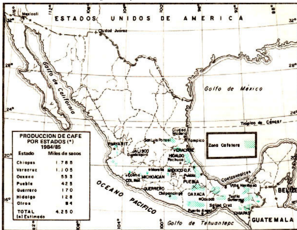
Figura 1. Mapa cafetero de México (1985)