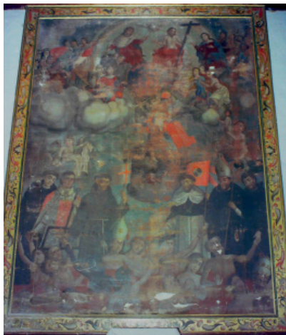
Figura 2. Cuadro de las Ánimas del Purgatorio. Parroquia Ntra. Sra. de los Remedios. Buenavista del Norte. Desaparecido en 1996.