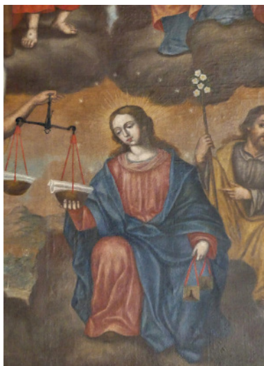
Figura 4. Cuadro de las Ánimas del Purgatorio (detalle). Parroquia de Ntra. Sra. de La Luz. Los Silos.

donde está el arcángel S. Miguel». De igual manera se trabaja en la mejora de los textiles que visten el retablo con la compra de nuevos enceres para su ornato, «cuarenta y tres reales vara y media de tafetán blanco a cinco reales de vara» además se componían de «ocho reales y medio por el forro del frontal». También se compraron otros tejidos de fuera de la isla como fue el «lienzo portugués para acrecentar el mantel y el frontal». Iniciativas que vienen a solucionar el mandato del 13 de diciembre de 1767 del obispo Francisco Delgado Venegas en la visita pastoral al lugar, donde se anota «...mando procúrese tenga siempre aseado y decente el altar de las Ánimas lo que celará el V. Cura haciéndole compras cualquier cosa que sea necesaria, para que esté con la debida decencia».