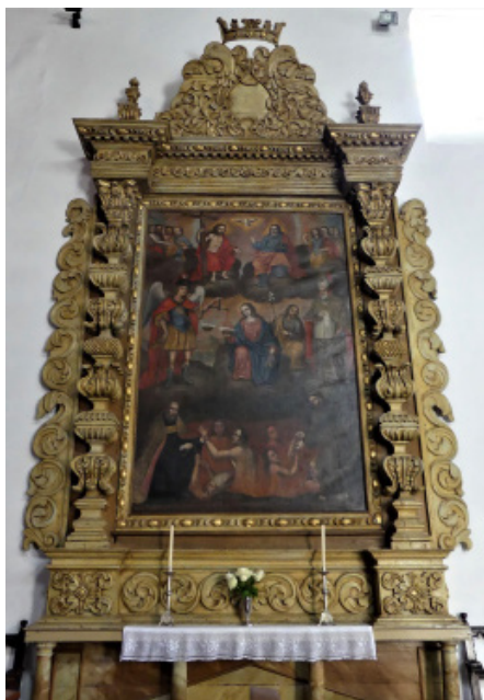
Figura 3. Cuadro de las Ánimas del purgatorio. Parroquia de Nuestra Señora de los Silos.

Robayna en el lienzo se debe de encuadrar en el momento en el que interviene en la decoración mural de la capilla mayor del mismo templo 14 .