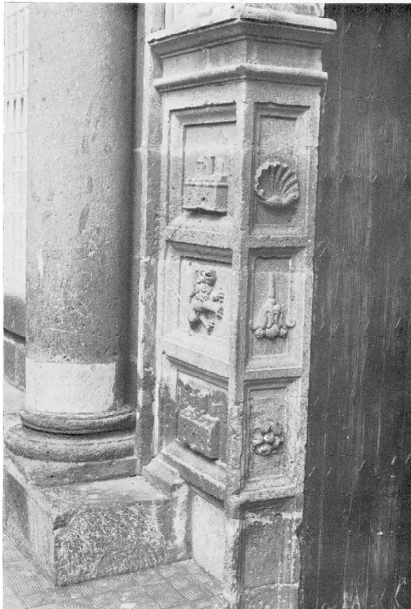
Casa Regental. Detalle. Decoración heráldica en las jambas: Castillos y leones, así como motivos florales y venera