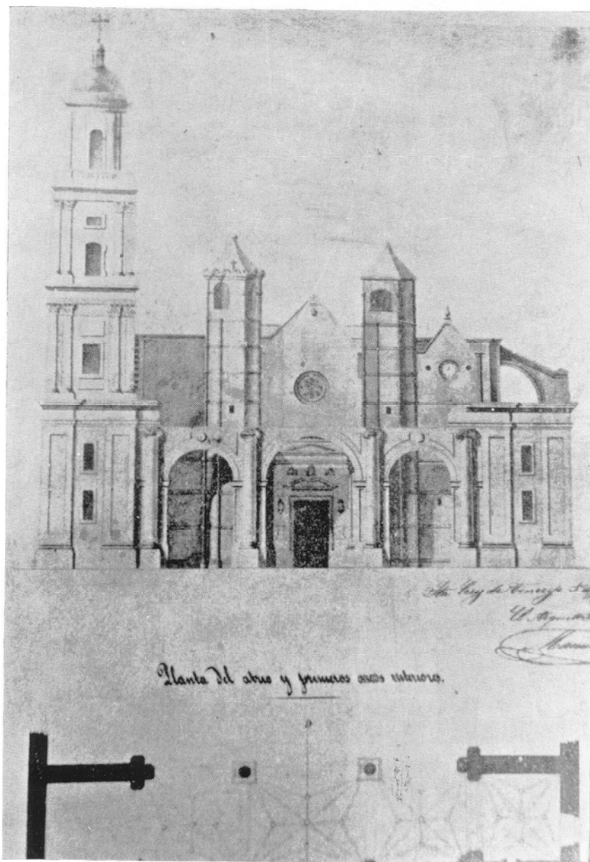
Catedral de Canarias. Fachada. Dibujo del siglo XIX ( Planos y dibujos de la Catedral de Las Palmas , E. Marcos Dorta, Fig. 37). Se aprecia la antigua «Puerta Mayor», obra de Próspero Cassola (Fines del siglo XVI)