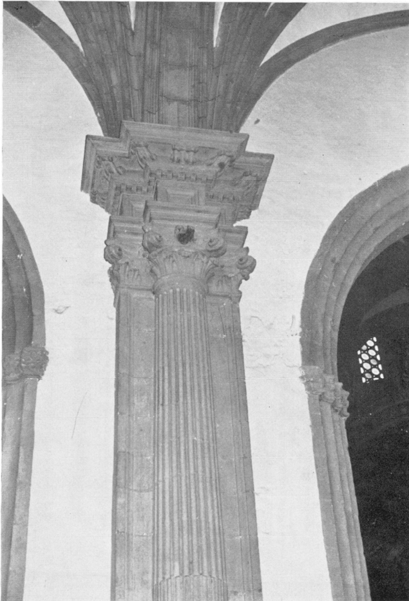
Catedral de Canarias. Capilla de Ntra. Sra. de la Antigua, hoy de Santa Teresa. Obra de Pedro de Narea, finalizada hacia 1573. Columna, pilastra y entablamento del lado de la nave de la Epístola