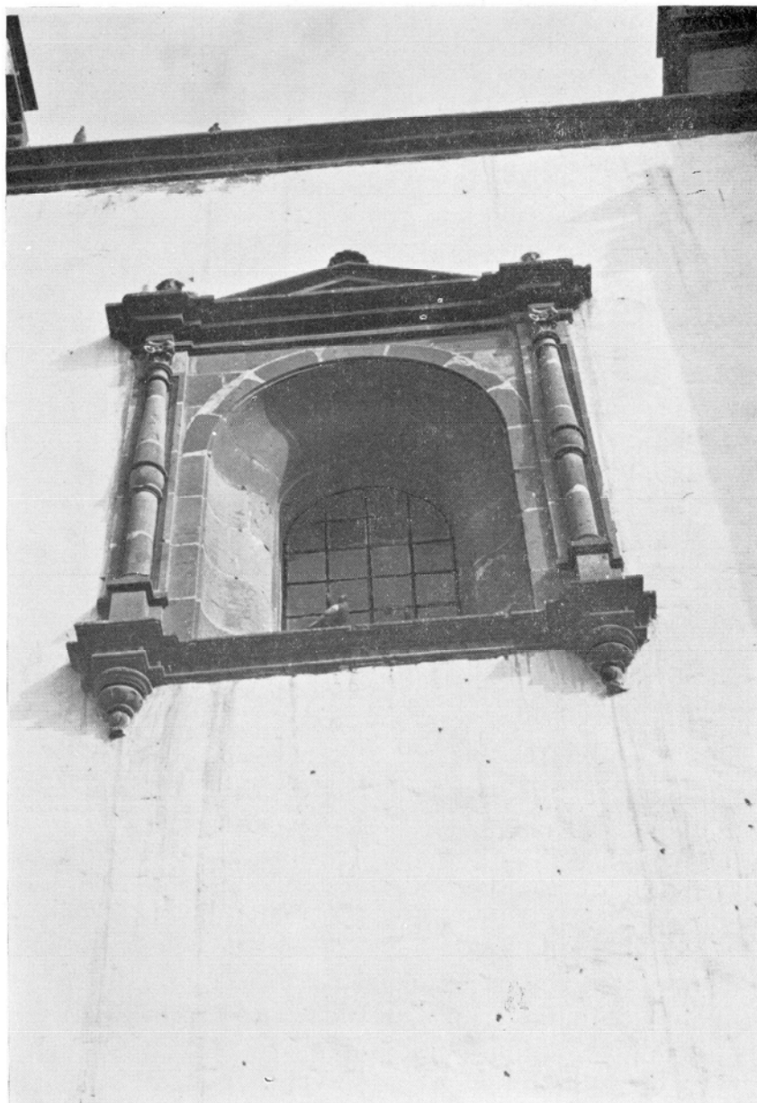
Catedral de Canarias. Ventana de la Capilla de Ntra. Sra. de la Antigua (hoy de Santa Teresa) hacia el Patio de los Naranjos. Obra de Pedro de Narea