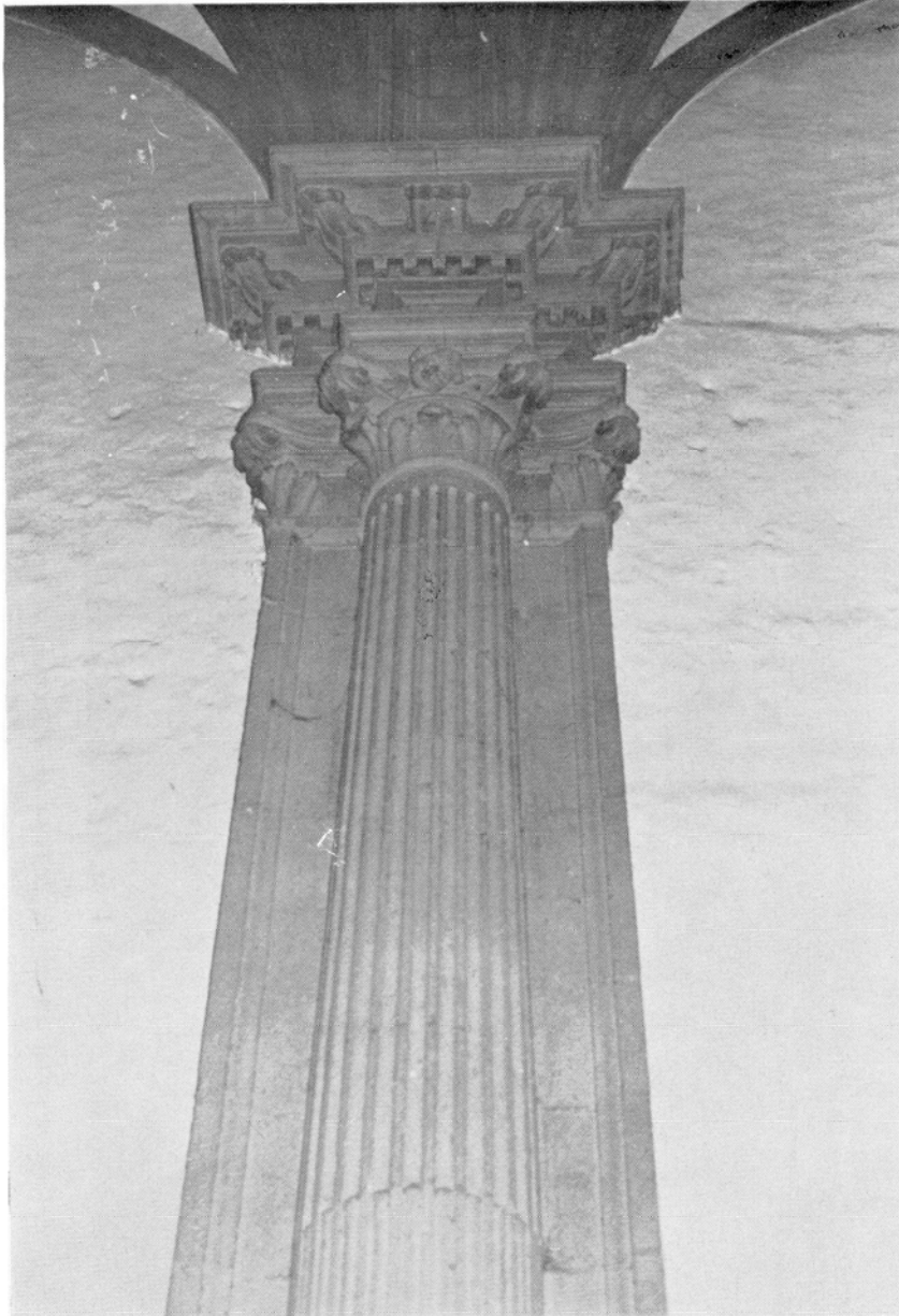
Catedral de Canarias. Capilla de Ntra. Sra. de la Antigua, hoy de Santa Teresa. Obra de Pedro de Narea, finalizada hacia 1573. Columna, pilastra y sección de entablamiento del lado del Patio de los Naranjos