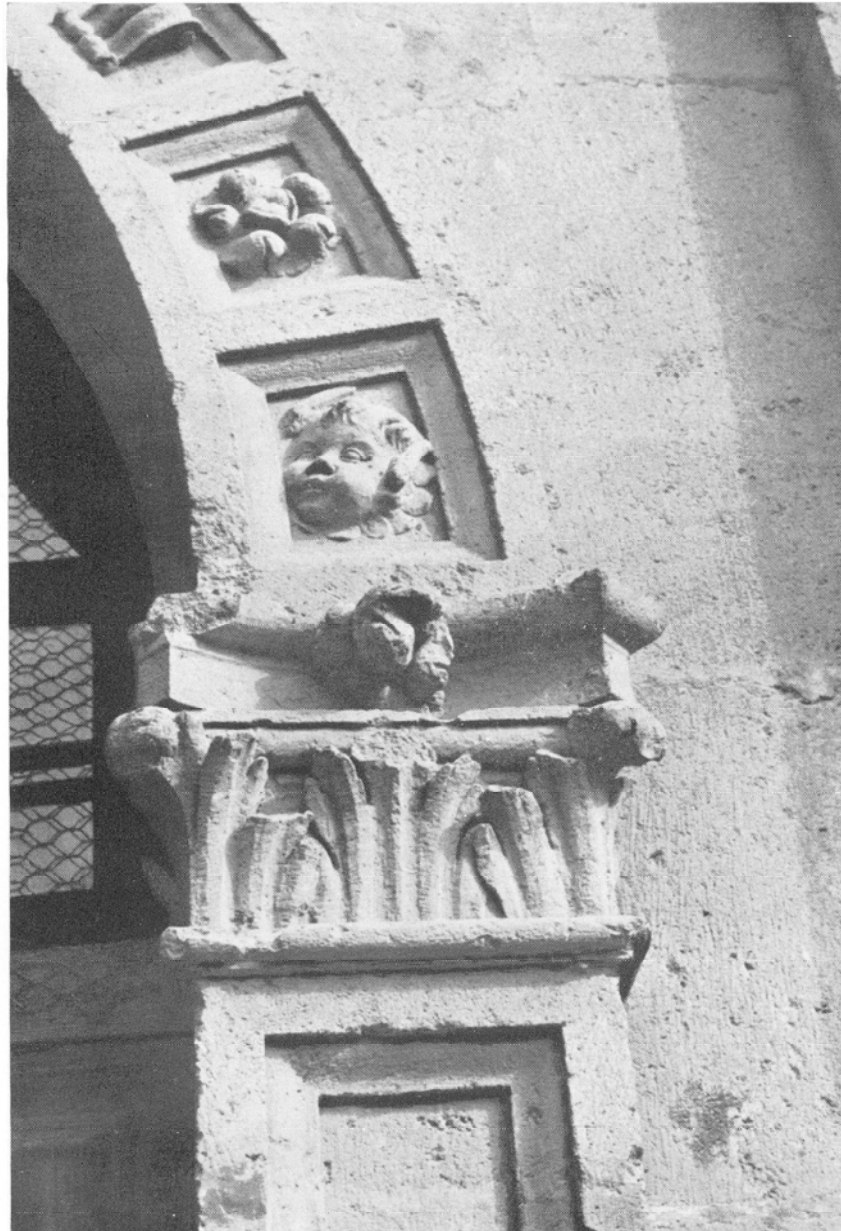
Catedral de Canarias. Puerta del Aire, obra de Juan Lucero. Detalle