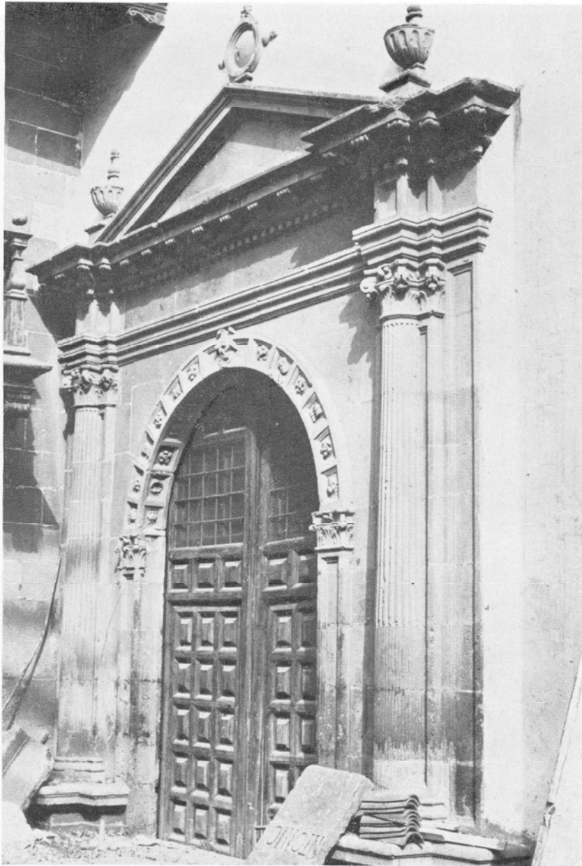
Catedral de Canarias. Puerta del Aire. Obra del Maestro Juan Lucero. Comunica la Capilla de San Francisco de Paula con el Patio de los Naranjos