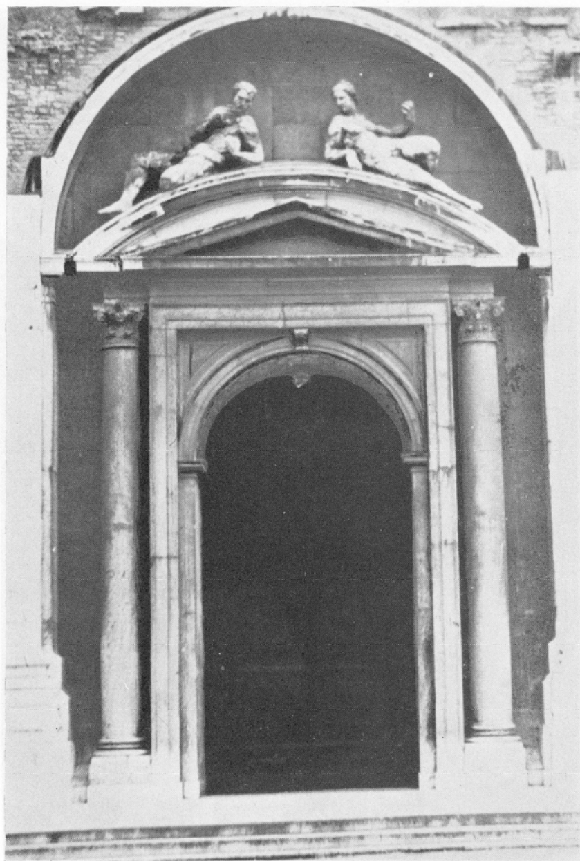
Portada del Duomo de Reggio Nell'Emilia (Italia), ciudad natal de Próspero Cassola, cuyo recuerdo pudo inspirar la «Puerta Mayor» de la Catedral canaria