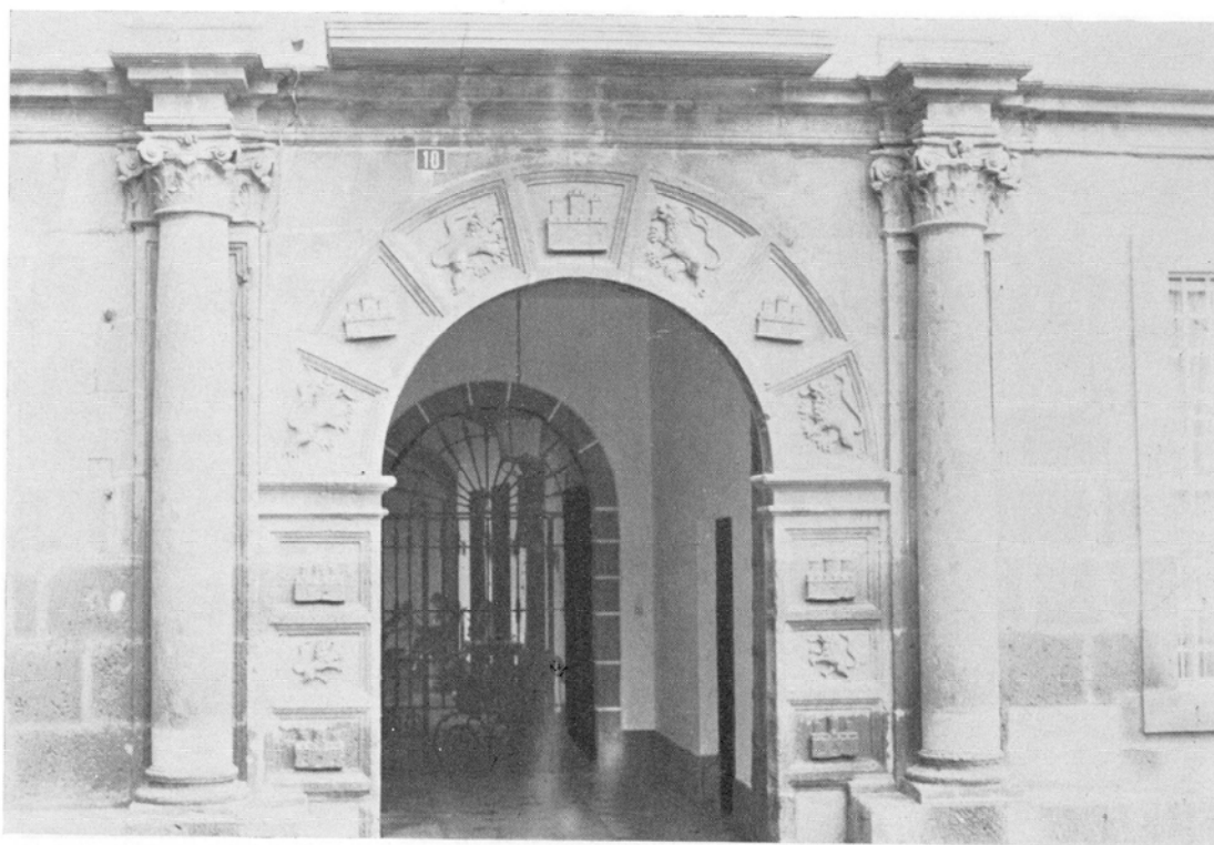
Casa Regental. Situada en la Plaza de Santa Ana. Anónima, terminada hacia 1640