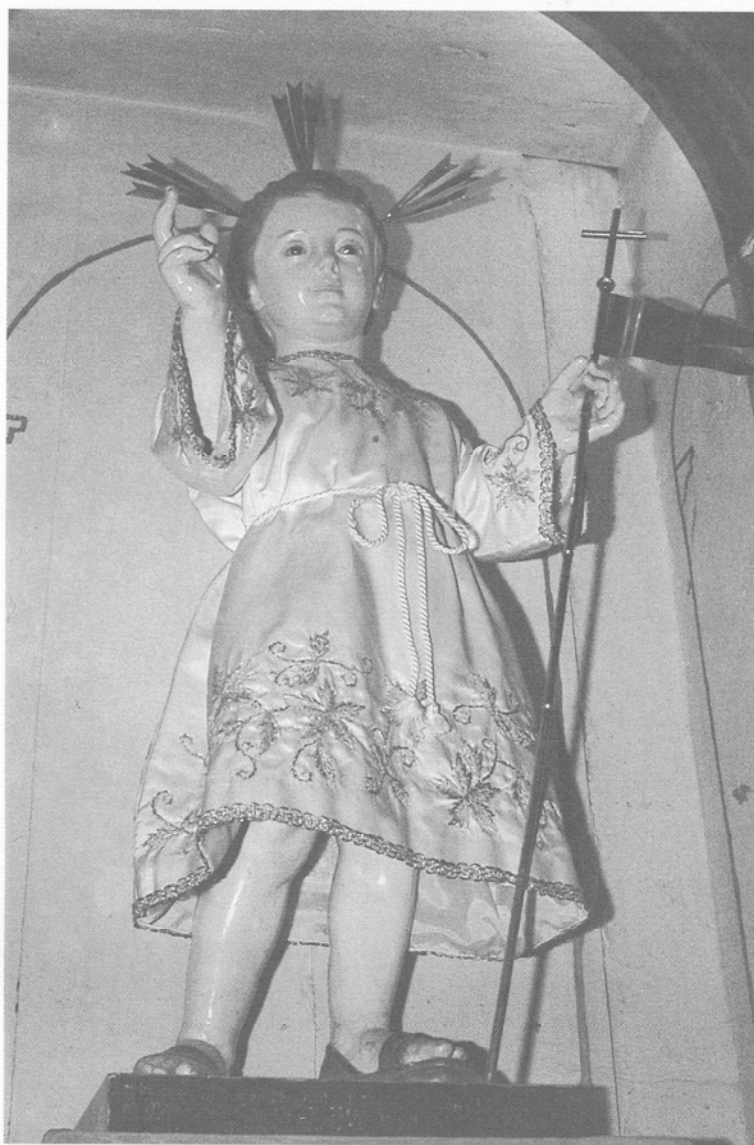
Niño del Dulce Nombre de Jesús. Parroquia del Dulce Nombre de Jesús. La Guancha (Tenerife)