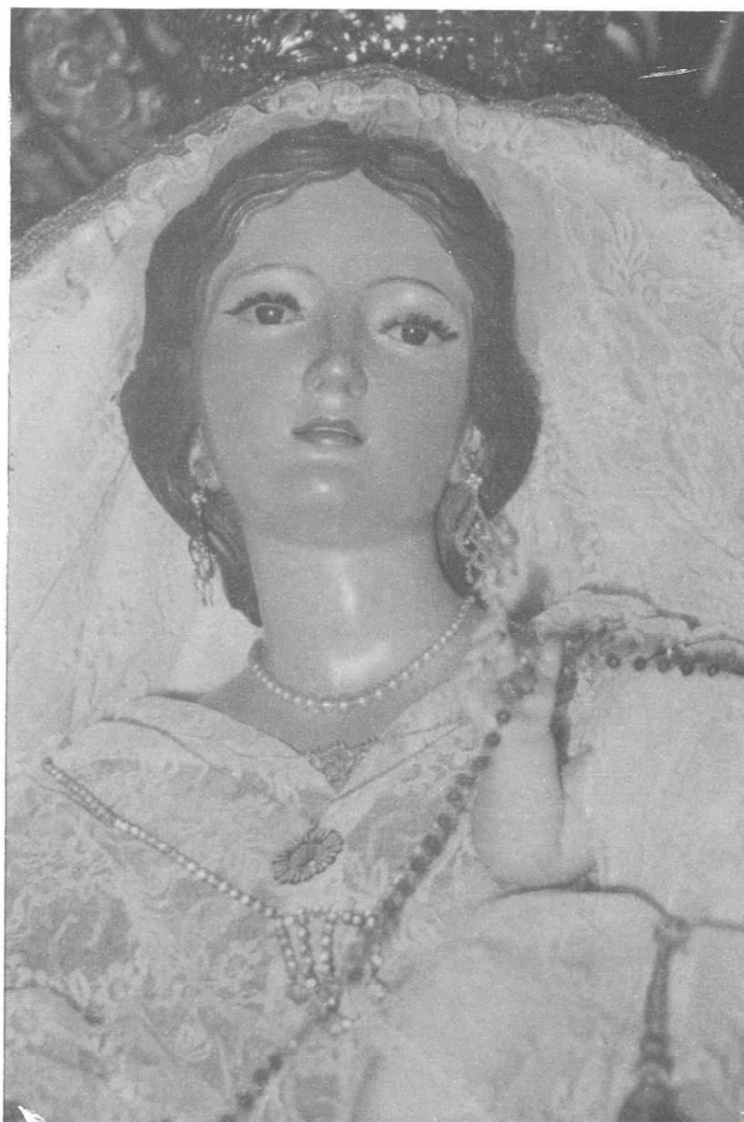
Imagen de Nuestra Señora de los Remedios. Parroquia de Santiago Apóstol. Los Realejos.