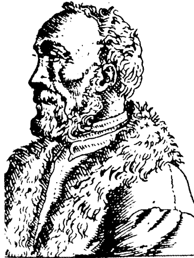
Alvise Da Mosto en su edad madura, tal como aparece en un código de la Biblioteca Ambrosiana de Milano.

A sus dotes mercantiles Da Mosto une también las del buen diplomático que sabe llegar a pactos con poblaciones que no habían visto jamás a un hombre blanco. Fue también (y es éste el elemento que más nos interesa aquí) un agudo observador, y su pluma describió con absoluta honestidad las cosas que vio, sin abandonarse nunca a juicios morales mediatizados por el cristianismo o el eurocentrismo, sin exagerar nunca ni añadir nada de su propia fantasía, sino limitándose a transcribir con escrupulosa exactitud y con total imparcialidad, con una verdadera mentalidad etnológica, esto es, realizando reportajes casi «fotográficos» de las realidades de las que fue testigo conforme a una práctica que solamente se afirmaría en la etnología en la segunda mitad del siglo pasado.