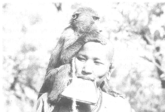
Un extraño «canon» de belleza: la dilatación del labio inferior.

En fin, para concluir esta breve panorámica sobre la obra etnográfica de Da Mosto, encontramos también en su diario una de las primeras fuentes que describen la costumbre de «embellecer» el