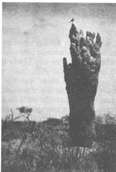
Un típico termitero del Africa Ecuatorial, como los descritos en el diario de Da Mosto.

Este árbol tomó el nombre científico de Adansonia digitata , del nombre del botánico francés Michel Adanson (1727-1806), que lo clasificó en 1761, cuando en realidad el fragmento de Da Mosto existía ya desde hacía más de dos siglos. En este extraordinario diario de abordo encontramos también, y con idéntica precocidad, el primer informe llegado al mundo europeo de una plaga de langostas, hecho este que hasta entonces sólo era conocido a través del famoso episodio bíblico de las Plagas de Egipto pero del que ningún navegante había dado nunca antes testimonio directo: tanto de esta descripción como de las otras que citamos en el presente trabajo facilitamos en el texto el fragmento completo 4 . En el panorama de las curiosidades conocidas en la Europa de la época, hay que destacar también una de las primeras descripciones de los grandes termiteros del Africa Ecuatorial, de los que Da Mosto dice que «... parecen hornos para cocer el pan a nuestro modo...» 5 .