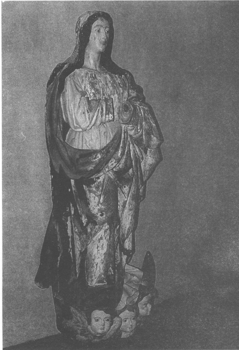
Talla de la inmaculada Concepción, correspondiente al retablo desaparecido de Garachico.