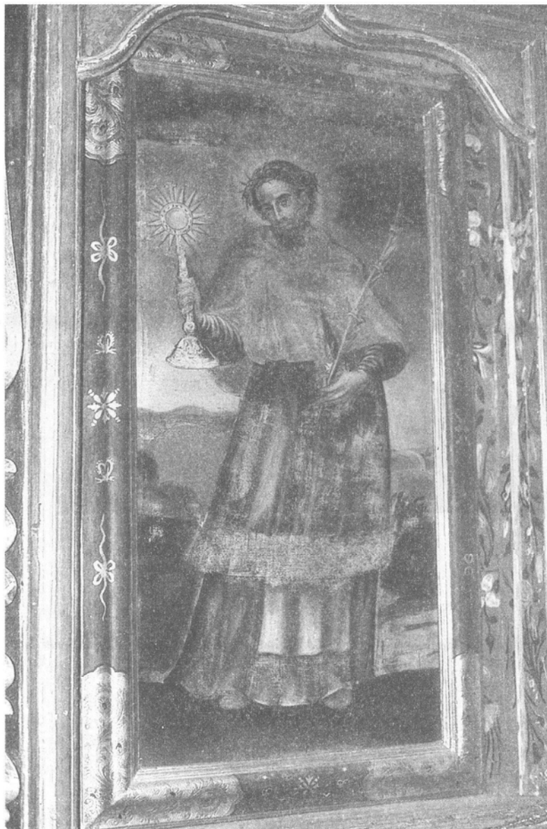
San Ramón Nonato. Iglesia de Ntra. Sra. de la Asunción. San Sebastián de la Gomera.