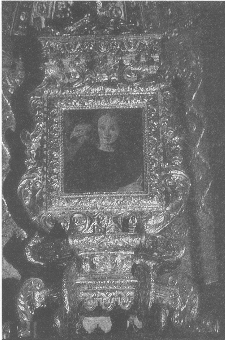
Cuadro de San Juan Evangelista. Iglesia de Ntra. Señora de la Concepción. La Laguna. Tenerife.