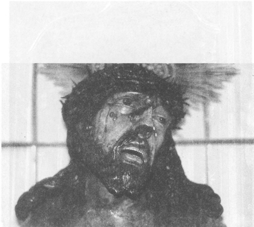
Señor de las Tribulaciones. Iglesia de San Francisco de Asís. Santa Cruz de Tenerife.