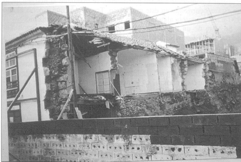
LÁM. 2.—Solar dejado por la desaparecida casa de Don Juan Bueno situada en la calle de Santo Domingo junto a la casa Quintero, Güímar.

por ejemplo el derribo de la casa denominada de Don Juan Bueno , en la Plaza de Santo Domingo, que provocó a su vez el desplome de uno de los muros de medianeras de una casa colindante, de alto valor histórico conocida por casa Quintero (ver lámina 2), debido a que durante meses se dejaron los cimientos de esta casa al descubierto.