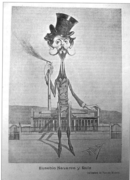
Néstor MARTÍN FERNÁNDEZ DE LA TORRE: «Caricatura de Eusebio Navarro» en La Atlántida , 28 de febrero de 1901.

la izquierda un cigarro. La mujer mira al horizonte por donde pasa un barco de vela. Es curioso el recurso de las apoyaturas de la hamaca que descansan en la base de las letras del título.