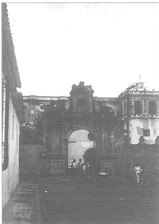
LÁM. 1.—Atrio del convento de San Francisco de Antigua.

En 1773 la ciudad de Santiago sufre graves terremotos y se decide cambiarla al Valle de la Asunción.