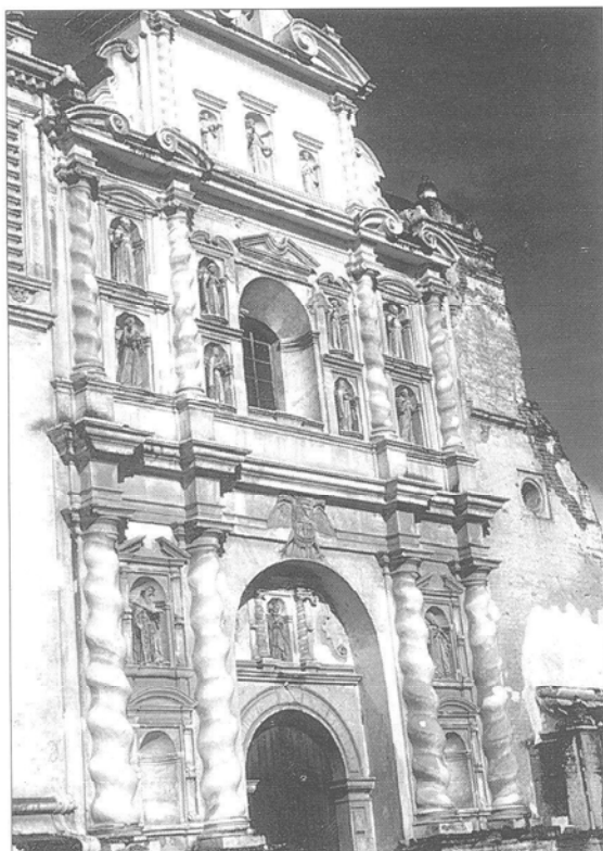
LÁM. 2.—Fachada del convento de San Francisco de Antigua.

bres con toda la solemnidad y asistiendo las principales personalidades de la ciudad 37 .