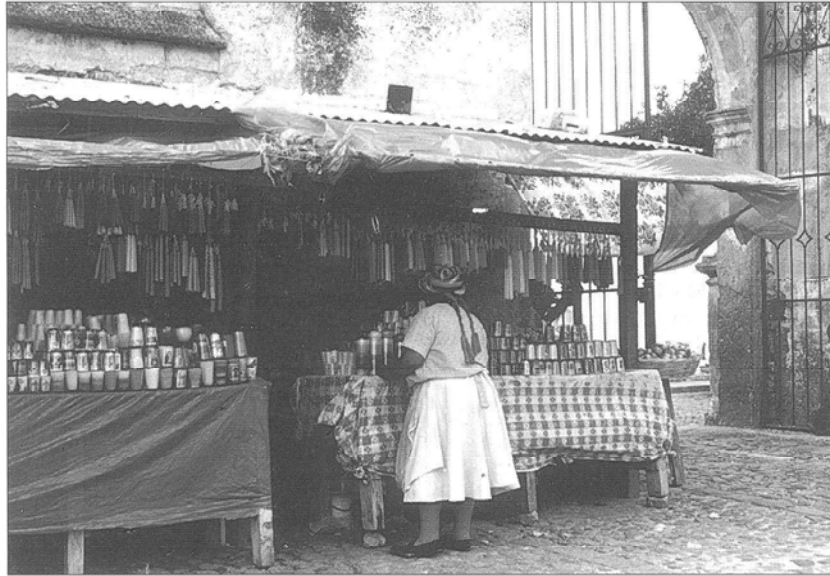
LÁM. 4.—Santona en el atrio de San Francisco.

Posteriormente declara que no posee nada, pues todo pertenece a la dicha Casa, y nombra a fray Rodrigo de la Cruz su sucesor «hermano mayor», y en caso que se concediese la licencia real «sea necesario hacerse escritura de fundación, poner constituciones, declaraciones, circunstancias, calidades y otras cosas convenientes ...nombre al dicho hermano Rodrigo de la Cruz. Y a mis albaceas para que asistan a lo susodicho y a las capitulaciones que puedan ser necesario hacer y expresar...» 42 .