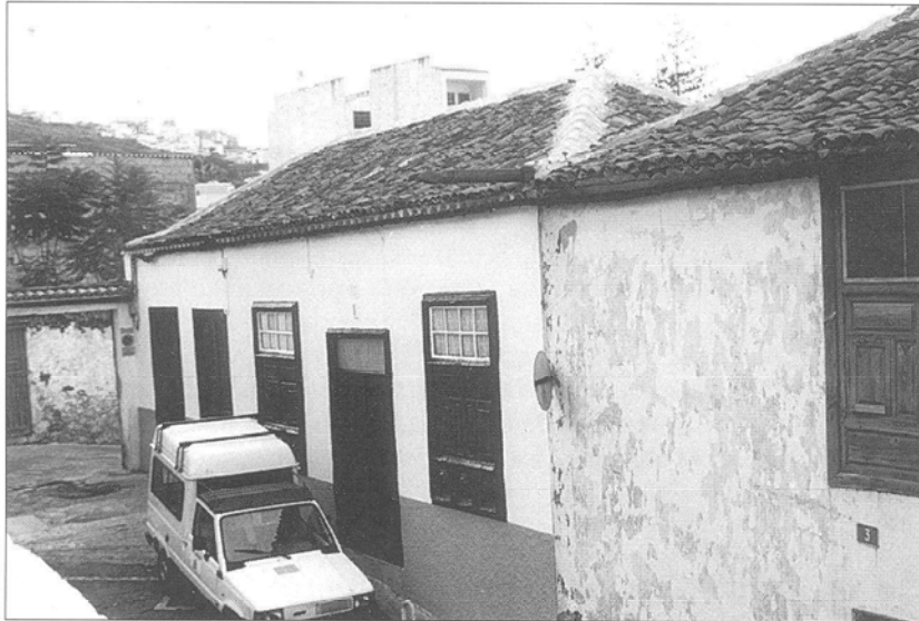
Arquitectura Doméstica. Icod-Tenerife.

Janeiro, las que muestren un esquema constructivo similar al canario, empleando maderas nobles —en este caso la jacaranda— además de los materiales ya señalados junto a otros característicos de la región.