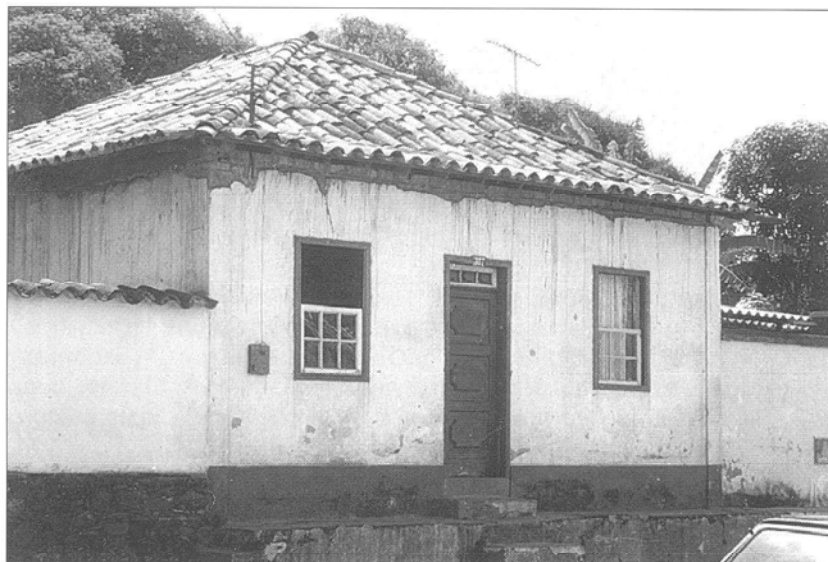
Arquitectura Doméstica. Sabará-Minas.

como Colombia, Venezuela o Cuba; las razones fueron bien resumidas por la Dra. Fraga González con las siguientes palabras: