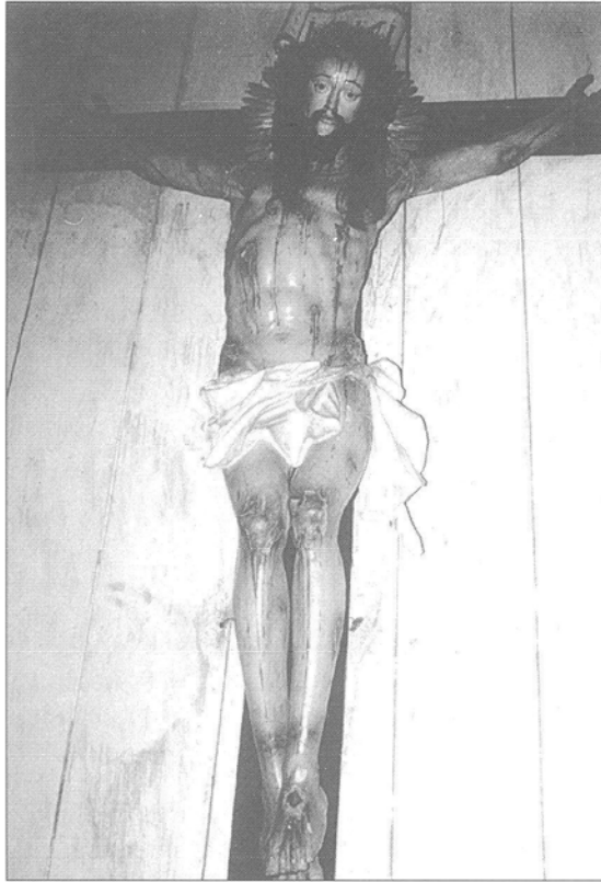
Crucifijo. Anónimo Mineiro del siglo XVIII. Museu Aleijadinho. Ouro Preto-Minas Gerais.

en el modelo iconográfico, contemplándose en crucificados canarios como los conservados en las iglesias de Nuestra Señora de Regla en Pájara (Fuerteventura) o Nuestra Señora de la Asunción en San Sebastián de La Gomera, ambos del siglo XVIII, los cuales tienen mucho que ver con la contención del dolor observado en las obras mineiras de la misma centuria, cuales son los cristos guardados en el Museo Aleijadinho de Ouro Preto, donde lo más importante no es que los fieles comprueben las torturas padecidas, sino el mensaje de salvación inherente al tema representado. Tal importancia tiene esta circunstancia devocional en Brasil que podríamos afirmar que el arte de aquel país prácticamente no conoció la estética de los crucificados del pleno Barroco en la Península Ibérica.