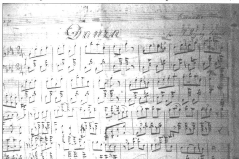
«Danza n.º 1» de Juan Reyes Armas. Area de Musicología de El Museo Canario.