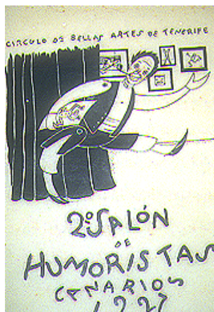
Figura 2. II Salón de humoristas canarios. 28 febrero - 14 marzo 1928