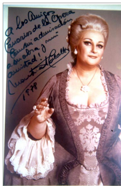
Fig. 5 Fotografía dedicada por Montserrat Caballé a los Amigos Canarios de la Ópera en 1978.

Esta década se caracteriza por la numerosa participación de cantantes nacionales de primera línea. Son los años en que actuaron José Carreras , Plácido Domingo , Montserrat Caballé y Jaime Aragall , quienes intervinieron en diversas ocasiones, a veces arropados por el calor y reconocimiento del público, y otras criticados por los aficionados más exigentes. 14 Es lógico suponer que las deficiencias de la puesta en escena trataran de compensarse con la expectación y entusiasmo que debían provocar las primeras figuras de la lírica nacional.