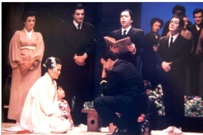
Fig. 7 Representación de Madame Butterfly en 1995.

y Damaret , respectivamente, desempeñando un importante papel en los demás elementos de escena el equipo técnico del Teatro Pérez Galdós .