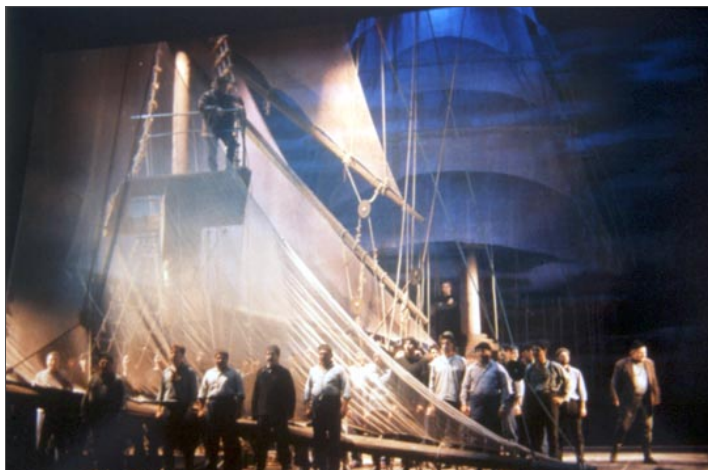
Fig. 6 Representación de El holandés errante en 1994. Escenografías del Teatro Colón de Buenos Aires.

Por último, elementos tan indispensables como el vestuario , el atrezzo y la peluquería , han correspondido en su mayoría a empresas de Madrid y Barcelona, como Cornejo, Mateos