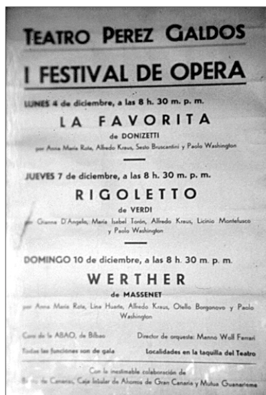
Fig. 1 Cartel del I Festival de Ópera de Las Palmas de Gran Canaria, 4-10 de diciembre de 1967.

El Festival de Ópera de Las Palmas de Gran Canaria ha sido organizado y promovido por la asociación Amigos Canarios de la Ópera (A.C.O.) , con un carácter anual y continuo desde el año 1967 hasta la actualidad. Cuenta ya, por tanto, con más de tres décadas de existencia a lo largo de las cuales han tenido lugar, en el ámbito del Teatro Pérez Galdós , centenares de representaciones en las que se ha podido ver y escuchar casi de todo.