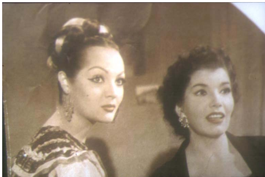
Fig. 7. Dalia Íñiguez junto a la actriz Sara Montiel.