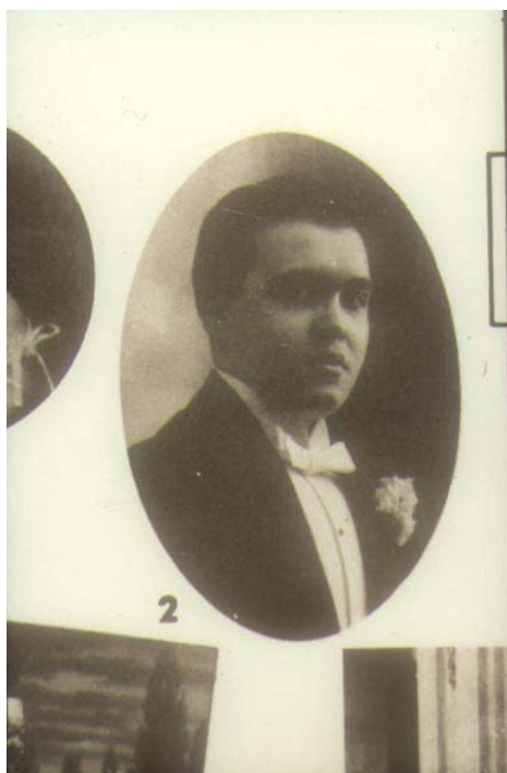
Fig. 1. Juan Pulido en la época de su debut en 1912. (Diapositiva de Fernando A. Pérez).