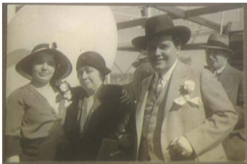
Fig. 8. El matrimonio Pulido-Íñiguez junto a la poetisa Gabriela Mistral. (Diapositiva de Fernando A. Pérez).