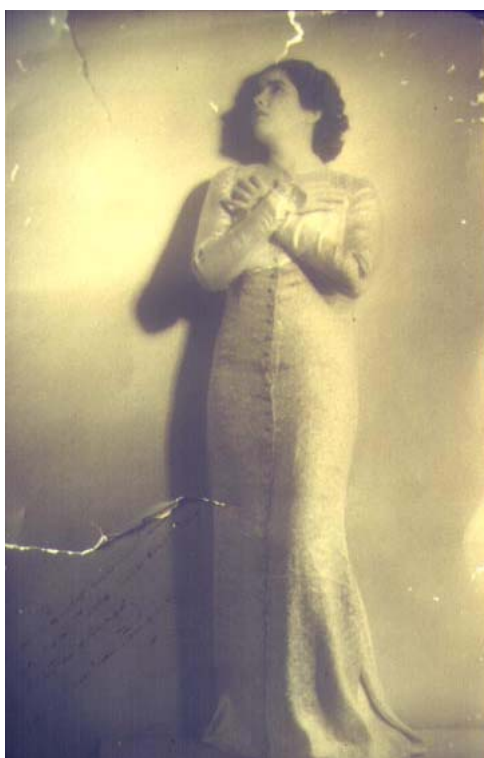
Fig. 6. La recitadora cubana Dalia Íñiguez en su juventud. (Diapositiva de Fernando A. Pérez).