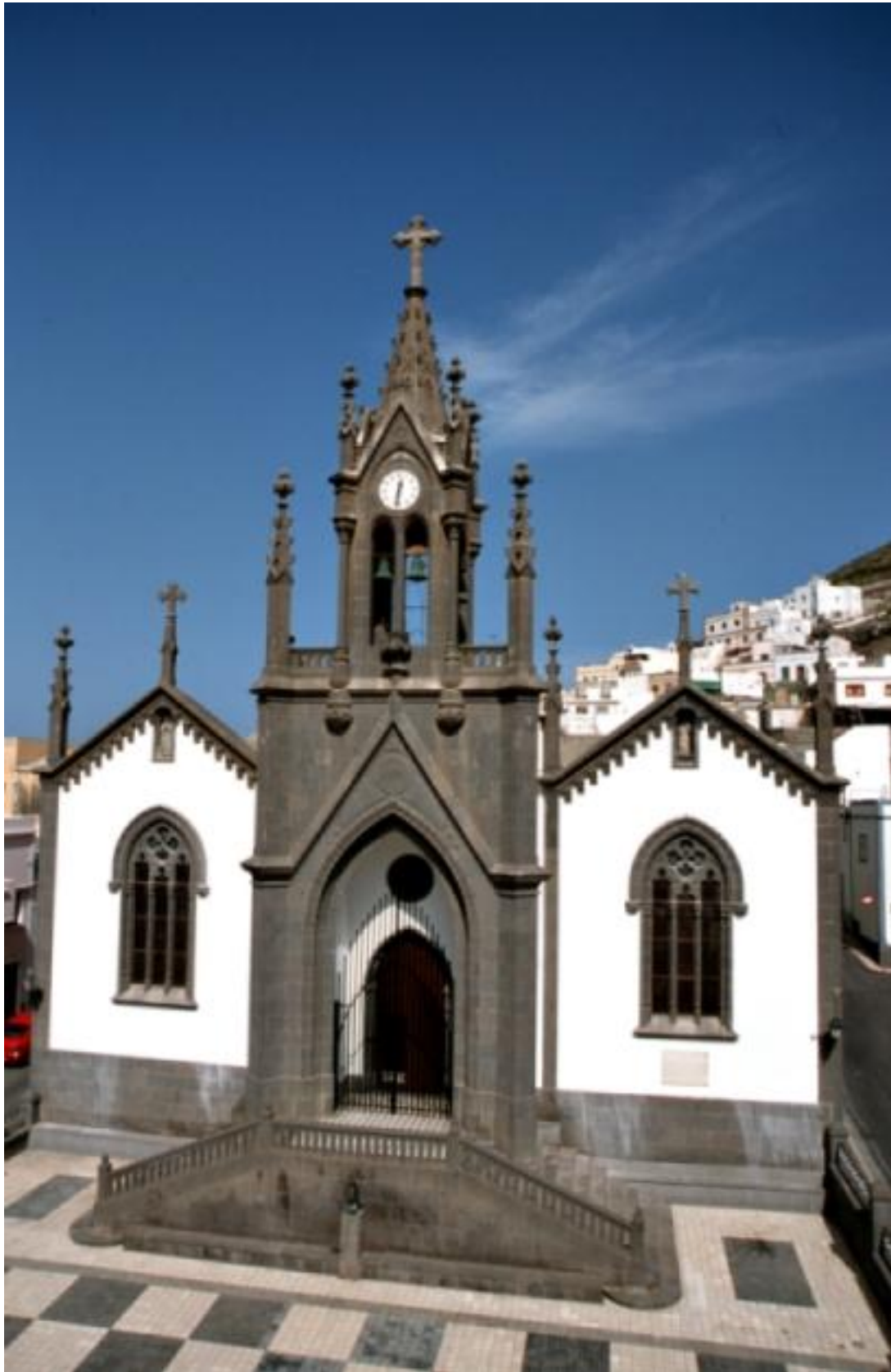
Fachada principal de la iglesia de San Isidro Labrador (Montaña de Cardones. Arucas)