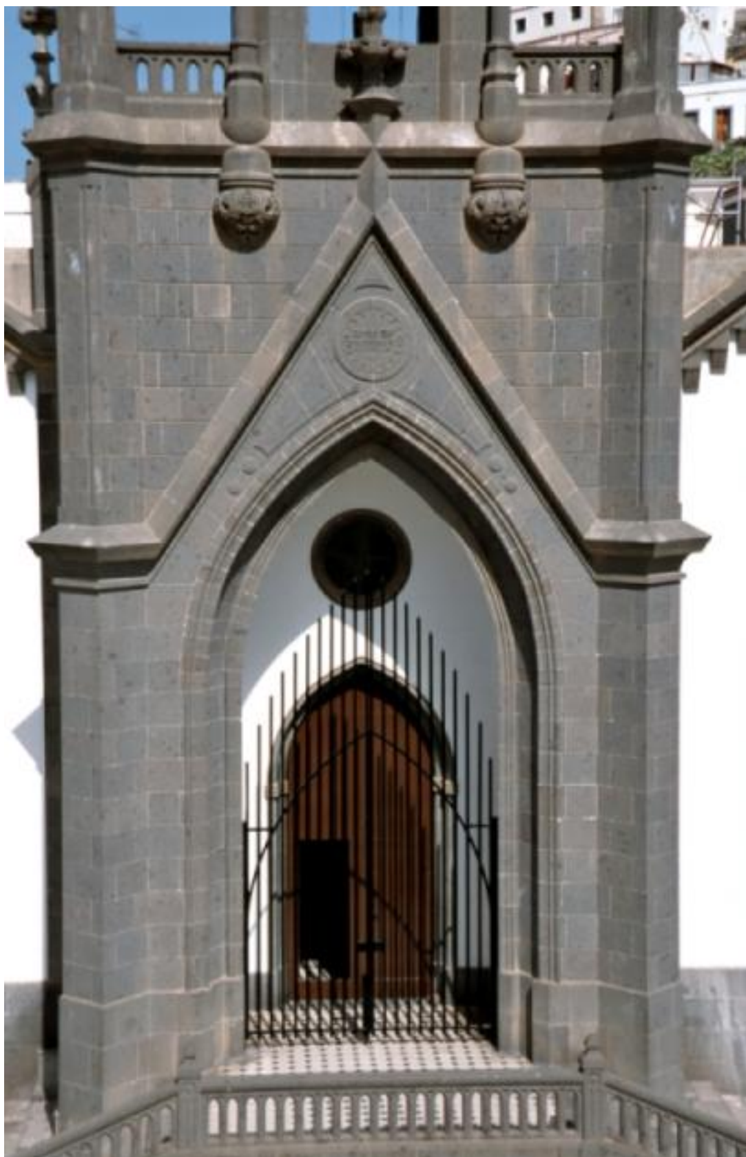
Detalle de la puerta de entrada de la iglesia de San Isidro Labrador.