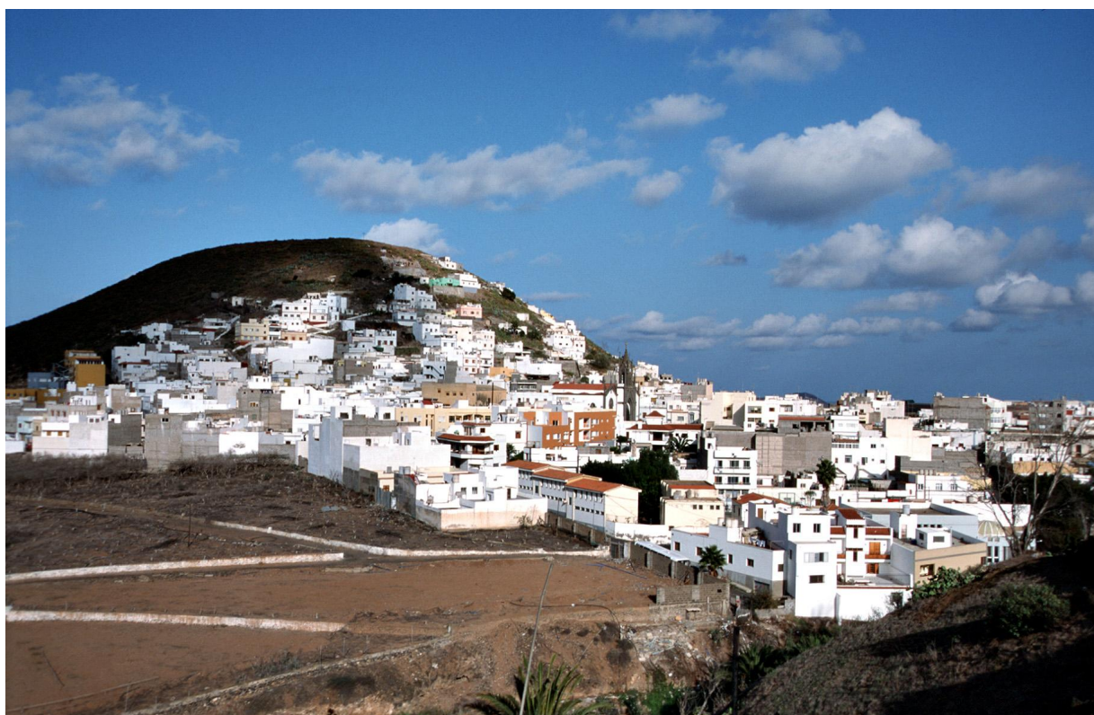
Vista general de Montaña de Cardones (Arucas).