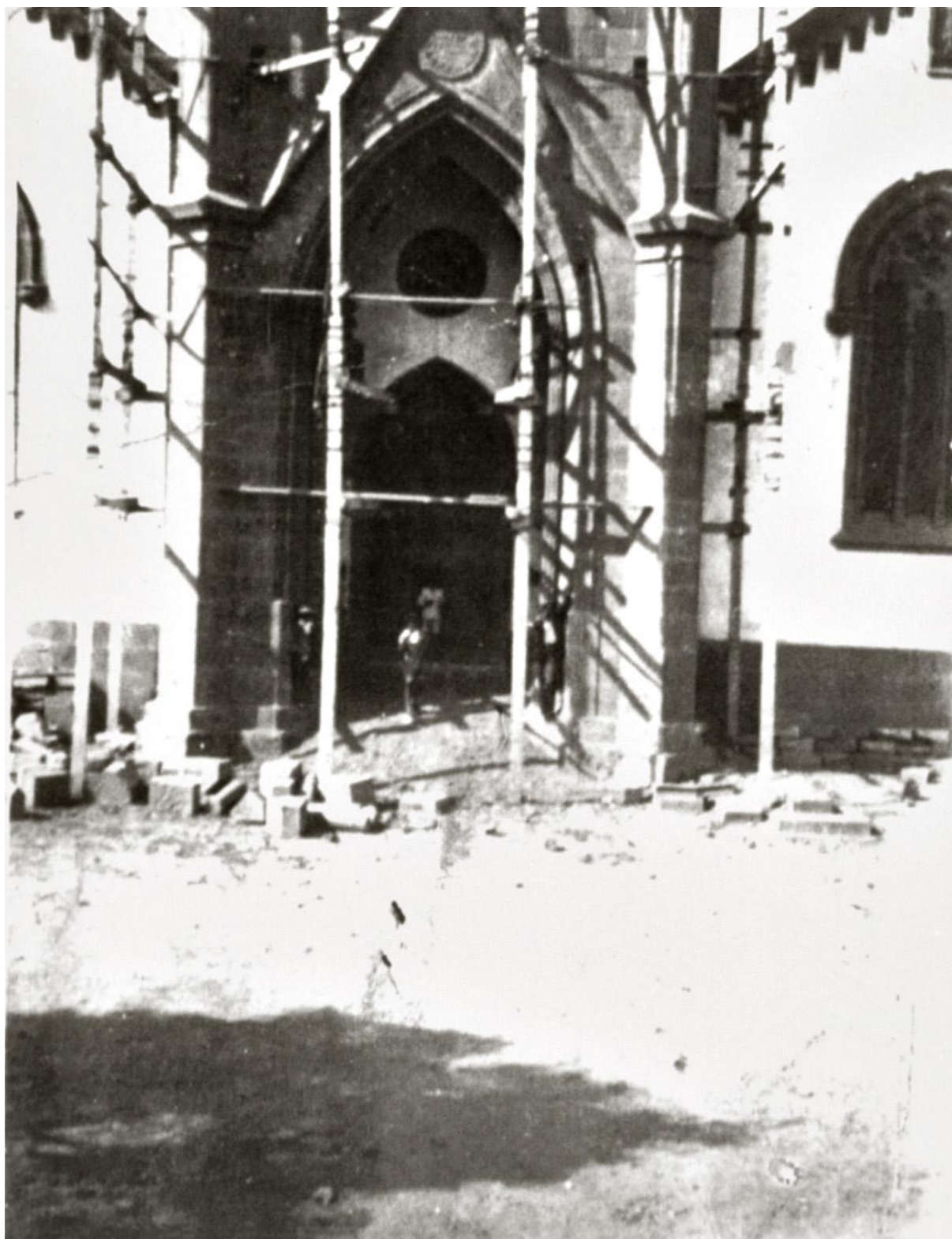
Construcción del frontis principal de la iglesia de San Isidro Labrador (siglo XX).