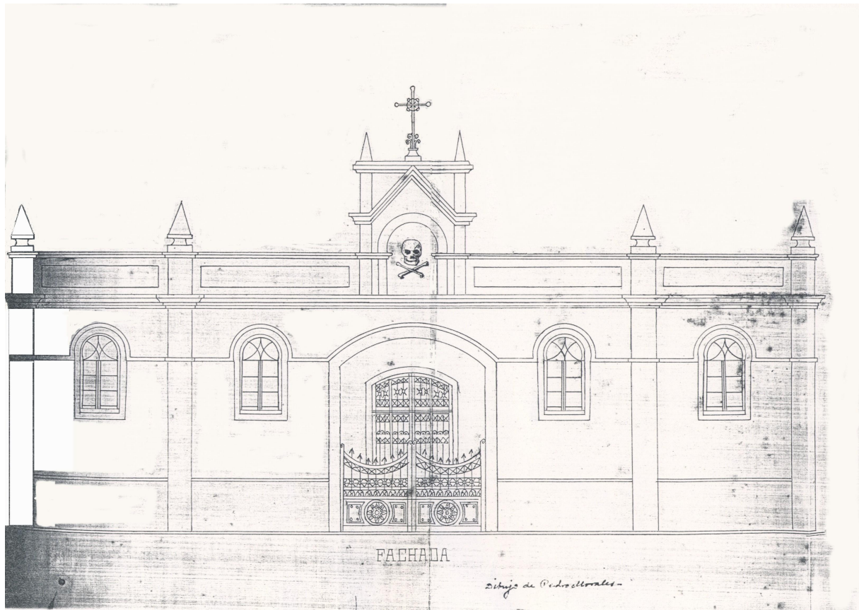
Dibujo de la fachada principal del Cementerio de Cardones por D. Pedro Morales Déniz