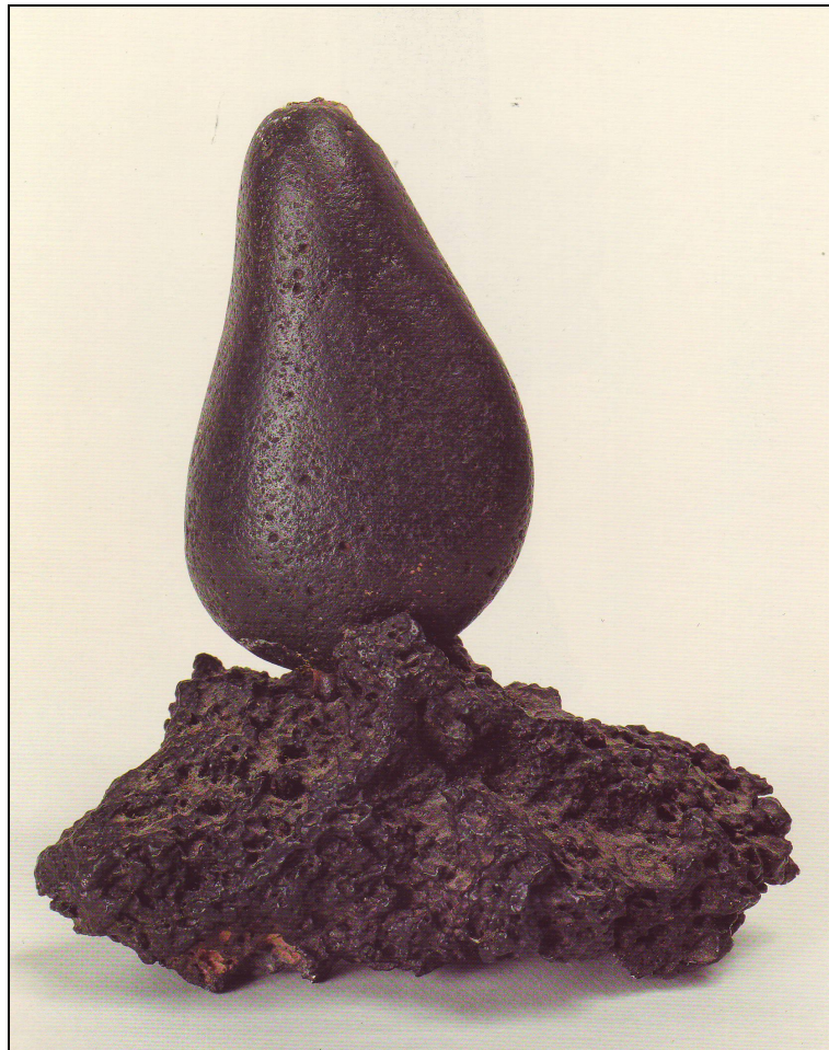
Figura I. Composición, c. 1942-45.

Su estancia en Lanzarote durante los primeros años de posguerra sirvieron a Lasso para reforzar los vínculos con su tierra de origen que, desde entonces y hasta el final de su vida, constituyó -según sus propias palabras- “el alfabeto que universaliza mis formas y mis conceptos de escultor”. 15