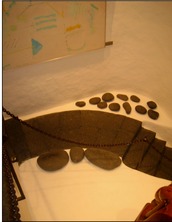
Figura IV. Museo Castillo de San José, c. 1976.