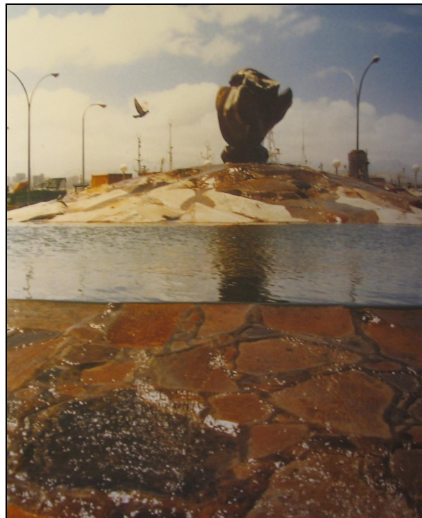
Figura VIII. Fuente El Callao, 1989.

Todo este proceso de exaltación de la identidad que desarrolla Tony Gallardo en sus “Piedras Canarias” se enmarca en el complejo contexto político y cultural que fueron los años de la Transición en Canarias, sin el cual su obra no se podría entender. En la segunda mitad de los setenta, el debate cultural canario estuvo dominado por la reflexión acerca de la existencia, o no, de una identidad canaria, 38 y la necesidad de crear nuevas iniciativas artísticas que dinamizasen el empobrecido panorama cultural que presentaba el archipiélago tras los largos