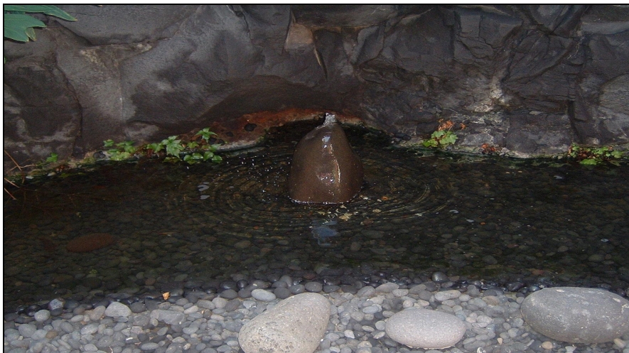
Figura V. Fuente con callaos, Fundación César Manrique, c. 1968.

Por último, no debemos olvidar que Manrique pasó los veranos de su infancia en Famara, una playa de infinitos horizontes salpicada de callaos modelados por el vaivén de una impetuosa marea. Estas imágenes, a buen seguro, quedaron para siempre grabadas en la retina de un hombre de una sensibilidad tan exquisita como la suya.