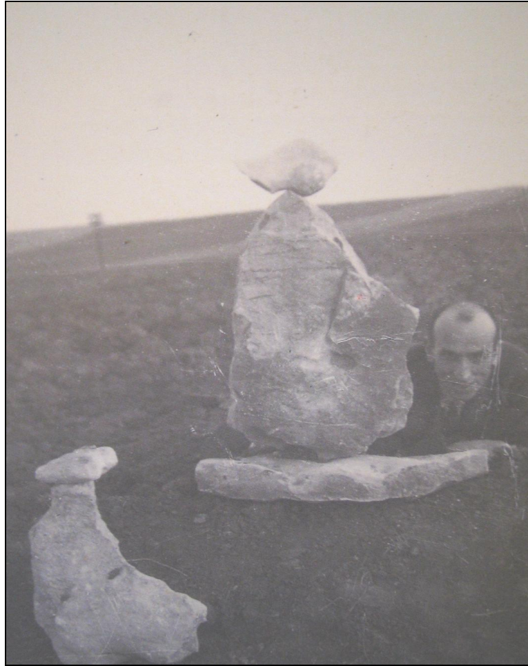
Figura II. Piedra-escultura, c. 1927-29.

En el panorama artístico canario, el caso de César Manrique constituye un ejemplo paradigmático de identificación de un creador con su paisaje natal. Efectivamente, a pesar de que vivió muchos años fuera de Lanzarote, esta nunca desapareció de su mente; muy al contrario, su estancia en el exterior le sirvió para confirmar que la belleza de los volcánicos perfiles de su tierra constituía un ejemplo único en el mundo. Por ello, tras una larga estancia en Nueva York, en 1966 decidió regresar a la isla, iniciándose entonces toda su etapa de intervención en ella.