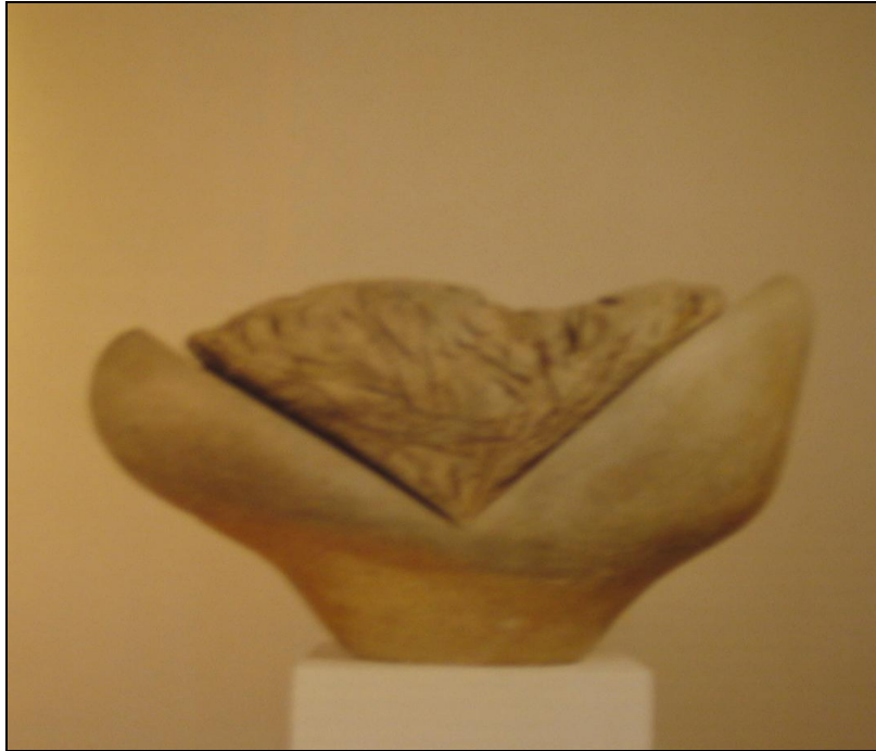
Figura VII. Callao VII, 1981.