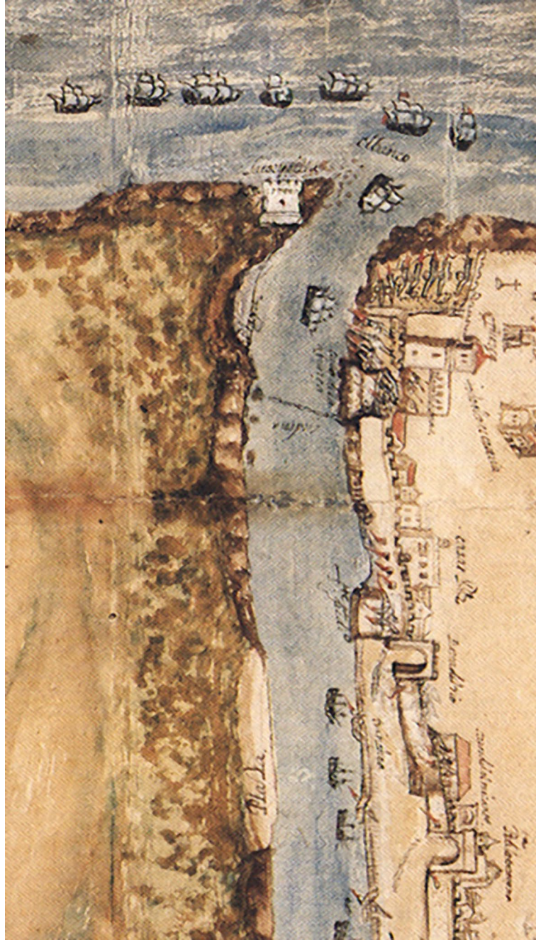
Lámina 7: detalle del mapa de la ciudad de Santo Domingo (1619) donde pueden observarse la cadena defensiva del río, la fortaleza, las baterías costeras y, en especial, el banco de arena y los arrecifes en la desembocadura del Ozama que obligaban a las naves a efectuar arriesgadas maniobras para esquivarlos. AGI, Santo Domingo, 54.