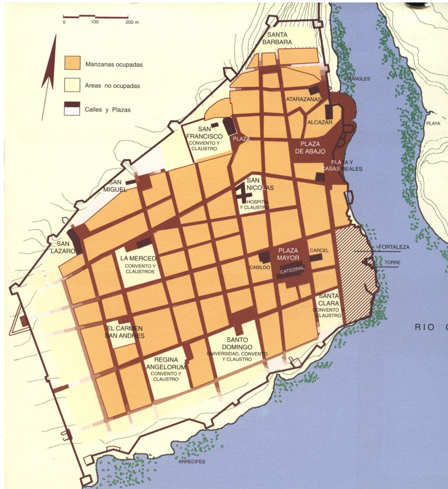
Lámina 5: plano de la ciudad de Santo Domingo con indicación de los arrecifes, mangles y otros obstáculos situados en el río Ozama, en PÉREZ MONTÁS, Eugenio: La ciudad del Ozama , Barcelona, 1999, p. 126.