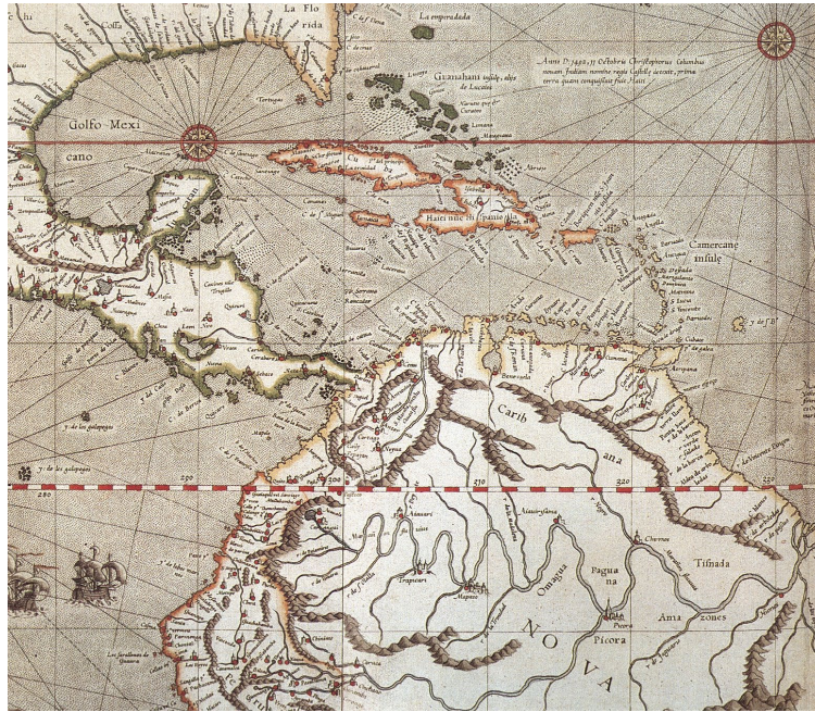
Lámina 1: detalle del Planisferio de Mercator (1569) con las Grandes Antillas en primer término, en NEBENZAHL, Kenneth: Atlas de Christophe Colomb et des Grandes Découvertes, Paris, 1991, p. 135.