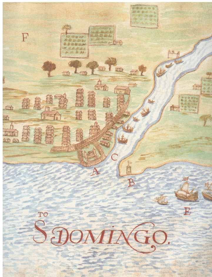
Lámina 2: mapa de la ciudad y puerto de Santo Domingo (A: el cubo o fuerte; B: una torrecilla que sirve de guía para entrar en el puerto; C: el río donde entran las naos; E: los navíos de la pesquería), en DE CARDONA, Nicolás: Descripciones geográficas e hidrográficas, Madrid, 1989, p. 41.