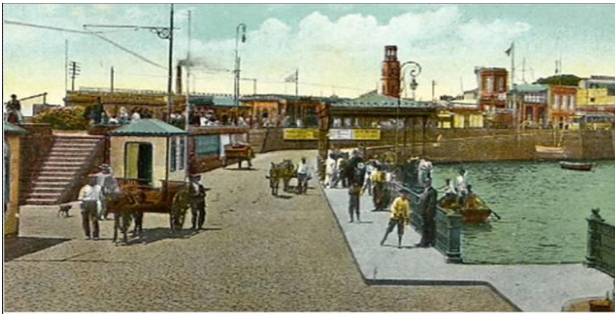
Postal del Puerto de Santa Cruz con la iglesia de La Concepción al fondo. Donación particular.

El siglo XVIII fue especialmente importante en la historia de Santa Cruz de Tenerife, pues fue el momento del despegue definitivo del puerto y, consecuentemente, del crecimiento urbano y demográfico de la ciudad. La población enterrada en la iglesia de La Concepción, objeto de nuestro estudio, tendrá que ser por tanto un reflejo de las complejas condiciones sociales y económicas que vivieron los habitantes del dieciocho, en una ciudad portuaria canaria en crecimiento 6 .