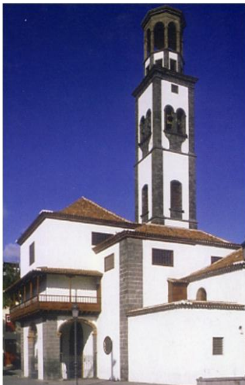
Imagen de la torre de la Iglesia actualmente. Donación particular.

posicionamos en la utilización de términos más precisos, como el de Arqueología colonial para designar a los estudios de yacimientos con cronologías ligadas al proceso de conquista y repoblación del archipiélago (siglos XIV y XV), o de Arqueología moderna para referirnos a todos los yacimientos con cronologías que abarquen los siglos XVI al XVIII, entre los que se encuentra la iglesia de La Concepción.