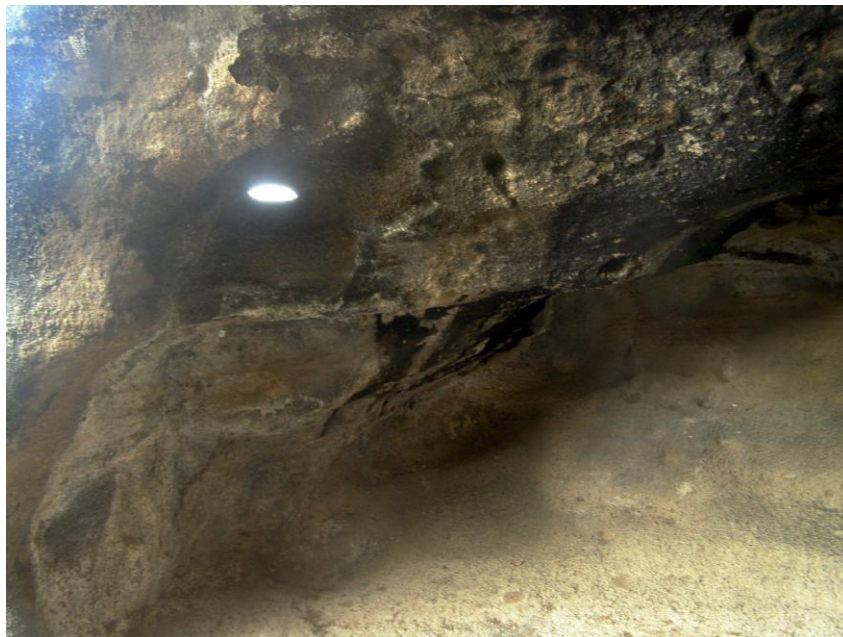
FOTO 2. Pared occidental de la Cueva 1.

La pared occidental de la cueva no presenta ninguna particularidad, salvo un pequeño orificio excavado artificialmente en la roca. El orificio tiene tendencia circular y mide, aproximadamente, 18 cm de ancho por 15 cm de alto (Foto 2). Su presencia llamó la atención de los técnicos del MAG, que se pusieron en contacto con uno de nosotros para proponerle una investigación arqueoastronómica del lugar.