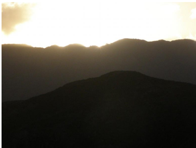
FOTO 6. Puesta de sol.

Determinado el punto exacto de la puesta del sol en el horizonte, pudimos comprobar que ese punto coincide exactamente con la degollada de Las Nieves o de Chijelá, 13 en cuyos alrededores se conservan varias aras de sacrificio de los antiguos gomeros, y justo detrás de la cual se levanta la ermita de Las Nieves (Foto 6).