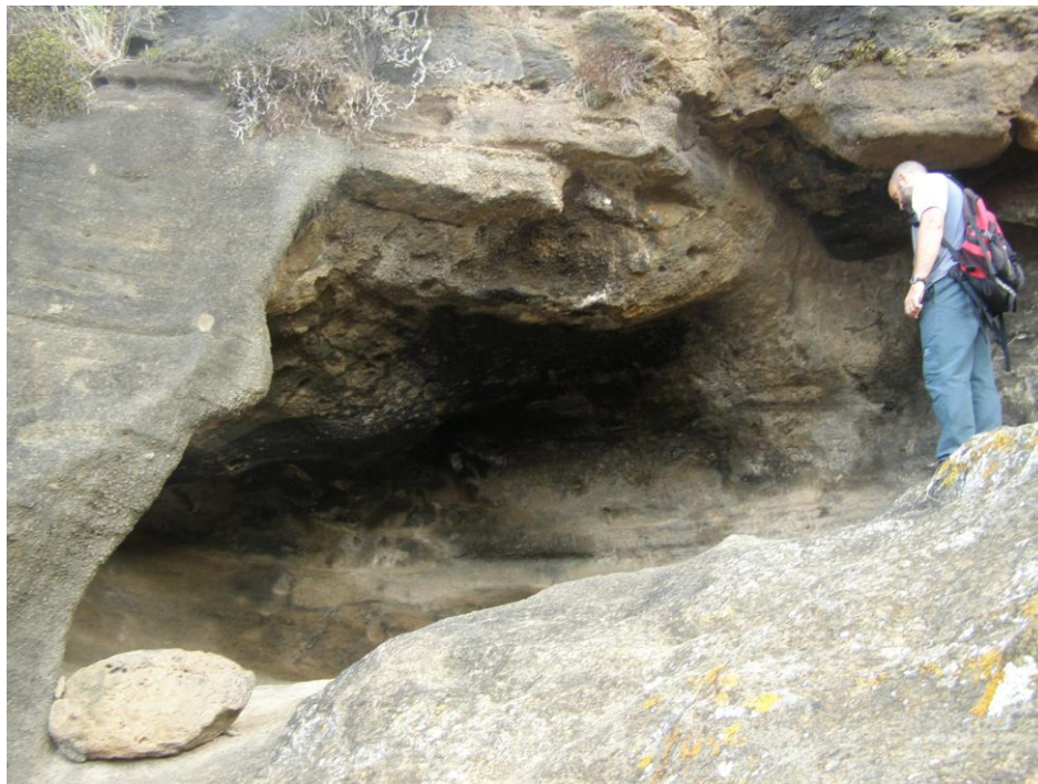
FOTO 1. Cueva 1 de Las Toscas del Guirre.

El conjunto arqueológico de Las Toscas del Guirre está compuesto por diversas cuevas naturales de habitación y enterramiento localizadas en una ladera escarpada de un barranco del sector oriental de la isla. Su localización exacta no ha sido desvelada debido a la extrema fragilidad de la cueva que nos ocupa: la Cueva 1 de Las Toscas del Guirre (Foto 1).