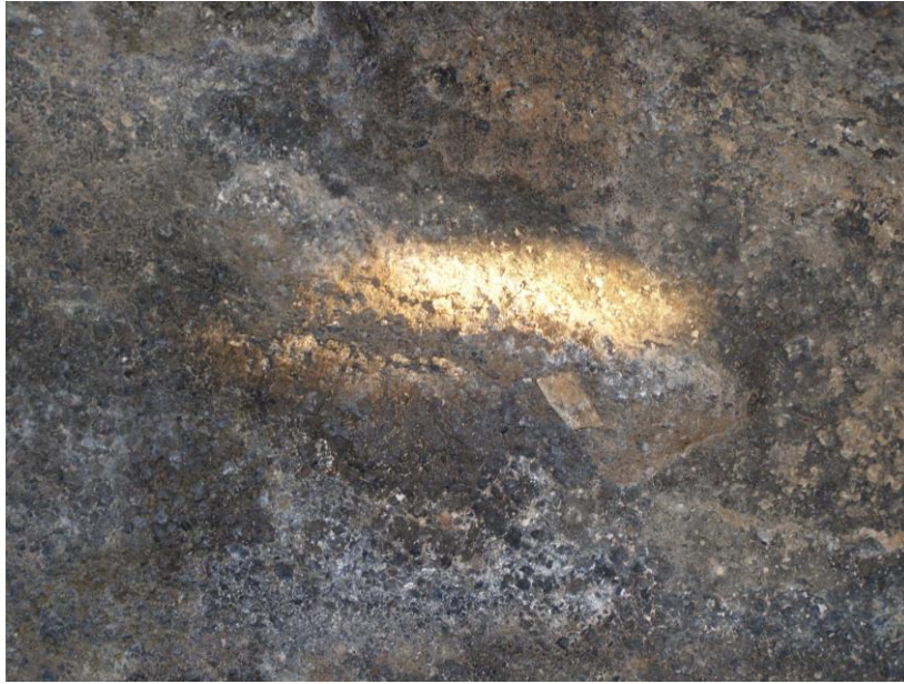
Foto 5. Último rayo del sol encajando en la cazoleta (23 de diciembre 2012).

El recorrido del rayo es tal que, antes de apagarse la luz del sol, el último rayo de luz del último día del otoño encaja perfectamente en una pequeña cazoleta ovalada excavada en la pared oriental de la cueva. 12 La cazoleta tiene unos 20 cm de longitud y 5 cm de ancho (Foto 5).