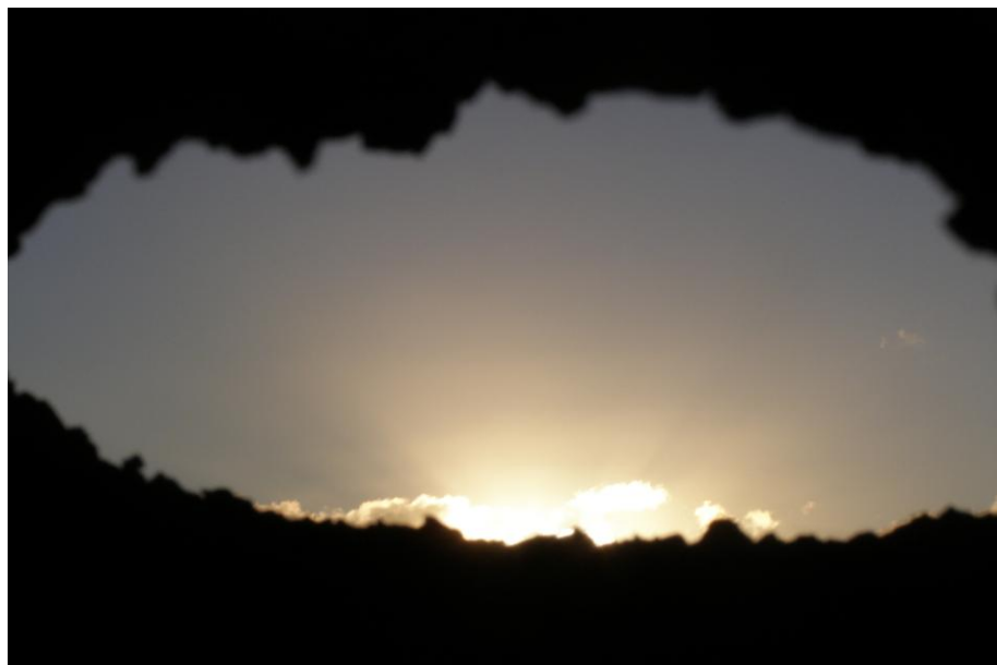
Foto 4. Puesta del sol el 23 de diciembre de 2012 vista a través del orificio de la cueva.

Con objeto de verificar las circunstancias exactas del fenómeno hicimos un seguimiento de la cueva en los días cercanos al último solsticio invernal, ocurrido el pasado 22 de diciembre. Este seguimiento nos permitió observar la puesta solsticial centrada en el orificio (Foto 4).