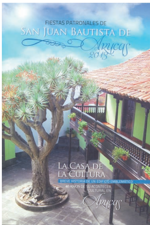
Foto 3. Portada del programa de las Fiestas Patronales, dedicado a la historia de la Casa de la Cultura (2013).

Dentro de esta línea, debemos mencionar la repercusión que ha tenido en la sociedad aruquense los recorridos nocturnos, realizados con motivo de la declaración de Conjunto Histórico Artístico, el 10 de diciembre de 1976, dedicados a diferentes temas que han ayudado a descubrir las singularidades del casco antiguo de forma activa y diferente, así como la elaboración de los textos culturales e históricos de los programas de las fiestas San Juan Bautista, que aportan información inédita y cercana sobre la historia del municipio, en ocasiones, teniendo como autores a los propios componentes de la Concejalía y, en otras, a diferentes historiadores/as e investigadores/as de gran significación. Estos se han realizado de manera continuada desde 1995, abarcando temas etnográficos, arqueológicos, histórico-artísticos, culturales, naturales, la historia concreta de edificios catalogados y el proceso de su rehabilitación, oficios tradicionales, etc. En todos ellos, destacamos las aportaciones de la ciudadanía con su información oral, siendo, en muchos casos, indispensable para hablar de cuestiones que aún no estaban escritas y que podían desaparecer con el tiempo. Podríamos decir que algunos miembros de la sociedad aruquense han escrito algunas líneas de la historia de Arucas gracias a la memoria colectiva 16 . Foto 3.