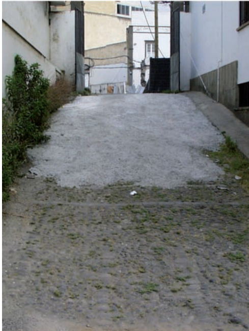
Foto 11. Pasaje El Herrero con afeción por vertido de hormigón (2004).