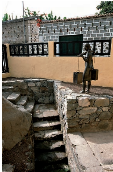
Foto 6. Recuperación de la Fuente de Cardones (1999).