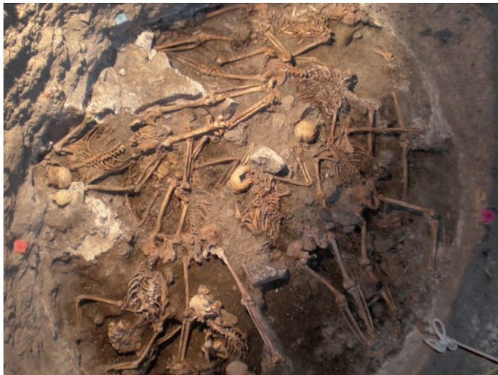
Foto 13. Excavación del interior del pozo del Llano de las Brujas, recuperación de desaparecidos de la Guerra Civil (2009).