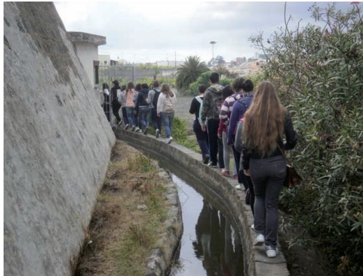
Foto 1. Visita guiada a la Acequia de San Juan (2012). Cultura del Agua.

naturales del municipio (Lomo Riquiáñez, Lomo Jurgón, Costa, etc.). Hoy día se incluyen otras actividades y rutas. Para desarrollar las visitas y rutas se crearon diferentes materiales didácticos como cuadernillos ( Centro Histórico de Arucas, Parque Municipal, El Museo Municipal, Historia de los Barrios e Historia de Género ). En la edición de los últimos cuadernillos, se ha recurrido al formato papel pero, también, a la oportunidad que ofrece la digitalización de los mismos para que lleguen de manera gratuita y de forma fácil a todos/as los interesados/as. Una de las últimas actuaciones, ha sido la creación de una aplicación informática para conocimiento del Museo Municipal (App para móviles Android), con la que se puede acceder visitando el edificio con la captación del QR y desde otros lugares. A esta información, se une los ya recorridos paneles divulgativos 13 y los folletos turísticos. Foto 1. Foto 2.