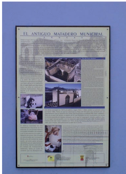
Foto 2. Panel divulgativo, antiguo Matadero Municipal (2003).