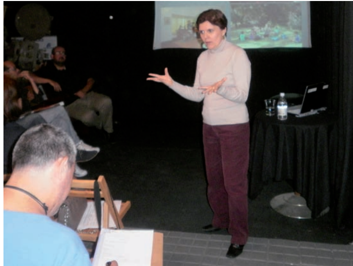
Foto 4. Impartición de una conferencia alusiva a los espacios museísticos en las Jornadas Barrio Antiguo, organizadas por el colectivo Salsipuedes (2013).

Además de las jornadas enfocadas a la ciudadanía general, desde la Concejalía de Patrimonio Histórico se han organizado e impartido varios cursos dirigidos al personal municipal, como protección del patrimonio histórico por la Policía Local (2010) 18 , introducción la archivística (2012) y evaluación del impacto ambiental (2012). Foto 4.