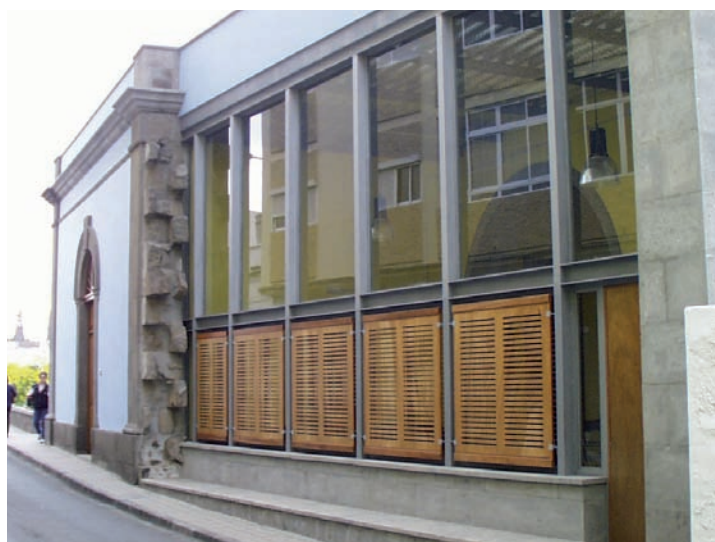
Foto 9. Edificio del antiguo Matadero Municipal, ya restaurado (2003).