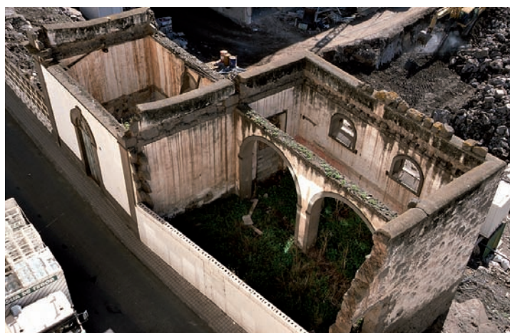
Foto 8. Antiguo edificio del Matadero Municipal antes de su rehabilitación (1999).