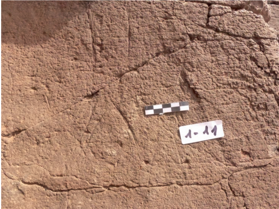
Foto 7. Inscripción líbico-bereber.