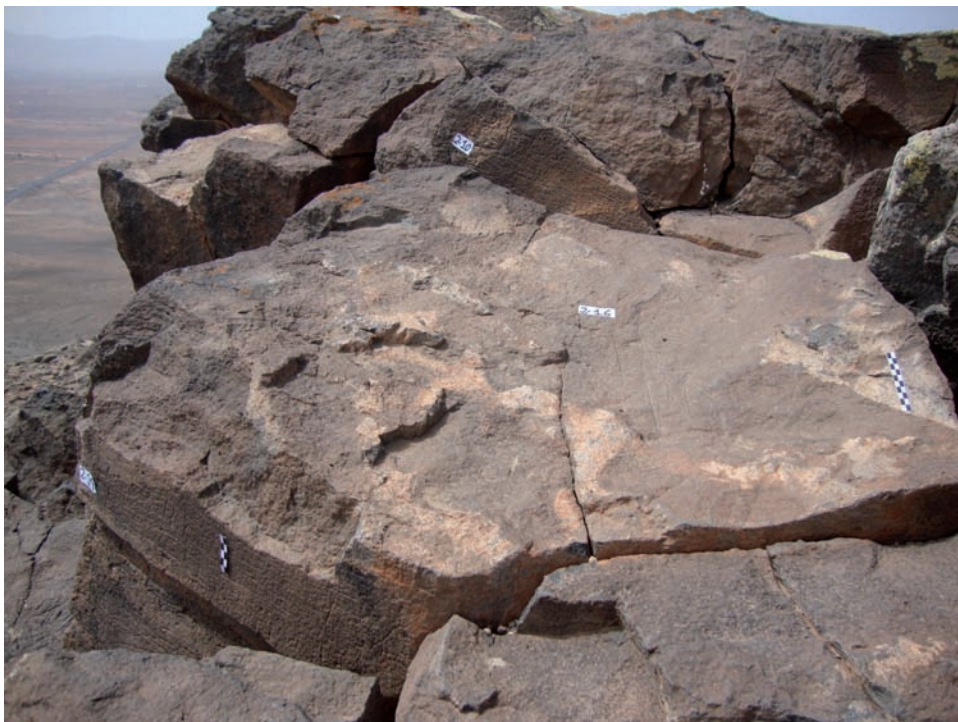
Foto 8. Paneles ubicados en la parte superior del yacimiento.