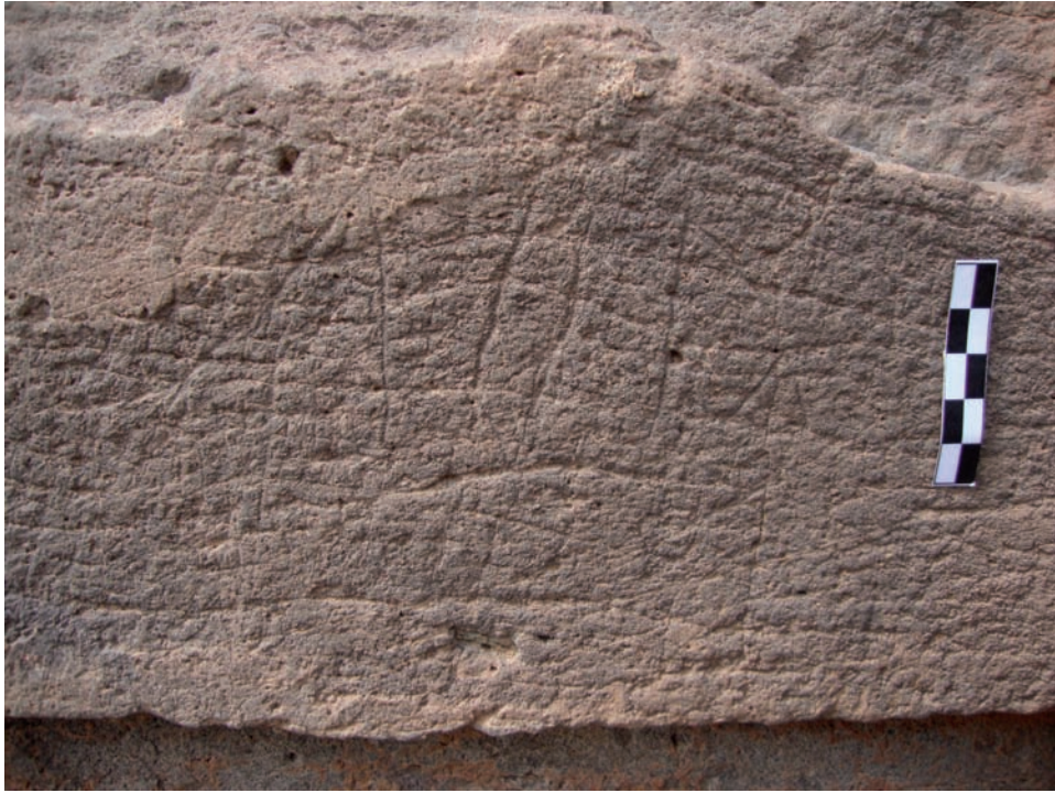
Foto 3. Inscripción líbico-canaria.