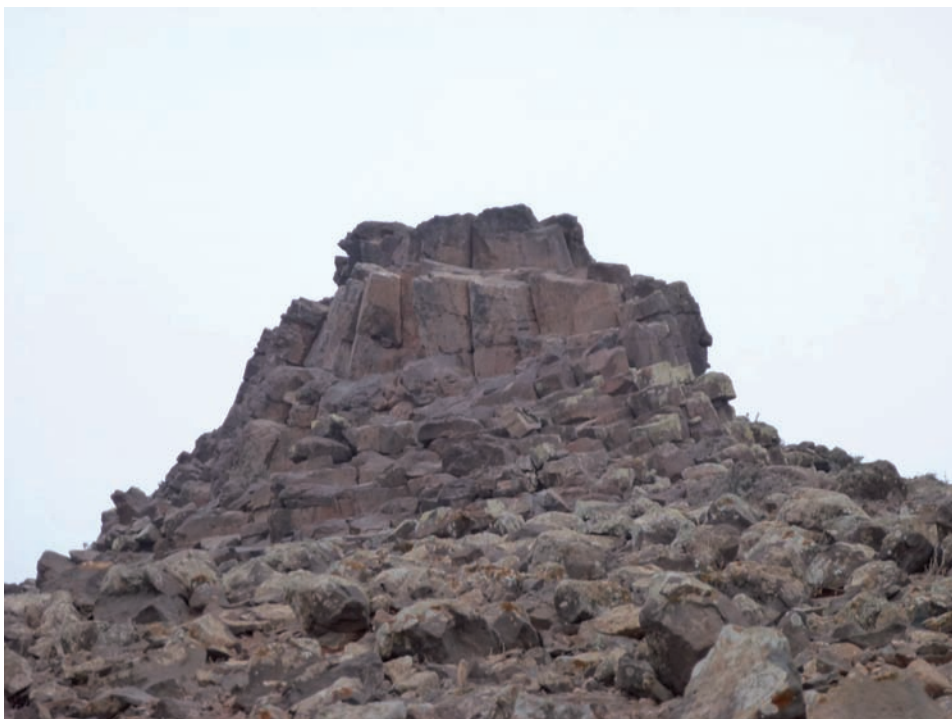
Foto 1 y Foto 2. Montaña del Sombrero. Cumbre