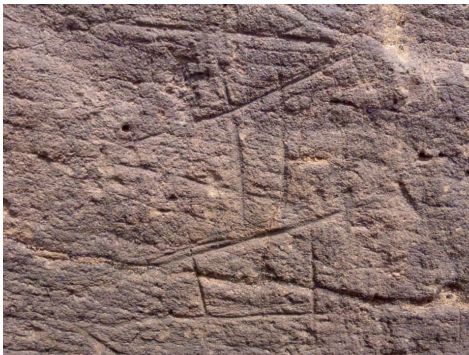
Foto 6. Detalle superposición de la misma inscripción líbico-bereber y líbico-canaria.