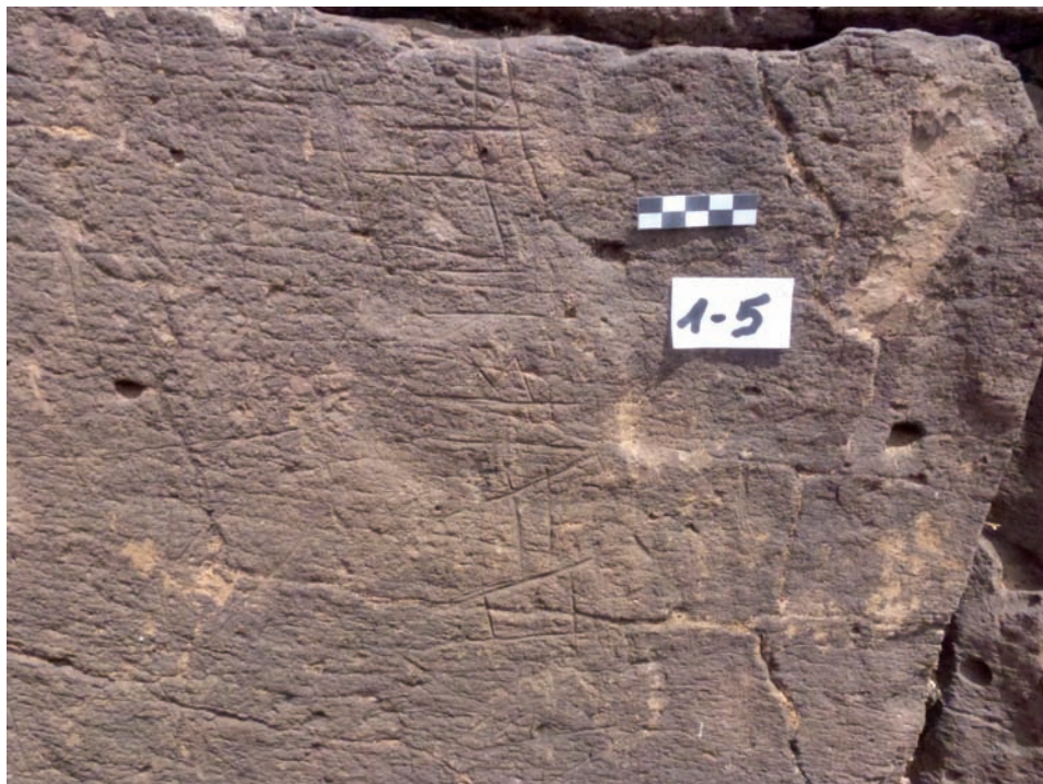
Foto 5. Inscripción líbico-bereber y líbico-canaria superpuestas.