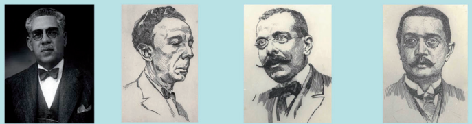
Los propios estatutos de 1904 constatan la existencia de los constitutivos de 1898.

En la gestación y primeros pasos de las Asociaciones de la Prensa de Gran Canaria y de Tenerife se aprecia el protagonismo de los periodistas más activos y destacados, como de los periódicos más sobresalientes de aquellos años previos y coincidentes con los de la I Guerra Mundial, hoy considerados como un momento de verdadero esplendor en la historia del periodismo canario.