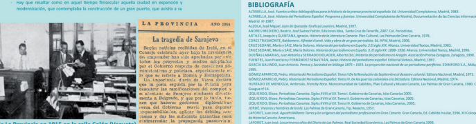
Redacción de la Provincia en 1915 en la calle Colón (Vegueta)

No fue una mera casualidad, surgida de la espontánea creatividad de un profesional. La prensa de la isla, en aquellos años insular, vivió como en el resto España un momento de resurgimiento, de modernización, intentándose adaptarse a las nuevas concepciones del periodismo que se imponían en el mundo.