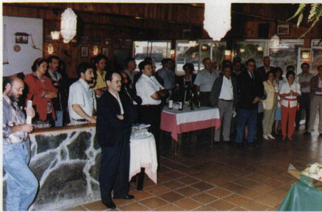
Bodegueros participantes en la I Cata Insular de Vinos de Gran Canaria.

La cata se realizó por el procedimiento "Cata a Ciegas". El jurado calificador utilizó la ficha de la O.I.V. (Oficina Internacional de la Viña y el Vino) adaptada por el I.N.D.O. (Instituto Nacional de Denominaciones de Origen), llegando a la puntuación final de cada muestra por medio de la "mediana".