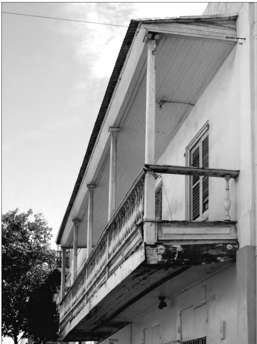
FIGURA 9: Balcón en Ponce

distintivo de la época. El edificio de la Inquisición de Cartagena de Indias, de 1770, presenta balcones corridos de 3 y cuatro