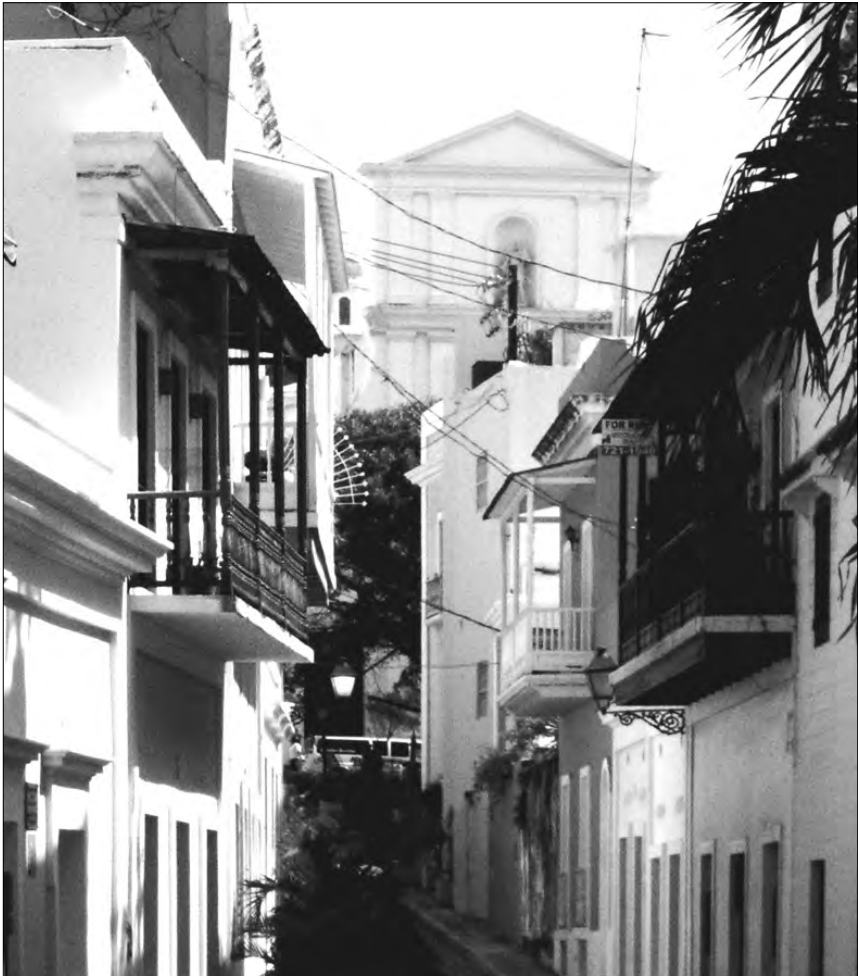
FIGURA 4: Balcones en la calle San Juan en la capital de Puerto Rico

Al contrario que los balcones canarios, entre los que abundan los de un solo vano, los balcones puertorriqueños suelen ser