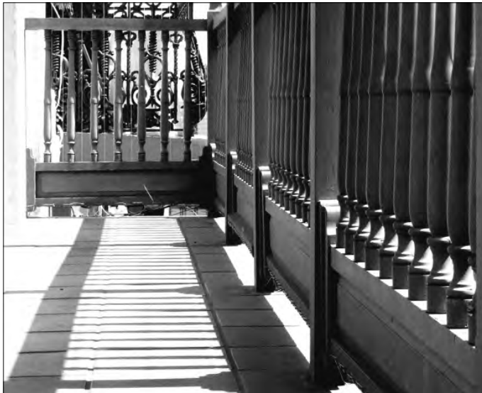
Figura 7: Tapafaldas en la calle Fortaleza de San Juan de Puerto Rico

A: La Habana (Cuba); B: Bogotá (Colombia); C: Puerto Cabello (Venezuela); D y E: Cuzco (Perú); F: Salta (Argentina); G: Santiago de Chile; H: Potosí (Bolivia); I: Lima (Perú) (elaboración propia)