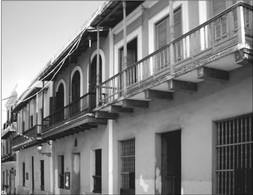
FIGURA 5: Balcones en la calle Cristo de San Juan, donde se ven los canes, cortados a escuadra, que han quedado descubiertos al desprenderse la tabica que los oculta

damos situarlo en los antepechos opacos de tablas —dispuestas en vertical— que aún se conservan en las arquitecturas montañosas del norte de España. Progresivamente, la labor estética sobre el antepecho de los balcones y solanas fue reduciendo la parte opaca al ir perfilando las tablas con diversos motivos y con la incorporación de balaustres; esto ya en épocas más recientes y en construcciones más nobles. En algún texto antiguo encontramos que el uso principal de los balcones era que las «damas nobles, y castas» 66 , pudiesen solazarse con las vistas hacia la calle. Con el fin de evitar las vistas indiscretas desde la