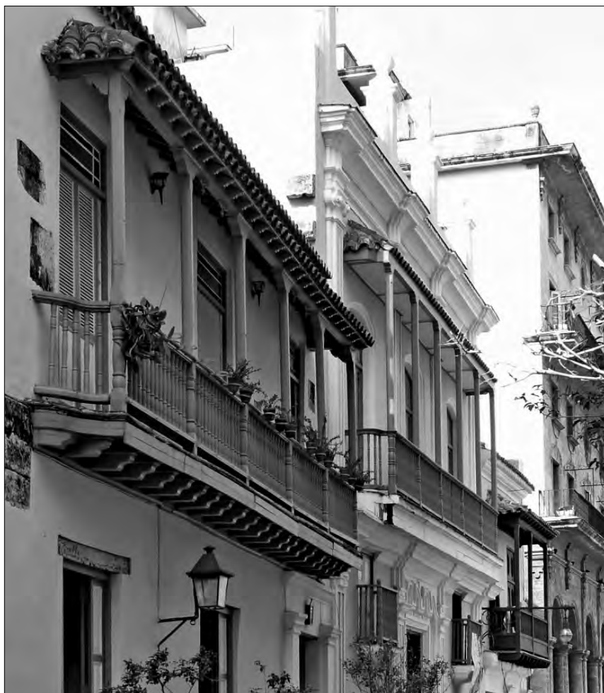
FIGURA 2: Balcones en la calle Oficios llegando a la plaza de San Francisco en La Habana (Cuba). A pesar de ser ejemplos tardíos del siglo XVIII, que se observa por el lateral de perfil curvo cóvexo-cóncavo, conservan las zapatas entre los pies derechos y la carrera así como el faldón lateral del tejeroz

Precisamente sobre el origen de los balcones cubanos —que se empezaron a levantar en el siglo XVII—, el profesor Prat Puig diserta de forma abundante. Tras exponer las teorías arquitectónicas