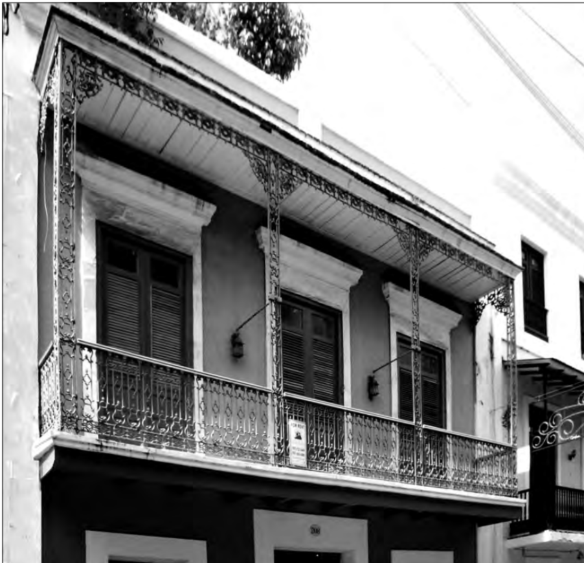
FIGURA 10: Balcón de hierro que ha sustituido a uno más antiguo de madera en la calle Cristo de San Juan. Se han conservado los canes, el suelo y el tejeroz, aunque la baranda y los pies derechos se han sustituido por elementos de hierro forjado

ciendo a favor del hierro, por sus valores de prefabricación y economía. En una primera etapa conviven ambos materiales, ya que las piezas de madera que van necesitando reparaciones se sustituyen por otras metálicas; gradualmente el balcón original ha cambiado la madera por hierro pero ha mantenido la forma. Sin embargo, en una segunda etapa los balcones ya se construyen enteramente de hierro y sus formas responden a las nuevas influencias que esta vez provienen de los Estados Unidos, Francia e Inglaterra. De esta manera gradual se termina de diluir el tipo tras cuatro siglos de permanencia en tierras americanas.