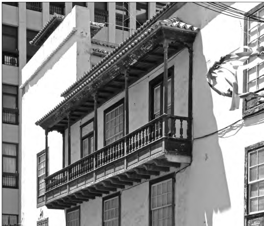
FIGURA 1: Balcón en la calle Álvarez Abreu en Santa Cruz de La Palma

cía, de donde sostiene que paralelamente llegaron a Cuba y Canarias. Pero esto es insostenible, pues los ejemplares cubanos son más tardíos que los canarios y guardan una evidente relación con los del norte de la Península y, en consecuencia, con los de Canarias» 35 .