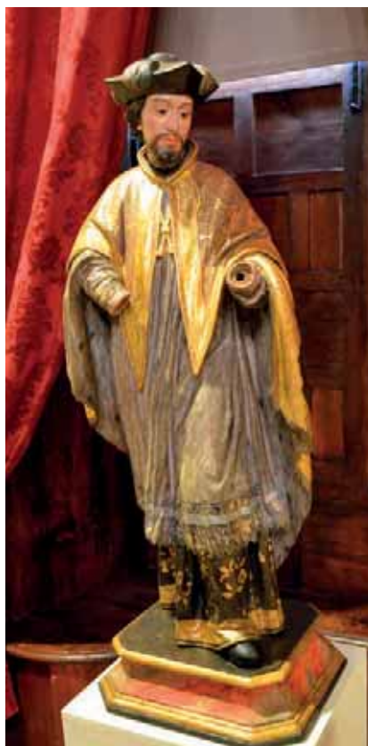
Fig. 23. San Juan Nepomuceno . Parroquia de Nuestra Señora de la Concepción, La Orotava