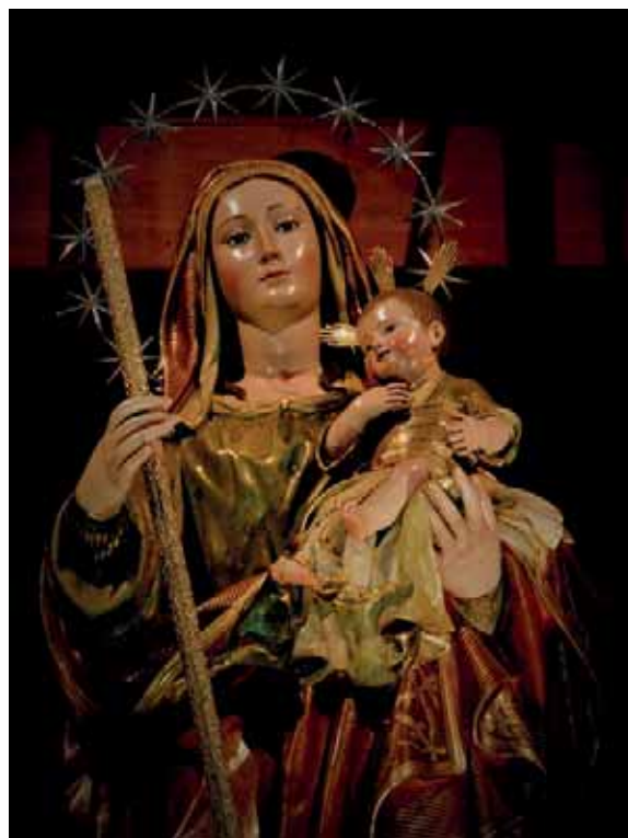
Fig. 15. Virgen de Candelaria . Parroquia de Nuestra Señora de la Candelaria, Ingenio