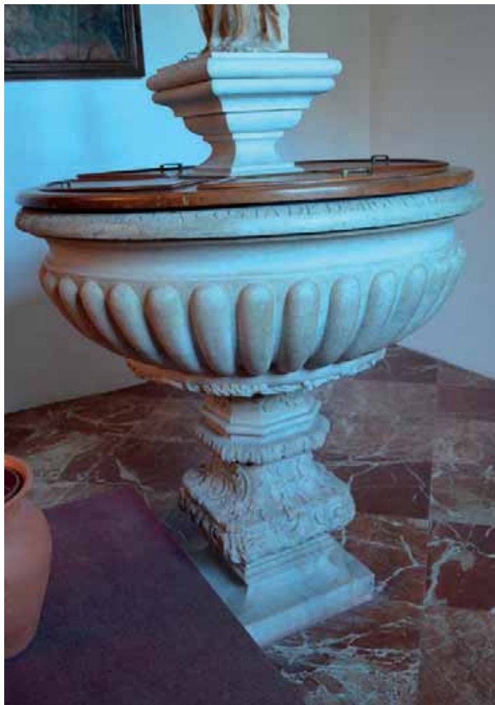
Fig. 4. Pila bautismal . Parroquia de Nuestra Señora de la Concepción, La Laguna