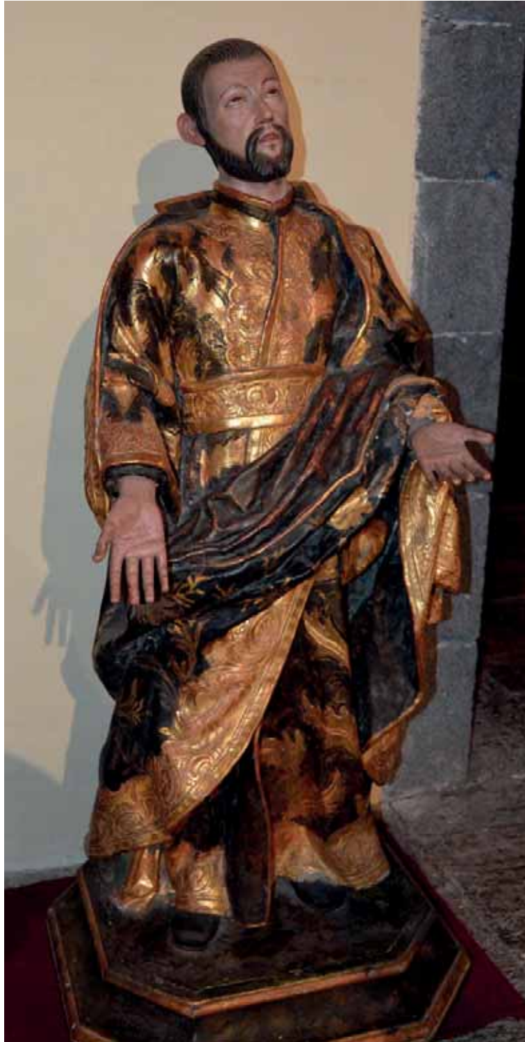
Fig. 10. San Cayetano . Parroquia de Nuestra Señora de la Concepción, La Orotava