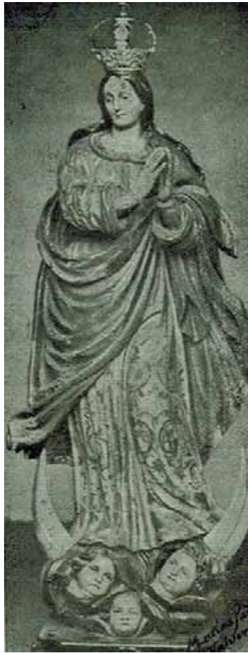
Fig. 24. Inmaculada Concepción . Parroquia de Nuestra Señora de la Concepción, Valverde