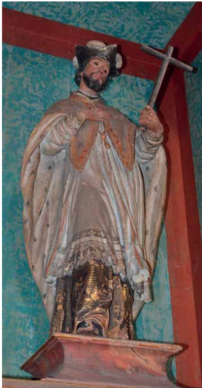
Fig. 21. San Juan Nepomuceno . Parroquia de Nuestra Señora de la Asunción, San Sebastián de La Gomera