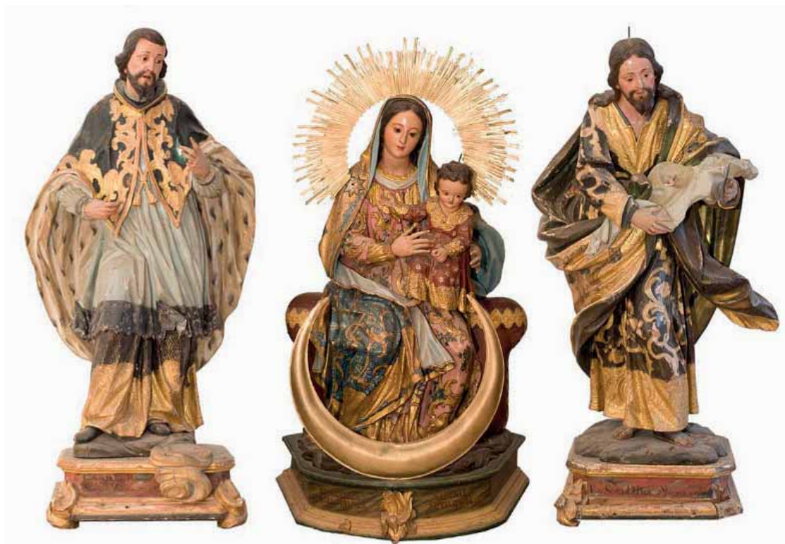
Fig. 13. San Juan Nepomuceno . Virgen de Montenegro . San José con el Niño . Colección particular, Santa Cruz de Tenerife