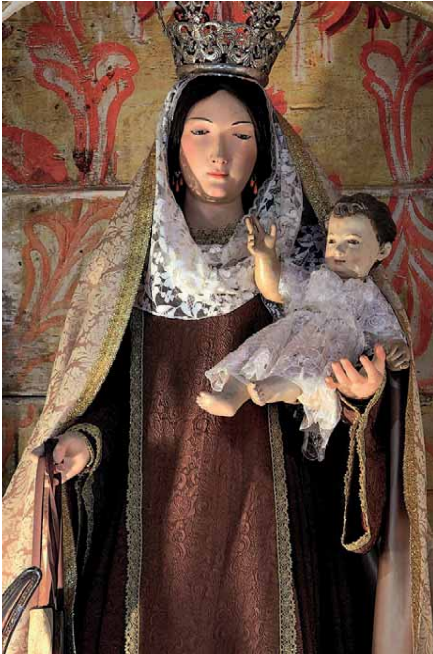
Fig. 9. Virgen del Carmen . Parroquia de San Juan Bautista, Arico