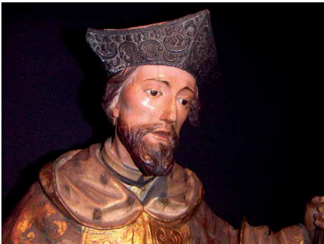
Fig. 12. San Juan Nepomuceno . Ermita de San Antonio Abad, Las Palmas de Gran Canaria