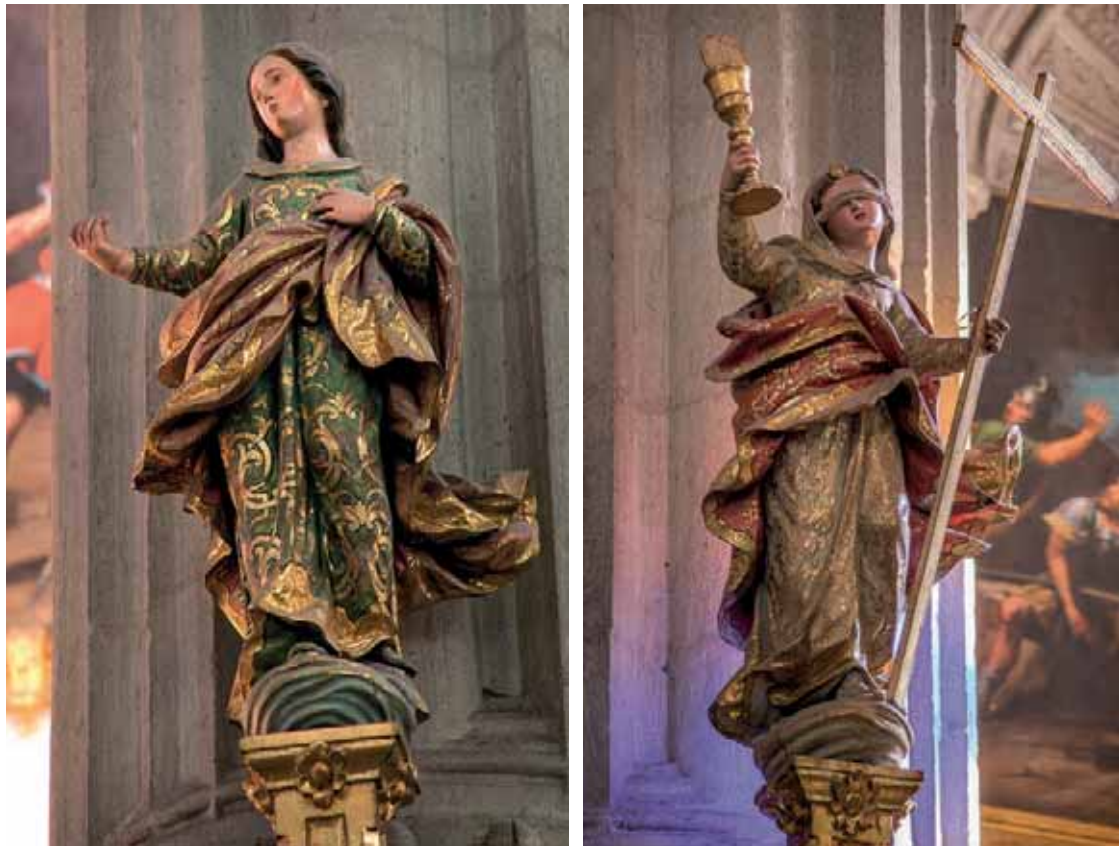
Fig. 17. Fe. Esperanza [púlpitos]. Catedral de Santa Ana, Las Palmas de Gran Canaria