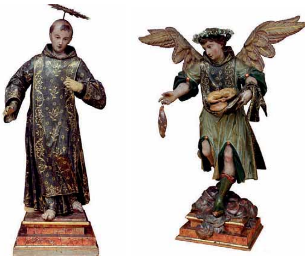
Fig. 8. San Juan de Dios . San Rafael Arcángel . Iglesia de San Francisco, La Orotava