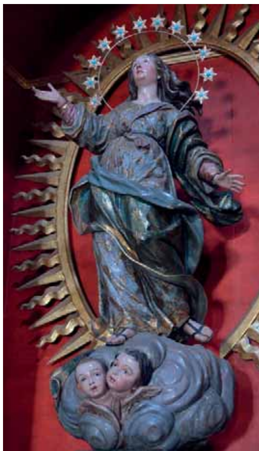
Fig. 19. Virgen de la Asunción . Parroquia de Nuestra Señora de la Asunción, San Sebastián de La Gomera