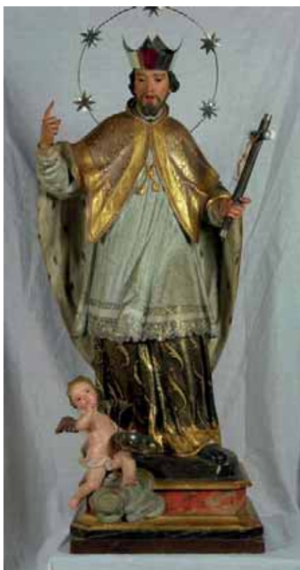
Fig. 22. San Juan Nepomuceno . Parroquia de Nuestra Señora de la Concepción, La Orotava