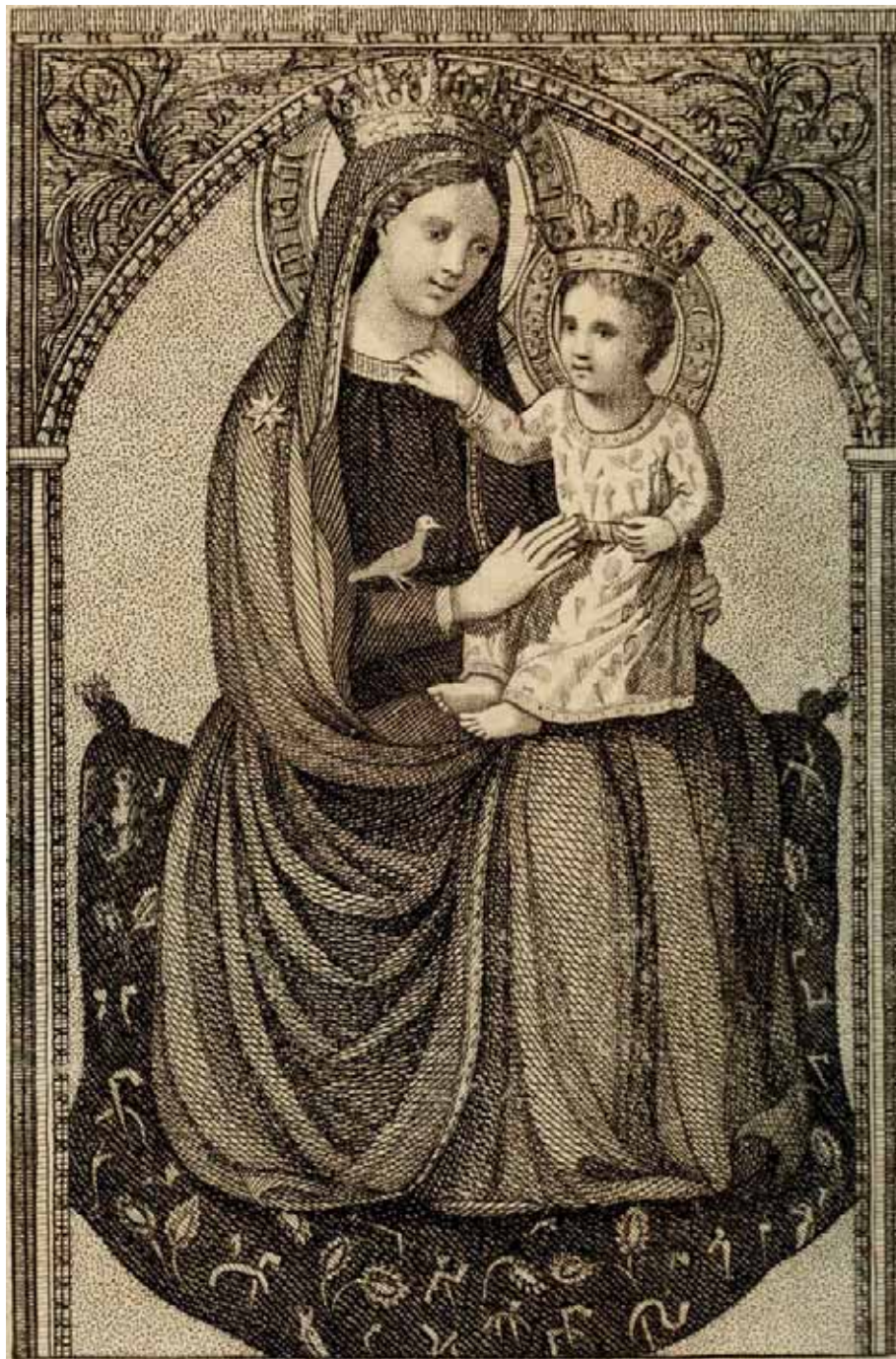
Fig. 14. Virgen de Montenegro . Colección particular, Madrid