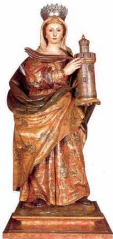
Fig. 1. Santa Bárbara . Parroquia de Santiago Apóstol, Los Realejos