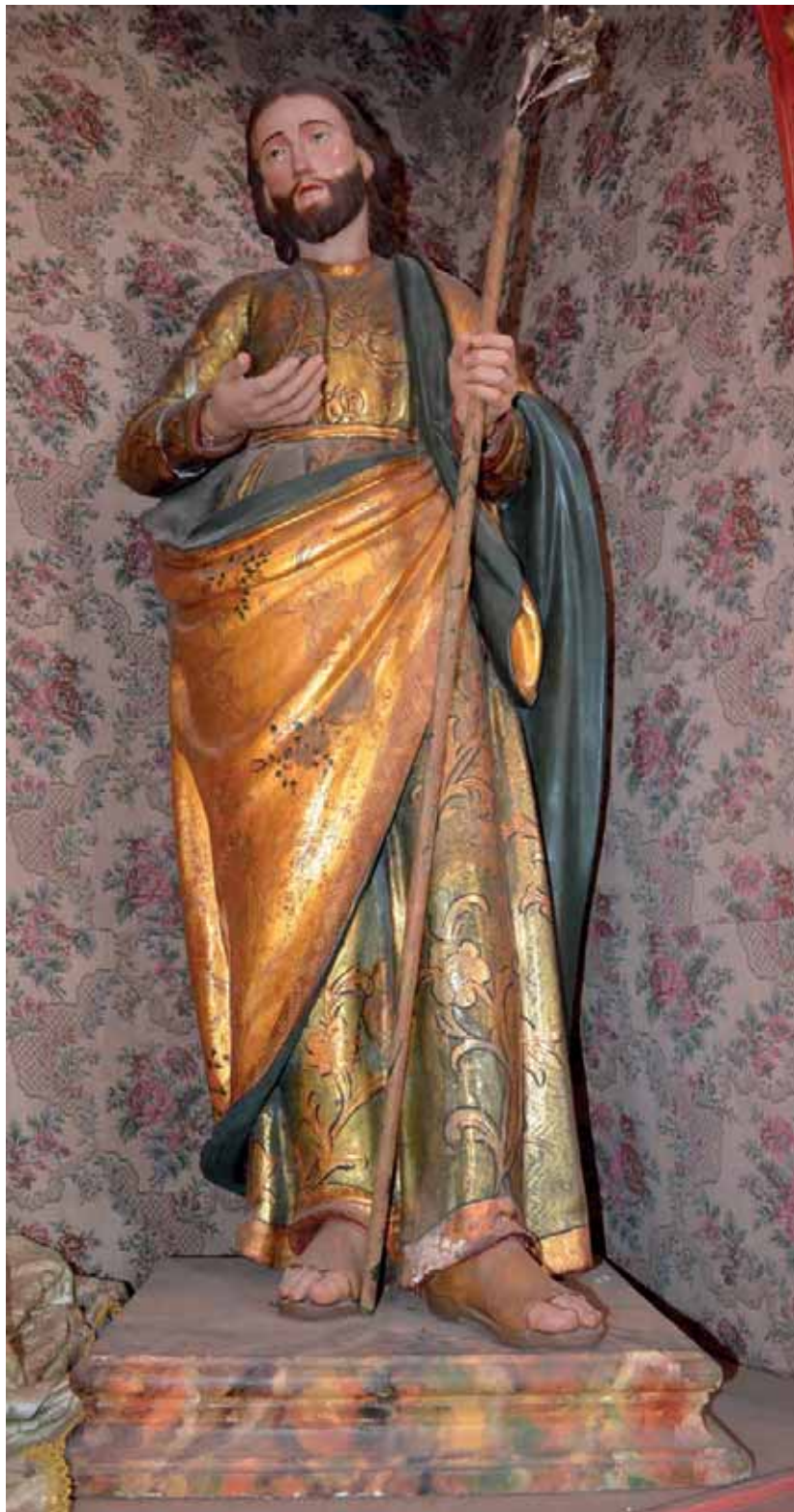
Fig. 3. San José . Iglesia de San Agustín, Icod de los Vinos