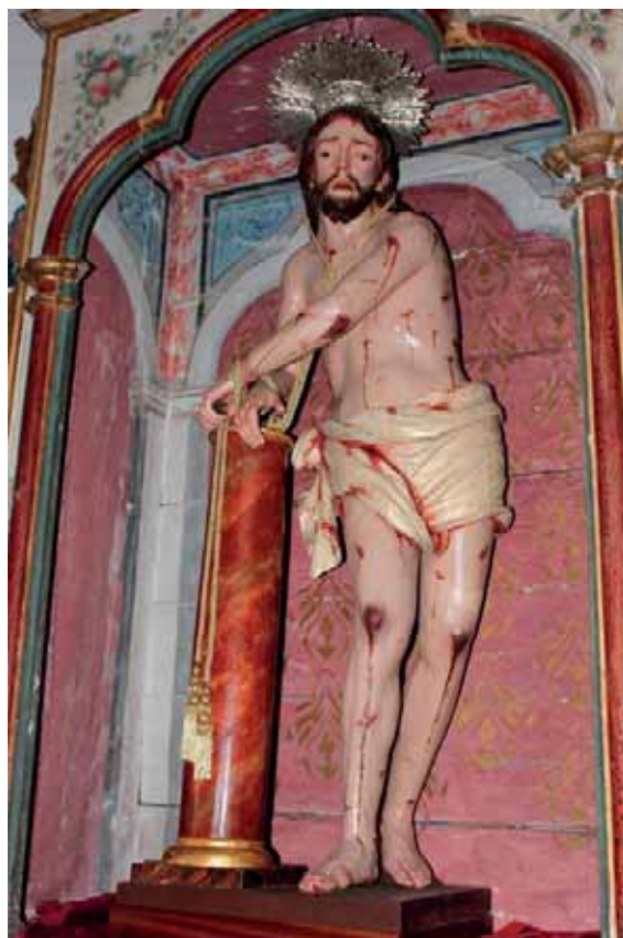
Fig. 7. Cristo atado a la Columna . Capilla de Nuestra Señora de los Dolores, Icod de los Vinos