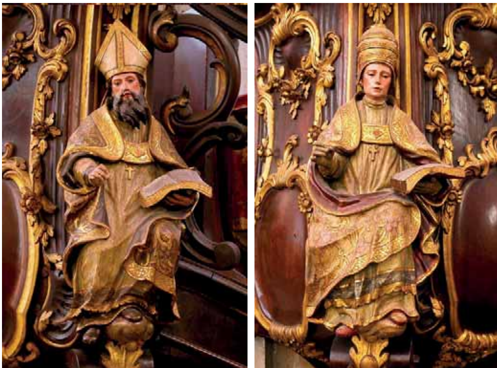
Fig. 18. Padres de la Iglesia [púlpitos]. Catedral de Santa Ana, Las Palmas de Gran Canaria