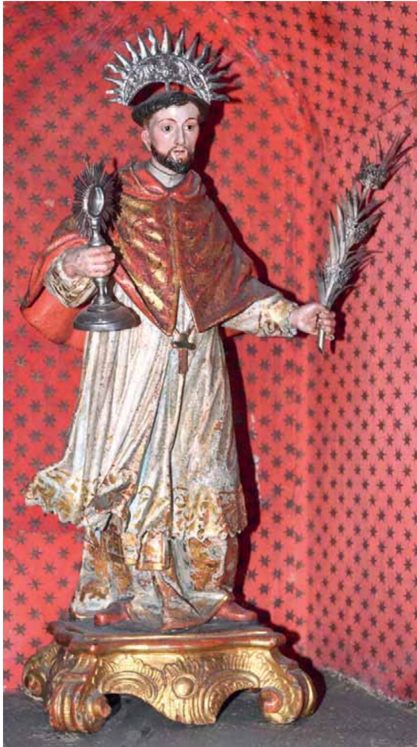
Fig. 6. San Ramón Nonato . Parroquia de San Francisco de Asís, Santa Cruz de Tenerife