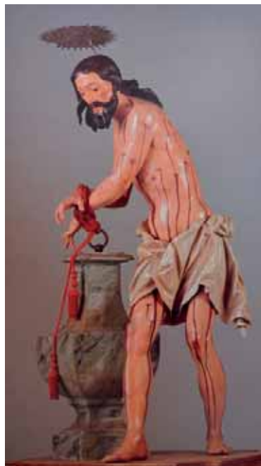
Fig. 25. Cristo atado a la Columna . Parroquia de Nuestra Señora de la Concepción, Valverde