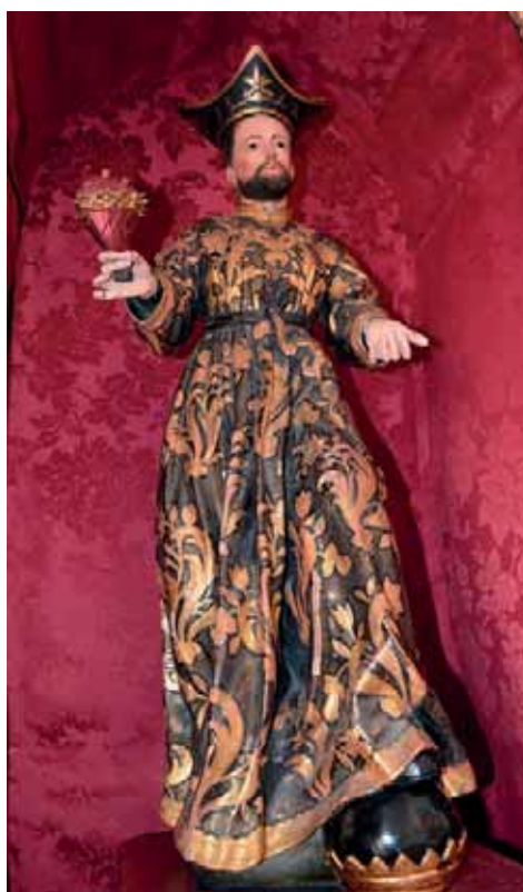
Fig. 20. San Cayetano . Iglesia de San Agustín, Icod de los Vinos