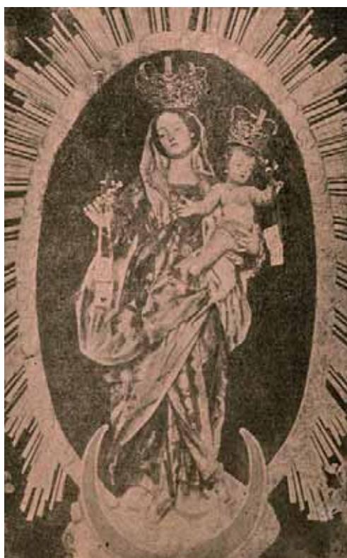
Fig. 2. Virgen del Carmen [desaparecida]. Parroquia de Nuestra Señora de Guadalupe, Teguişe