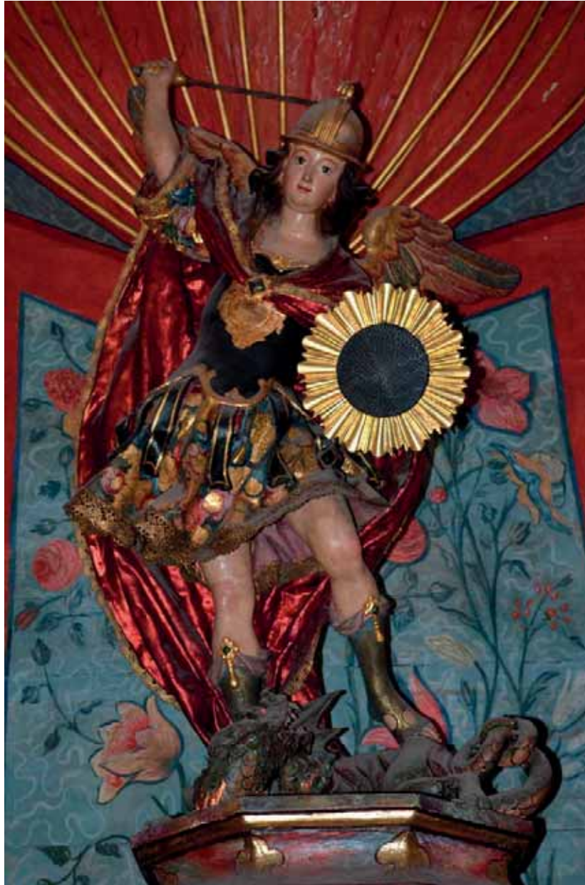
Fig. 11. San Miguel Arcángel . Parroquia de Nuestra Señora de la Asunción, San Sebastián de La Gomera