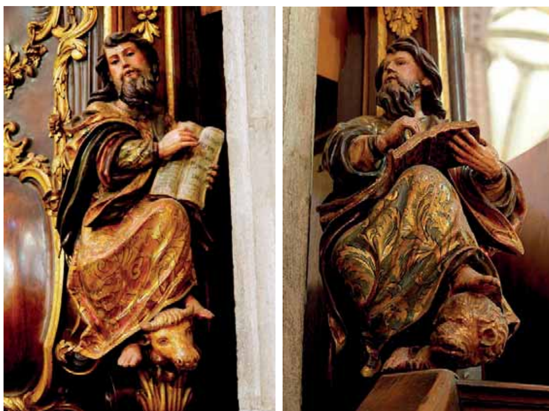
Fig. 16. Evangelistas [púlpitos]. Catedral de Santa Ana, Las Palmas de Gran Canaria