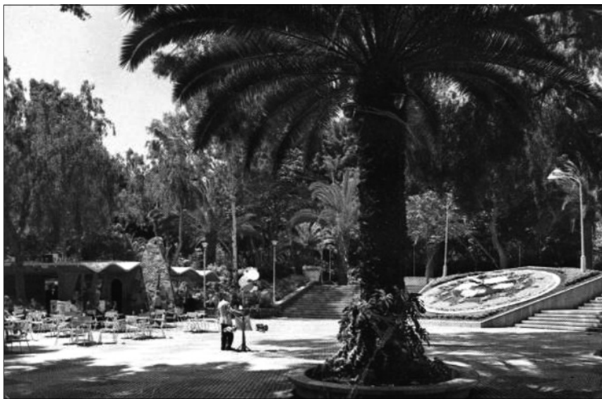
FIGURA. 2: Reloj de Flores. Santa Cruz de Tenerife.

En cualquier caso, como se comprueba fácilmente, las diferencias horológicas entre las islas de señorío y las realengas son abismales, ya que estas últimas partían de cánones bien fijados en sus ordenanzas, tal como hemos visto más arriba para el caso del Real de Las Palmas.