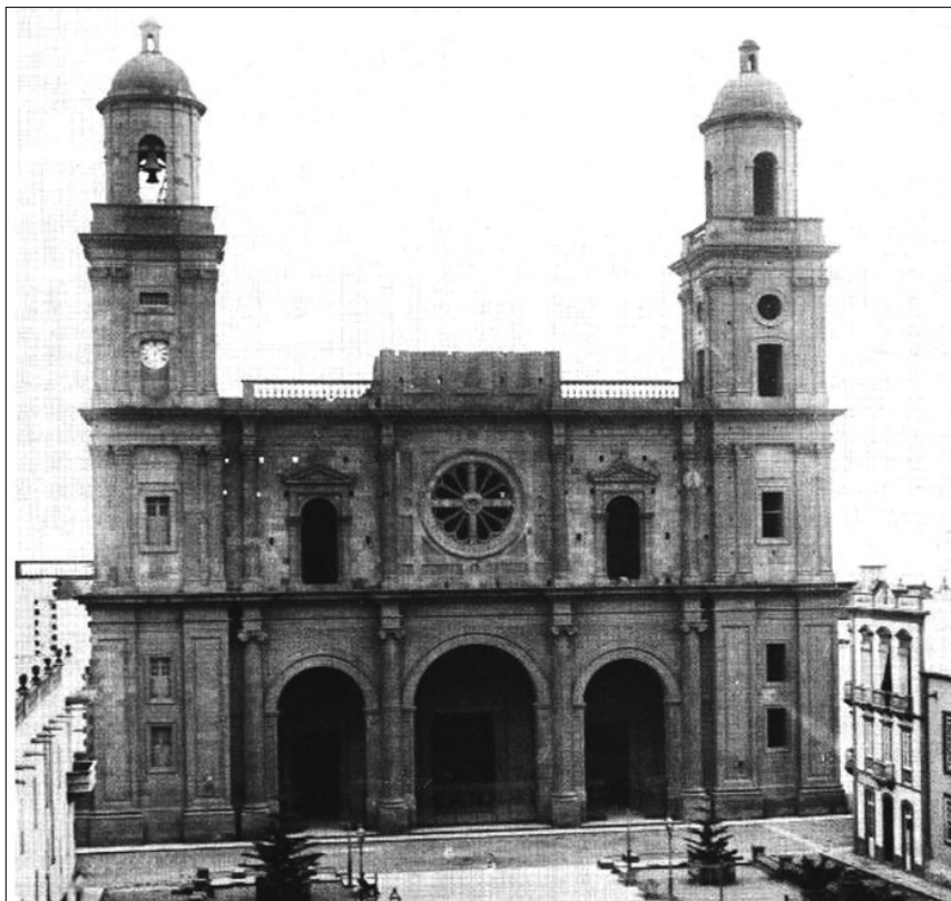
FIGURA 5: Fachada de la catedral de Las Palmas de Gran Canaria.