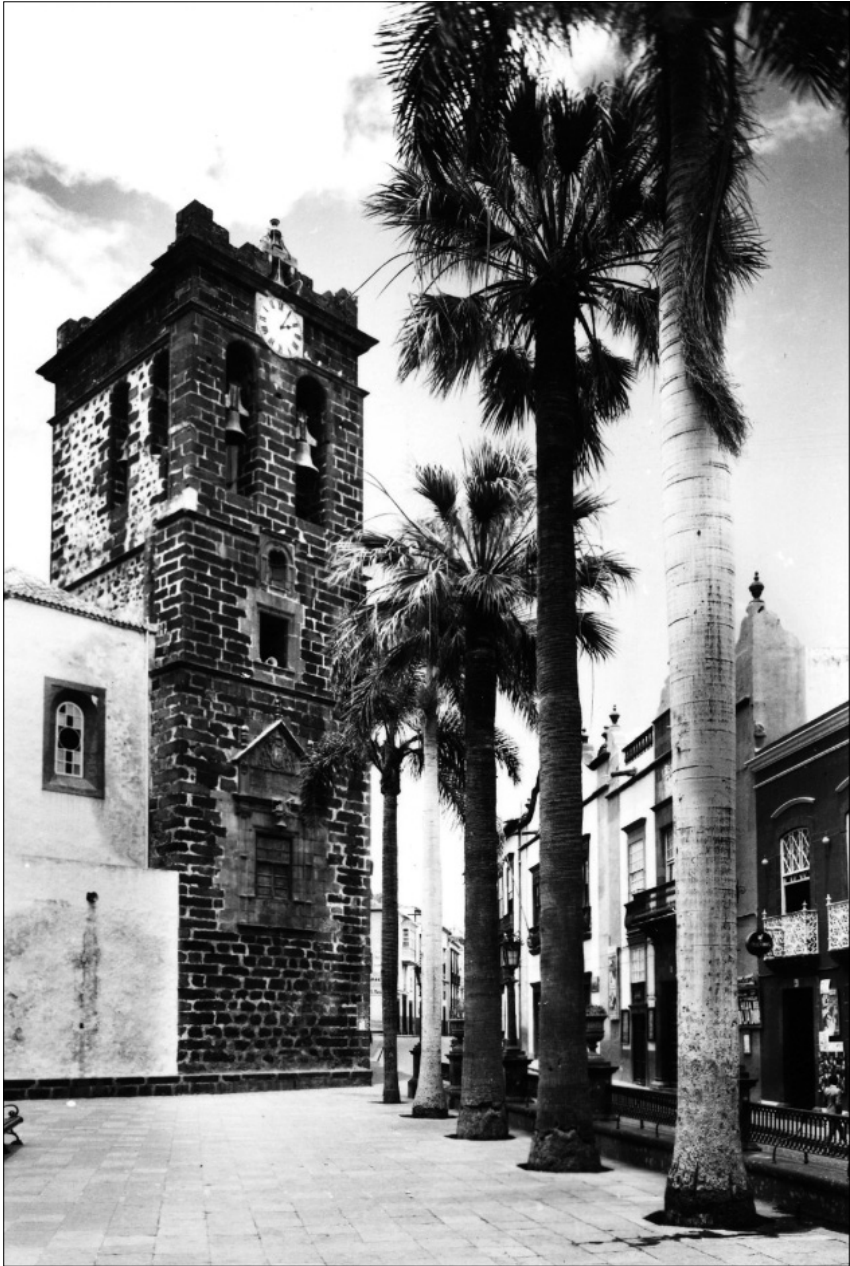
FIGURA 1: Torre de la iglesia de El Salvador. Santa Cruz de La Palma.