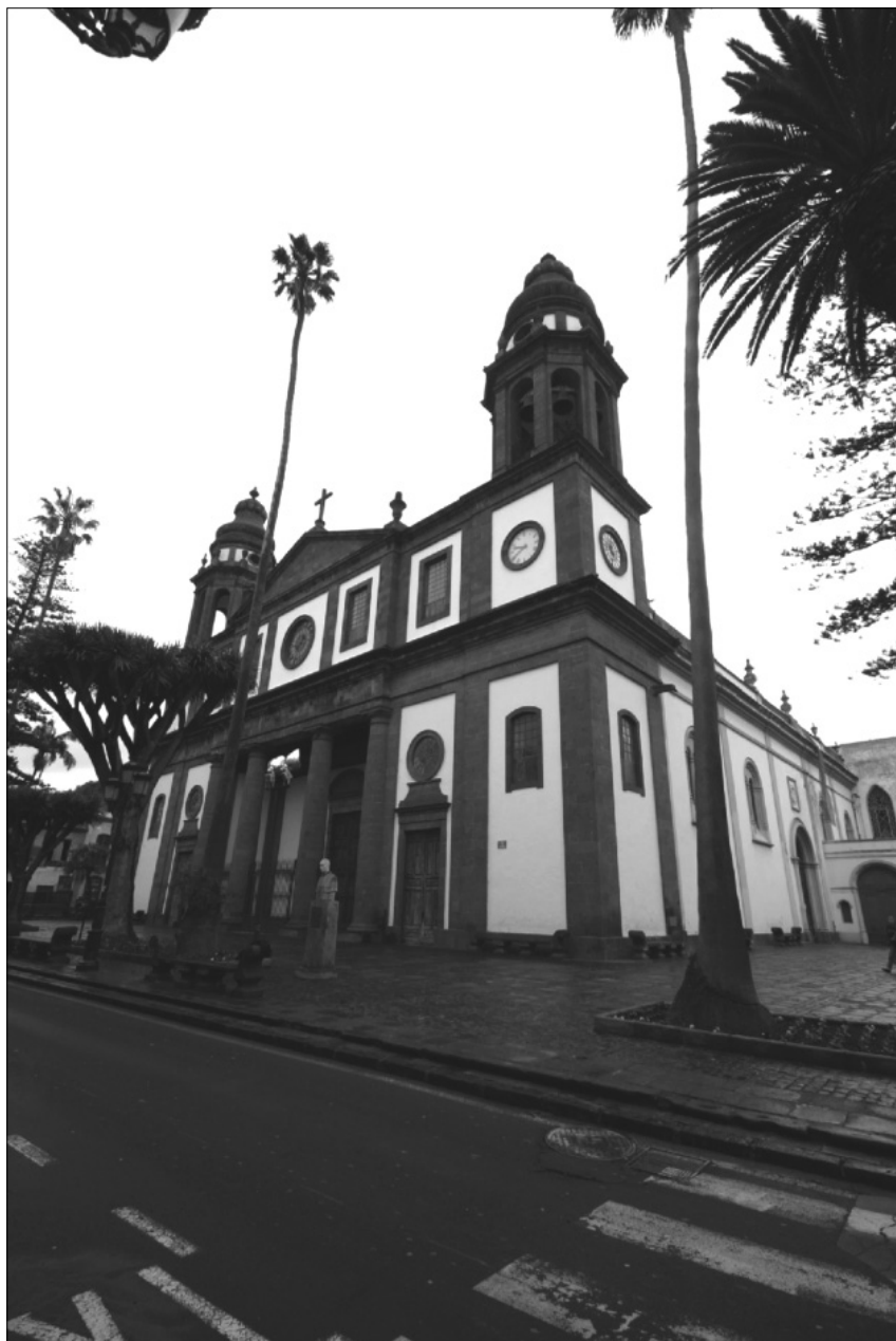
FIGURA 3: Fachada de la catedral de La Laguna. Tenerife.