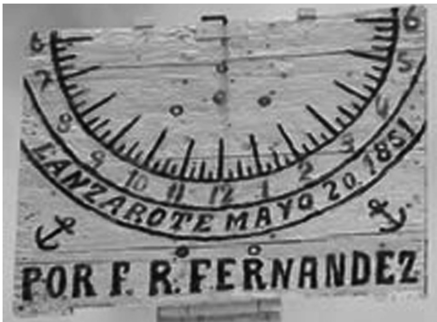
FIGURA 6: Reloj de sol de Tinajo (Lanzarote).