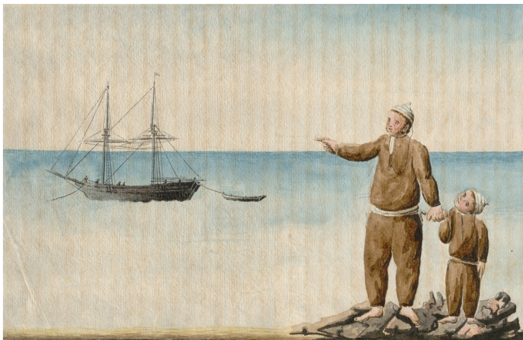
Bergantín canario costero y vestuario de sus tripularios según lo usaban hasta el año 1809.