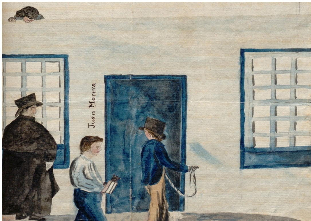
Fondo Álvarez Rixo, JAAR 3 (1). Biblioteca Universitaria de La Laguna.

En el mismo dorso, en el lateral izquierdo también se consigna: «Lanz.º Abril p.º la noche». Al igual que ocurre con el conjunto de la obra gráfica de nuestro autor, en estos dos casos no estamos ante obras técnicamente relevantes, pero poseen un innegable valor documental 59 .