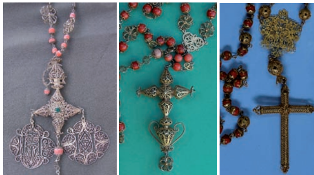
Fig. 91. Rosario, último tercio del siglo XVII. Filigrana de plata y coral.