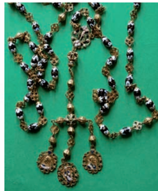
Fig. 74. Rosario. México, c. 1700. Oro esmaltado y coyol.