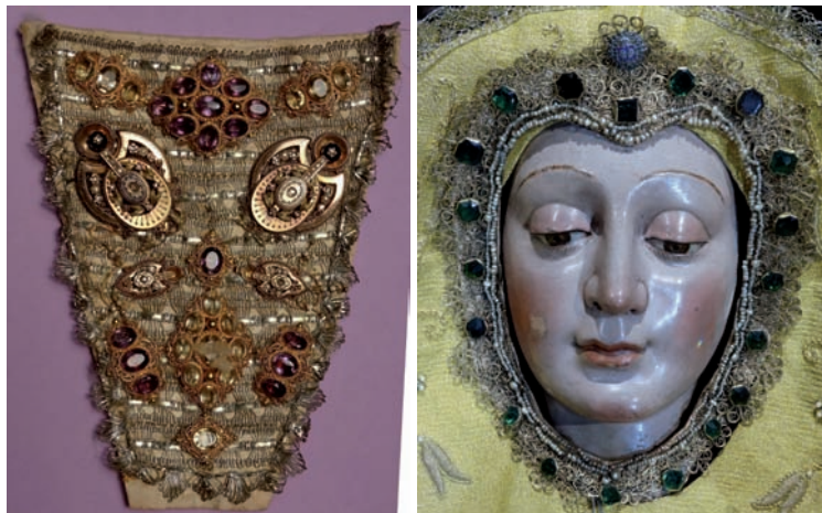
Fig. 14. Peto con joyas inglesas sobrepuestas. Siglo XIX.