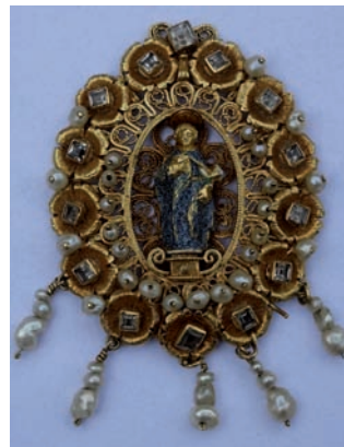
Fig. 48. Medallón-relicario de filigrana, c. 1700-1725. Oro, perlas y esmeraldas.