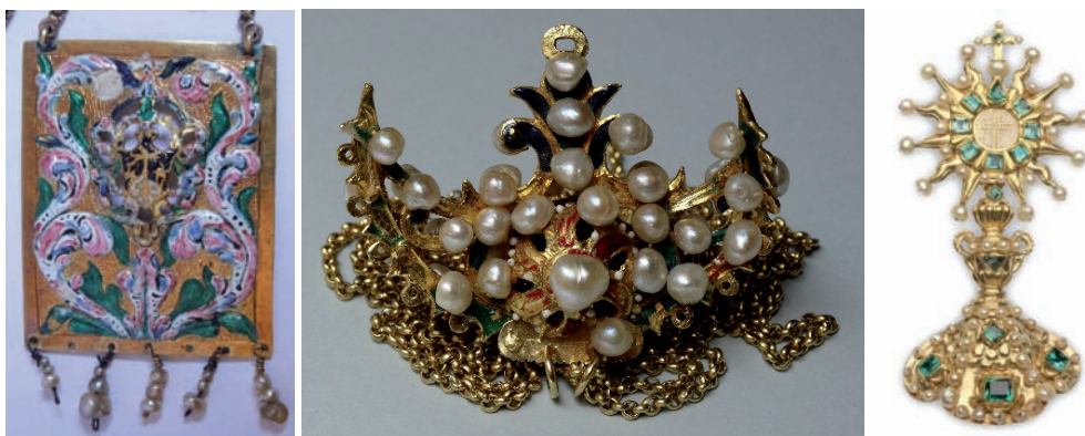
Fig. 20. Escapulario, c. 1730-1740. Oro esmaltado y perlas.