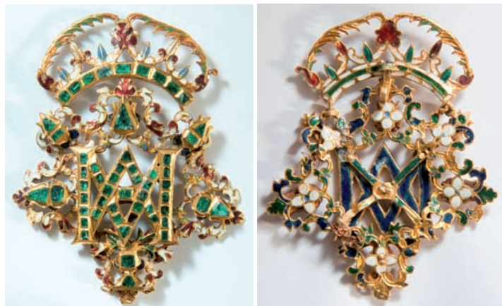
Figs. 16 y 17. Anagrama de María, ¿Sevilla? c. 1630. Oro esmaltado y esmeraldas. Anverso y reverso.