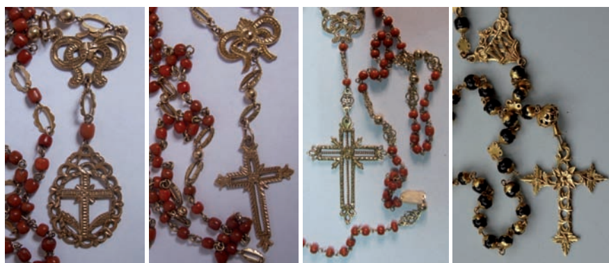
Figs. 87, 88 y 89. Rosarios. ¿La Habana? Siglo XIX. Oro y coral.