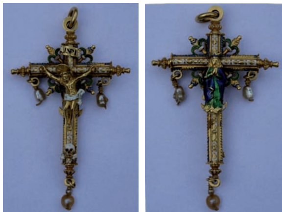
Figs. 27 y 28. Cruz pectoral, c. 1625-1650. Oro esmaltado y perlas. Anverso y reverso.