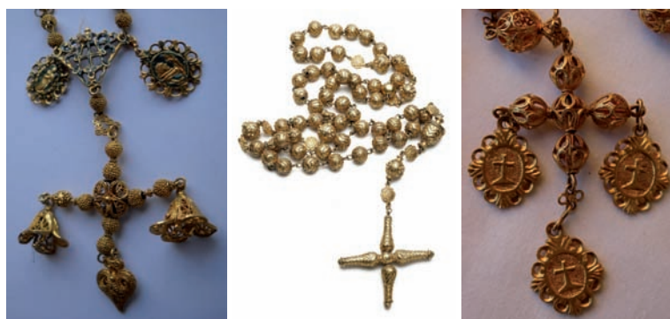
Fig. 94. Rosario. México, c. 1700. Oro esmaltado.

También de corales son dos rosarios de filigrana existentes en las iglesias de Santiago y la Concepción en Los Realejos, uno en oro de la virgen del Rosario del Realejo Bajo (fig. 92), con cuentas separadas por molinetes, maría trebolada y pareja cruz terminal de balaustres sobre jarra de dos asas; y otro en plata, más popular, de Nuestra Señora de los Remedios del Realejo Alto, con medallas florales de cuatro hojas acorazonadas, engarce en forma de mariposa y cruz de cuentas caladas y abalaustradas. Con el coral o con las perlas aparece de nuevo asociada la filigrana en dos ejemplares de hacia 1700. Excepcional tamaño presenta el de 15 misterios (130 cm) de la cofradía del Rosario de Puntallana (fig. 93), ofrecido como promesa —según se ha transmitido entre los parroquianos del lugar— por una devota que retornó de la isla de Cuba tras haber superado los embates de una tempestad durante la travesía. Las cuentas de coral, con casquillos de oro de cuatro pétalos entre cuatro picos, característicos desde el último tercio del siglo XVII 175 , están separadas por paternóster esféricos de filigrana; mientras que la pieza de reunión de los tres ramales adquiere perfil de escudete. Remata en cruz latina de sección cilíndrica trabajada de igual manera con un tejido de hilo de oro a base de roleos. El de la iglesia de la Concepción de La Orotava, con cuentas de perlas irregulares encadenadas en oro, presenta cruz latina de filigrana de sección romboidal.