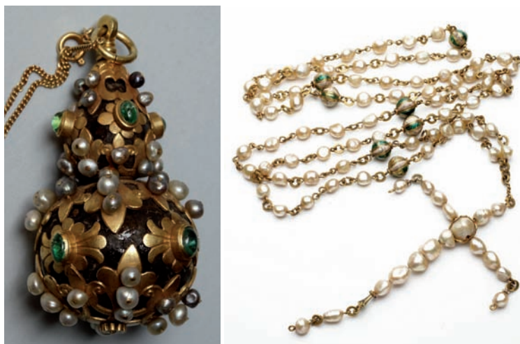
Fig. 7. Poma de ámbar engarzada en oro, perlas y esmeraldas. La Habana, c. 1700-1725. Donada por Dulce María Loynaz.