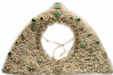
Fig. 13. Rostrillo. Conglomerado compacto de oro, perlas y esmeraldas, fabricado hacia 1770 con numerosos chatones de sortijas, diversas rosas de pecho y un collarite en oro esmaltado alrededor del óvalo de la cara.

El rostrillo para el diario, realizado en época más reciente sobre lama de plata y galones de encaje, está compuesto por hilos de perlas, broches y sobre todo anillos de los siglos XIX y XX con toda clase de piedras; mientras que la guirnalda en oro y gemas que a modo de orla guarnece la mantellina que cubre por su parte posterior la cabeza de la virgen se debe al orfebre palmero Manuel Hernández Martín (1972) 52 , quien integró en ella diversas orquídeas venezolanas de oro y perlas. La virgen de Guía (Gran Canaria) luce un original peto de gala de forma trapezoidal, montado sobre cartón forrado en lienzo y cubierto de pasamanerías en hilo de plata, sobre el cual se cosieron, colocadas con simetría, diversas joyas inglesas del siglo XIX: dos juegos georgianos de broches y sortijas con citrinos y amatistas, de hacia 1810-1820, y dos medallones o guardapelos en oro bajo y perlas, con su correspondiente pareja de pendientes, de hacia 1860-1870 (fig. 14).