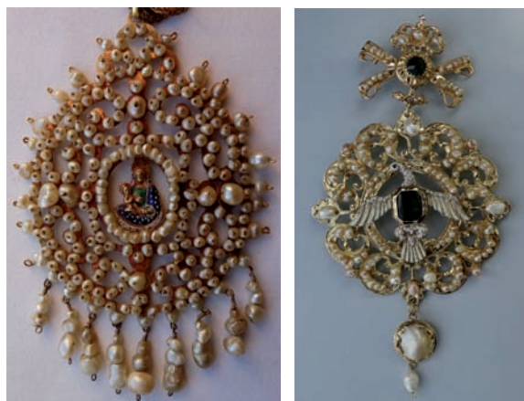
Fig. 69. Joya de pecho con la Virgen con el Niño. La Palma, c. 1705. Oro esmaltado y perlas.

De la estructura de rosa de pecho redondeada y cargada de perlas, con ventana central circular diseñada para una imagen de devoción, propia del último tercio del siglo XVII, deriva la joya de pecho — antes mencionada— que hoy forma parte del ajuar de la patrona de Los Llanos de Aridane con la Virgen con el Niño esmaltada en verde, azul y blanco, confundida en alguna ocasión con una Concepción (fig. 69). De buen tamaño (9 x 7 cm) y peso (tres onzas y media), este medallón oval está constituido por una plancha de oro calada que llegó a tener sobrepuestas por su cara delantera 278 perlas finas y calabacitas de diversos tamaños, taladradas y cosidas por el reverso, así como once chorreras con tres perlas cada una, de las que hoy perduran nueve. Perteneció a la cofradía del Rosario y se mandó hacer en la visita de 1705 con el oro y las perlas de unos zarcillos y unas cuentas sueltas. Su hechura consta en 1705-1711 con un costo de 45 reales 150 .