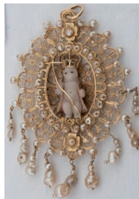
Fig. 45. Medallón-relicario de filigrana, último tercio del siglo XVII. Oro y alabastro con restos de esmalte.