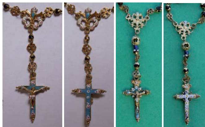
Figs. 76 y 77; y 78 y 79. Rosarios. México, c. 1700. Oro esmaltado y coyoil. Anverso y reverso.