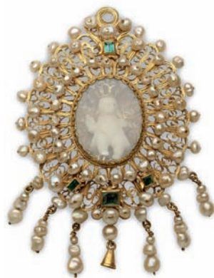
Fig. 47. Medallón-relicario de filigrana, c. 1700-1725. Oro y alabastro policromado.