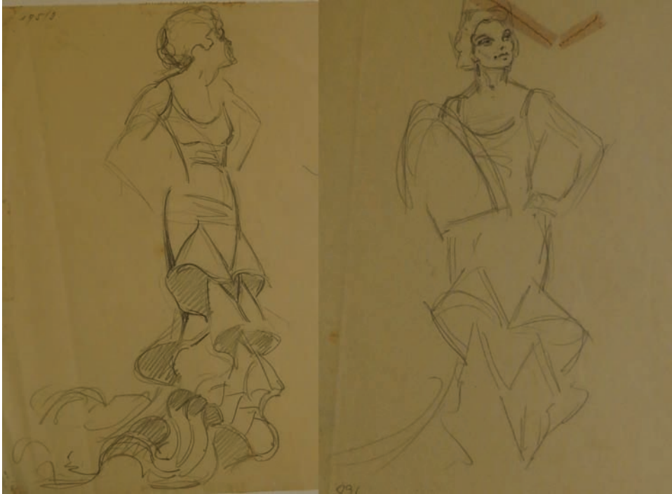
Fig. 9. Estudios de figurines para traje de bata andaluza para Conchita Supervía. 1931. Lápiz sobre papel. 22 x 28 aprox. Fondo Museo Néstor.