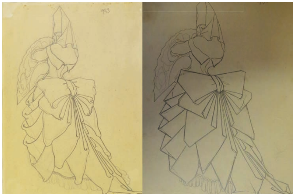
Fig. 4. Estudios de figurín de Segunda mujer tapada para El fandango de candil . 1927. Lápiz sobre papel. 21 x 27 cm. Fondo Museo Néstor.