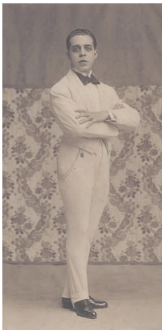
Fig. 1. Fotografía de Néstor Martín-Fernández de la Torre. 1912.

El diseño de escenografías y figurines para espectáculos convirtió a Néstor [Fig. 1] en una de las figuras claves para conocer el proceso de renovación escénica que tuvo lugar en nuestro país durante la llamada Edad de Plata de la cultura española 8 .