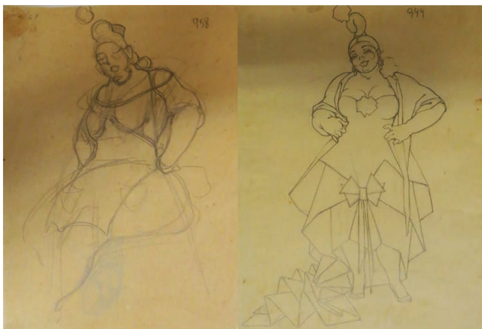
Fig. 5. Estudios de figurín de La vieja para El fandango de candil . 1927. Lápiz sobre papel. 21 x 27 cm. Fondo Museo Néstor.

Cabe destacar que los figurines masculinos y sus estudios son muchos más sencillos en su ejecución, aunque hay algunos motivos decorativos geométricos en sus ropas, prevaleciendo un sentido más práctico y menos controvertido a la hora de definirlos en comparación con sus compañeras femeninas de reparto, que llega incluso a tener un carácter caricaturesco, como en el caso del figurín de Don Lindoro o los quijotescos alguaciles 48 .