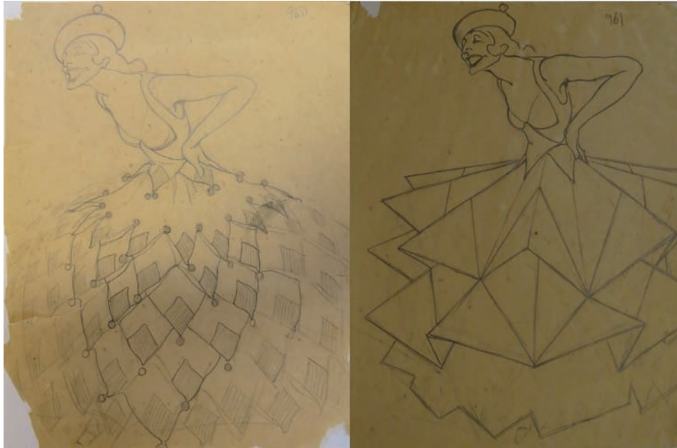
Fig. 2. Estudios de figurín de La niña bonita para El fandango de candil . 1927. Lápiz sobre papel. 21 x 27 cm. Fondo Museo Néstor.

sus convicciones artísticas y la naturaleza del encargo que le habían hecho. Se explica por que en los personajes femeninos ( La niña bonita , La primera mujer tapada , La segunda mujer tapada y La vieja ) [Figs. 2-5] apreciamos como nuestro artista dudó al llevar a cabo una doble representación de cada una, donde en unos predominan esas formas geométricas que antes mencionábamos, y en otros en los que éstas no existen, pues están mucho más en consonancia con la curva modernista y del art déco que nuestro artista profesaba. Al final acabaría por imponerse el compromiso antes que sus gustos, como podemos apreciar en los bocetos finales y las fotografías.