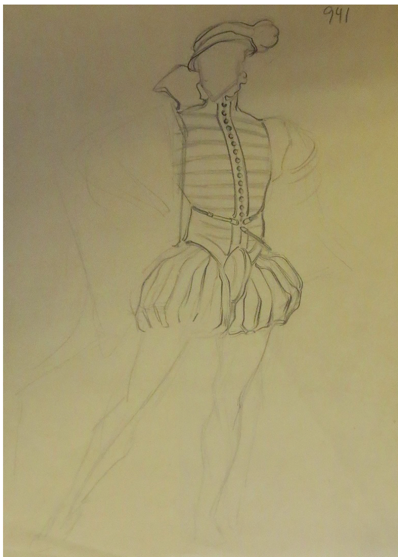
Fig. 12. Estudio de figurín para Don Giovanni. Seconde Costume . 1931. Lápiz sobre papel. 22x 28 cm. Fondo Museo Néstor.

En su última etapa, ya asentado en su ciudad natal, continuaría con el diseño de figurines teatrales, como demuestran muchas de las fotografías y de las críticas que se produjeron tras los estrenos de los espectáculos. Pero de la gran mayoría de ellos no tenemos ninguna constancia artística, pues se conservan tan sólo los figurines referidos a la modernización de la vestimenta tradicional grancanaria que utilizó en sus fiestas tipistas y el estudio de peinados para Una noche romántica (1937), custodiados en el Museo Néstor. En este sentido, en el Archivo de El Museo Canario se encuentra un programa de mano del mencionado espectáculo en el que se reproducen dos figurines, uno masculino y otro femenino sin rostros, como los de Don Giovanni . Lo que conlleva la ampliación de las referencias visuales en cuanto a la creación figurinista de esta etapa en la obra de Néstor 56 .