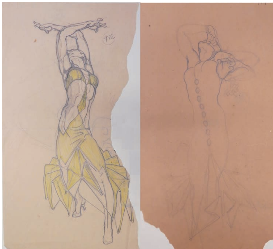
Fig. 7. Estudios de figurín de bailarinas para Triana . 1929. Lápiz sobre papel. 26 x 42. aprox. Fondo Museo Néstor.

Finalizada la etapa de colaboración con esta genial bailarina y coreógrafa, según afirma el propio Pedro Almeida, Néstor tuvo la necesidad de llevar a cabo nuevos encargos laborales para poder sobrevivir en la capital parisina.