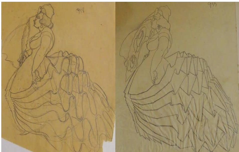
Fig. 3. Estudios de figurín de Primera mujer tapada para El fandango de candil . 1927. Lápiz sobre papel. 21 x 27 cm. Fondo Museo Néstor.