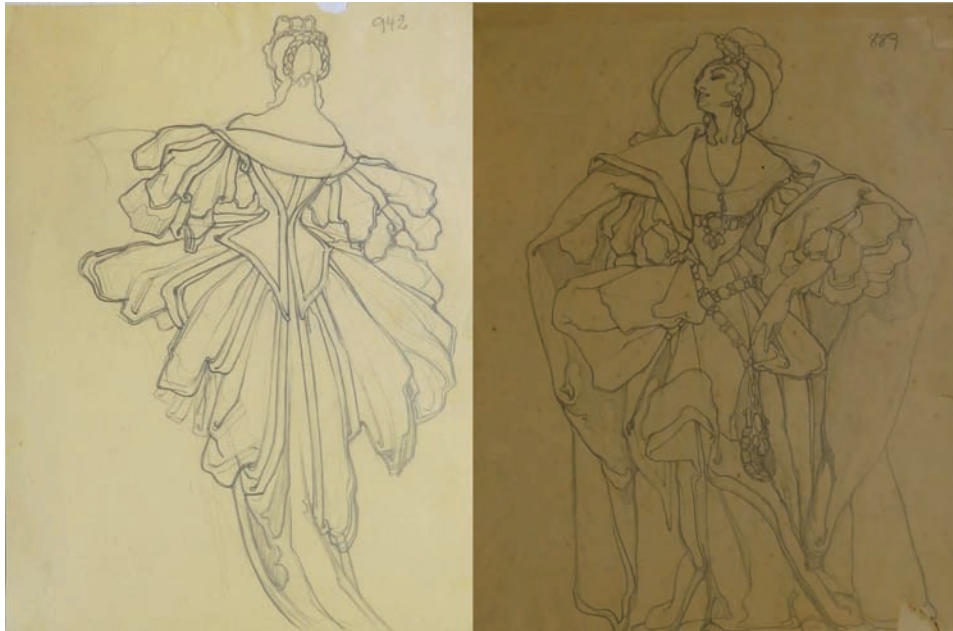
Fig. 8. Estudios de figurines para El aventurero . 1929. Lápiz sobre papel. 24 x 30 cm. Fondo Museo Néstor.

colorear que hemos dado a conocer en el presente estudio. En cualquier caso, uno de ellos es el dibujo preparatorio del figurín que se encuentra desaparecido, en el que se reproducen todos los detalles que la obra final muestra. Así que la aparición de este estudio significa que la pinacoteca posee casi de forma completa todas las fuentes que sobre este encargo generó nuestro artista.