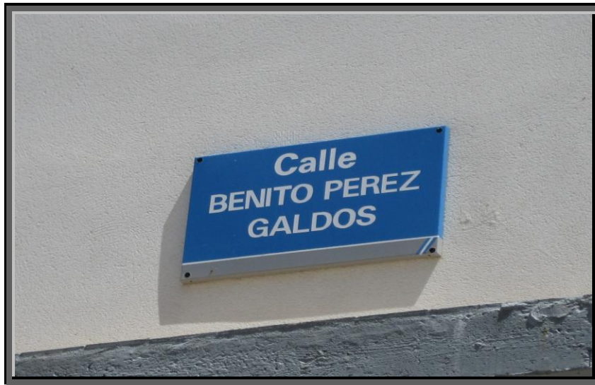
Rótulo de la calle repuesta y dedicada a Pérez Galdós en Jerez