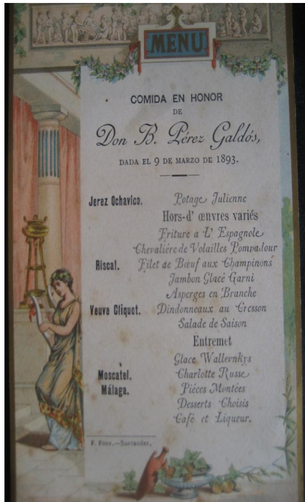
Menú del banquete en Honor a Pérez Galdós, 1893 Ente los vinos esta el jerez Ochavico