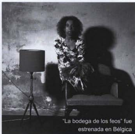
"La bodega de los feos" fue estrenada en Bélgica