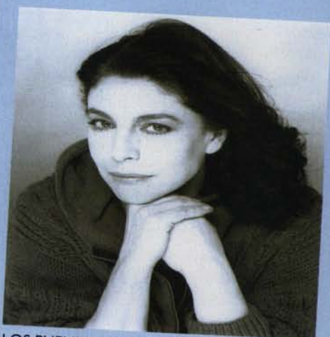
LOS PUENTES DE MADISON de R. J. Waller Con Charo López, dirección de Miguel Narros y escenografía de Andrea D'Odorico 12, 13 y 14 de julio

¿Seremos capaces de seguir la carrera de tres discretos olímpicos en esta carrera de música y humor? ¿Será verdad eso de que los últimos serán lo primeros? Maratón trata de la resistencia del ser humano al fracaso y la desventura.