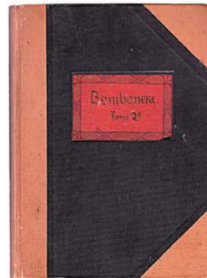
Bombonera, Tomo II (1920-1921)