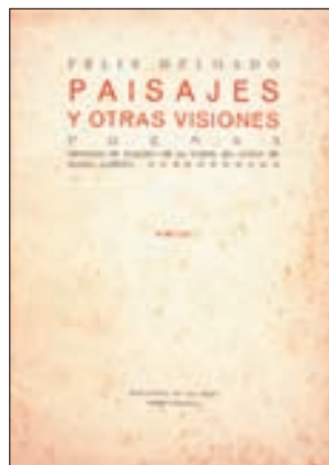
Cubierta de Paisajes y otras visiones: (poemas) de FÉLIX DELGADO, 1923 Casa-Museo Tomás Morales