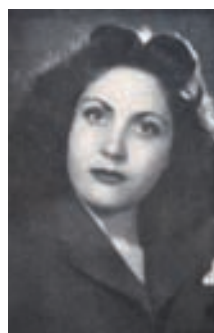
Fotografía de PINO OJEDA en Niebla de sueño , 1947 Casa-Museo Tomás Morales