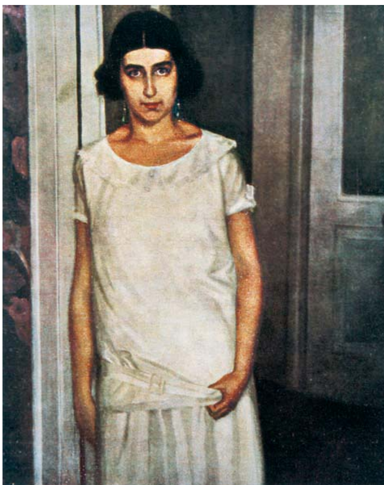
Estudio para retrato en La Esfera , nº 653 por Ramón Manchón Casa-Museo Tomás Morales

El público isleño ve una obra de Ramón Manchón por primera vez, al menos después de su muerte, en 1999, cuando Leandra Estévez, comisaria de la exposición, La Estampa en Canarias. 1750-1970 (Casa de Colón-Cabildo de Gran Canaria y CajaCanarias) muestra el déco más puro del autor en las ilustraciones que realizó para la novela de La Desertora , de Halma Angélico. El año siguiente, La Casa-Museo Tomás Morales de Moya y el Museo Néstor de Las Palmas de Gran Canaria y CajaCanarias, promovían la exposición regional Modos modernistas , en que se incluyeron obras impresas en La Esfera y Blanco y Negro de Manchón, provenientes de colecciones privadas y públicas. En 2001, se reseñaba la figura y obra del artista en Imágenes para un siglo , comentándose uno de sus lienzos naturalistas, sin que el autor supie-