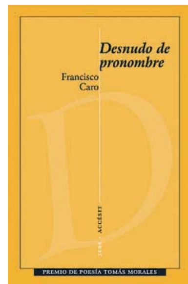
Cubierta “Desnudo de pronombre” Premio de Poesía Tomás Morales (2008)

El Premio Literario de Poesía Tomás Morales se creó en 1955 vinculado a la Casa de Colón. La inauguración, en 1976, de la Casa Museo Tomás Morales traslada la tutela del certamen a la institución que guarda la memoria y obra de uno de los buques insignias del modernismo. Este certamen se ha convertido en uno de los más prestigiosos de su