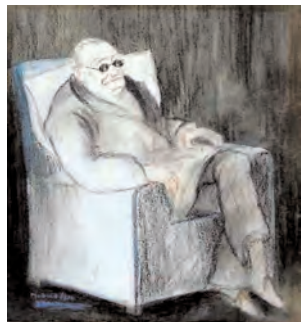
Benito Pérez Galdós por Leal da Câmara, 1916. Casa Museu Leal da Câmara en Sintra (Lisboa)

Aunque no ha quedado constatado, nos atrevemos a adivinar que entre lo comentado, Galdós le preguntó por su obras, tocándose el tema de la caricatura, manifestando su propio interés y hasta práctica, desde sus años mozos, por la viñeta satírica y la caricatura.