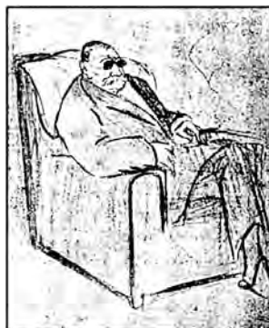
Pérez Galdós por Leal da Câmara (abril de 1916). Dibujo que ilustra Miren Ustedes (Porto, 1917)

Allá se acercó, en busca del hotelito, de fachada de estilo arabesco en la calle Hilarión Eslava, esa vía que al visitan-