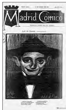
Leal da Câmara por Francisco Sanja en la cubierta de Madrid Cómico , 1899

Ponía pie en Madrid, como invitado, para dar una conferencia sobre “La ciencia y el arte de la Publicidad” en el Ateneo Científico y Literario y Artístico, con sede en la calle del Prado. Porque también en España, y no únicamente en Portugal, Francia o Bélgica, se apreciaba igualmente su nueva aportación artística al campo de la publicidad comercial. Se sabía de su actividad en esta faceta artística vinculada a la vida comercial y, desde 1914, una pequeña