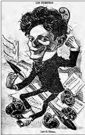
Leal da Câmara por Pedro de Rojas (1901)