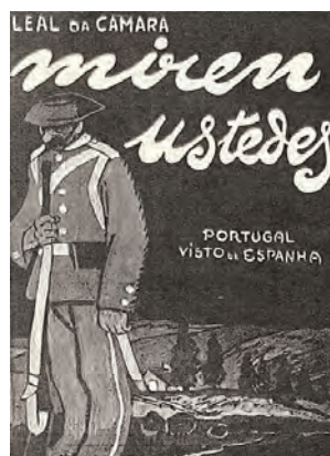
Cubierta de Miren ustedes. Portugal visto de Espanha (1917)

Aunque destinada al lector brasileño y portugués, por ser impresiones sobre España, el libro fue enviado a algunos periódicos y revistas y a los conocidos, pero no se vendió en librerías españolas. Y así, la obra de Leal da Câmara, perjudicada por la tensa discusión entre aliadófilos y partidarios de Alemania en la que seguía enfrascada la política, fue casi ignorada. Primero, el Gobierno español, con su ambigua neutralidad frente al conflicto europeo, no había posibilitado al cronista las informaciones requeridas ni le facilitó las entrevistas que hubiese deseado, y, una vez aparecido el libro, no gustó el enfoque ideológico de algunos de sus frontales comentarios políticos y ciertas aprecia-