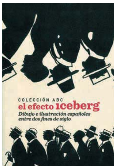
Cubierta de Colección ABC. El efecto iceberg. Dibujo e ilustración españoles entre dos fines de siglo (2010).

Museo ABC. Centro de Arte, Dibujo e Ilustración. (Madrid). Del 17 de noviembre de 2010 al 13 de marzo de 2011.